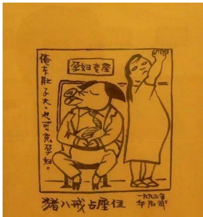
8. Hua Junwu (1915-2010), Zhu Bajie s'assoit à la place réservée aux femmes enceintes (sous le prétexte que lui aussi a un gros ventre) , encre sur papier, 1993, Shanghai, China Art Museum.