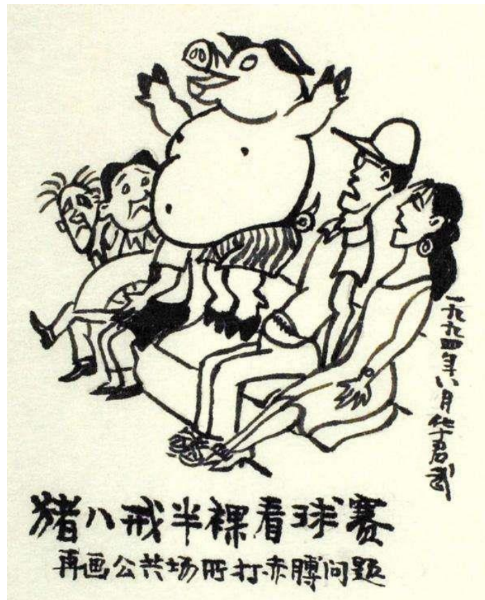
7. Hua Junwu (1915-2010), Zhu Bajie assiste à un match à moitié nu , 1994, Shanghai, China Art Museum