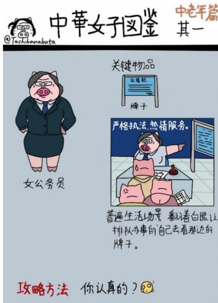
11. Zhang Dongning, un des exemples de sa série sur les jeunes chinois et chinoises ; sa signature se trouve en haut à gauche.

personnages sont généralement d'aspect agréable : longilignes, visages aux grands yeux, petits nez, cheveux savamment coiffés, etc. Tout le contraire des piggle de Zhang Dongning. Elle se met elle-même en scène, via sa signature, et parfois visuellement, sous l'aspect d'un cochon (ill. 11).