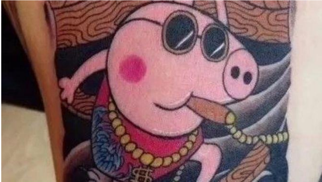
9. Peppa Pig tatouée en « gangsta ».

désigner les « gangsters » et, involontairement, un symbole pour tous ceux qui souhaitaient vivre sans avoir à subir la contrainte permanente de la pression sociale.