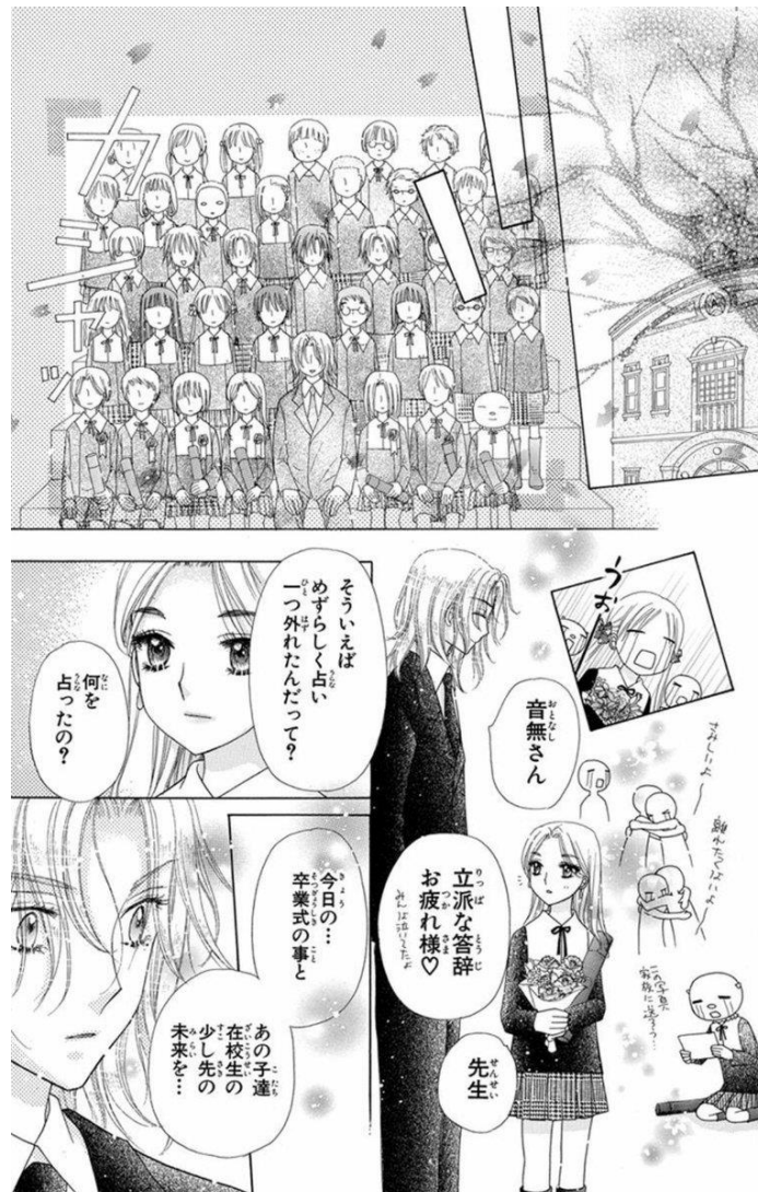
12. Images tirées du Gakuen Alice : Buta se trouve en bas à droite, habillé en collégienne, mais aussi dans la case en haut à gauche, au premier rang