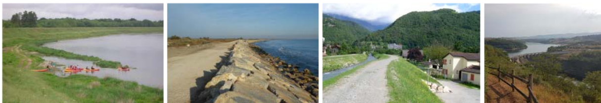
FIGURE 1. Digue fluviale près d'Orléans / digue côtière près des Saintes-Maries-de-la-Mer / digue de torrent à Domène / barrage de rétention des crues à Villerest (source : INRAE et DREAL Centre-Val de Loire).

En France, le linéaire de digues de protection contre les inondations est estimé à plus de 10 000 km, ces chiffres concernant principalement les premières lignes de défenses des systèmes de protection. Si près de 9 300 km sont officiellement recensés (environ 8 800 km de digues continentales et 500 km de digues maritimes), les recensements spécifiques des protections côtières mentionnent près de 1 300 km de digues maritimes [3 ; 4] conduisant à compléter les chiffres officiels. La hauteur maximale moyenne des digues est de 6 mètres, avec des spécificités locales. Elles sont généralement construites en terre à partir de matériaux locaux, avec une histoire longue et complexe. Elles sont globalement hétérogènes et mal connues quand elles ne sont pas documentées dans les archives historiques ou récemment construites ou renforcées. Le matériau des digues fluviales est généralement limoneux ou argileux, tandis que celui des digues maritimes est souvent constitué d'un noyau sableux et limoneux, recouvert de roches ou de structures de protection rigides.