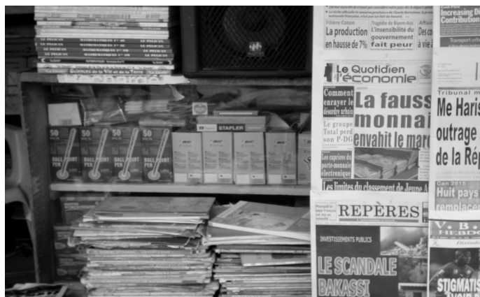
Photographie 1 : vue partielle d'un kiosque

Outre tous ces produits, une imprimante multifonction permet aussi aux clients de M. Job de faire les photocopies des pages de journaux qui les intéressent 112 ou de tout autre document, son kiosque étant situé à proximité d'un centre hospitalier, de nombreux établissements scolaires, et de quelques administrations situées à deux minutes de marche. Ce kiosque est aussi désormais un espace où l'on peut trouver un rafraîchissement (alcoolisé ou non), le temps de jeter un coup d'œil sur les titres à la Une . La vente de l'eau conditionnée dans des sachets plastiques est aussi l'une des principales sources de recettes, surtout les jeudis, vendredis et samedis. Une des particularités étant que le kiosque est situé à proximité d'une morgue, où des centaines de personnes accourent ces jours là pour des mises en bière ou pour des inhumations au cimetière situé lui aussi non loin. Les jours d'affluence, Job accorde plus d'attention aux clients en quête de collation qu'aux acheteurs de journaux.