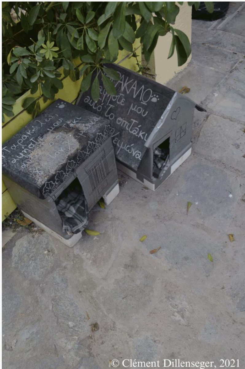
Εικόνα 3: Σπίτι γάτας σε σχήμα ανθρώπινης κατοικίας στο Θησείο

Με τον ίδιο τρόπο, υπάρχουν και πολλές άλλες κατασκευές για τα ζώα που μαρτυρούν μια ειρηνική, ακόμη και αλληλέγγυα συμβίωση μεταξύ των γάτων και των κατοίκων. Λίγο-πολύ ορατά, αυτά τα καταφύγια για αιλουροειδή αποτελούν σημάδια της παρουσίας των γάτων στην πόλη και της νομιμοποίησής τους να είναι μέρος της αστικής ζωής. Αυτή η ιδέα ενισχύεται συχνά από την ανθρωποποίηση που χαρακτηρίζει ορισμένες από αυτές τις άτυπες διευθετήσεις: μερικές φορές, οι κατασκευές αυτές ακολουθούν τους ανθρώπινους κώδικες κατοίκησης, όπως στη εικόνα 3.