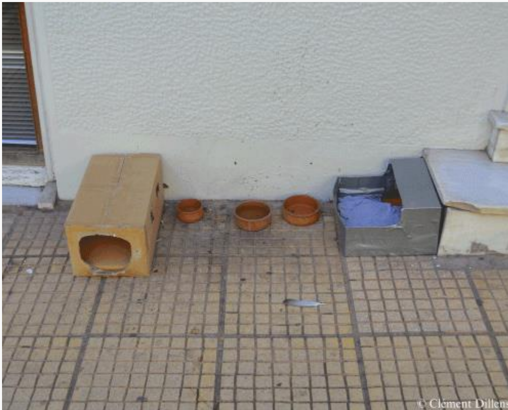
Εικόνες 1 & 2: Δύο ταΐστρες αδέσποτων γάτων στο Παγκράτι (1) και στο Θησείο (2)