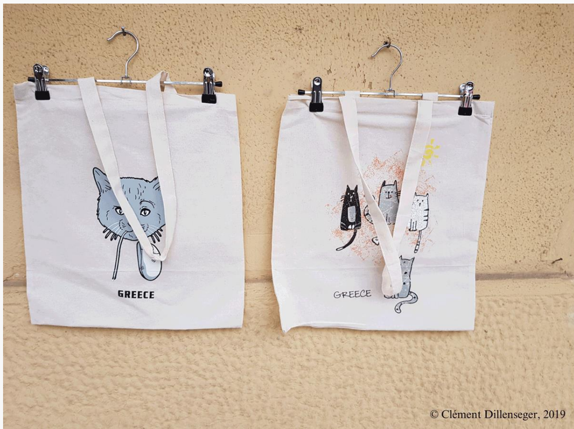
Εικόνα 10: Γάτες, σύμβολα της Αθήνας ως αναμνηστικά για τους τουρίστες

Μια άλλη υπηρεσία, που προσφέρει το τουριστικό γραφείο της πόλης της Αθήνας ThisIsAthens, είναι η εφαρμογή για κινητά που δημιουργήθηκε από την ελληνική εταιρεία ClioMuse Tour. Αυτή η εταιρεία, που είναι παρούσα σε περισσότερες από 35 χώρες στον κόσμο, προσφέρει την αγορά ξεναγήσεων χωρίς οδηγό μέσω μιας εφαρμογής για κινητά. Η ξενάγηση αυτή «πατάει» στο κλασικό τουριστικό κύκλωμα (εικόνα 9) περνώντας από διάφορα σημεία ενδιαφέροντος (Αναφιώτικα, Ρωμαϊκή Αγορά, Παλιά Αγορά, Βυζαντινή εκκλησία) και προσεγγίζει διάφορες ιστορικές περιόδους (από την αρχαιότητα έως τις αρχές του 19 ου αιώνα). Σε αυτή την «ιστορική» επίσκεψη, η παρουσία των σημερινών γάτων υπονοεί την προηγούμενη και διαρκή παρουσία των αιλουροειδών στην πόλη, ενώ δεν υπάρχει στοιχείο που να αναφέρεται στην ενσωμάτωση αυτών των ζώων στον σύγχρονο ιστό της Αθήνας. Έτσι, εντάσσονται στην αφήγηση για την Αθήνα ως αιώνιας πρωτεύουσας της Ελλάδας και, σε αυτό το πλαίσιο, εμπορευματοποιείται η εικόνα τους χωρίς να λαμβάνονται υπόψη οι οικολογικές σχέσεις που τους δένουν με την πόλη. Οι γάτες της Αθήνας μετατρέπονται σε σύμβολα της πόλης της Αθήνας που τα βρίσκει κανείς σε καρτ ποστάλ και σε άλλα αντικείμενα για τους τουρίστες (εικόνα 10). Όλα αυτά μαρτυρούν ένα συγκεκριμένο τρόπο που τίθεται σε λειτουργία (Barua, 2017) η αθηναϊκή πανίδα για την τουριστική αγορά.