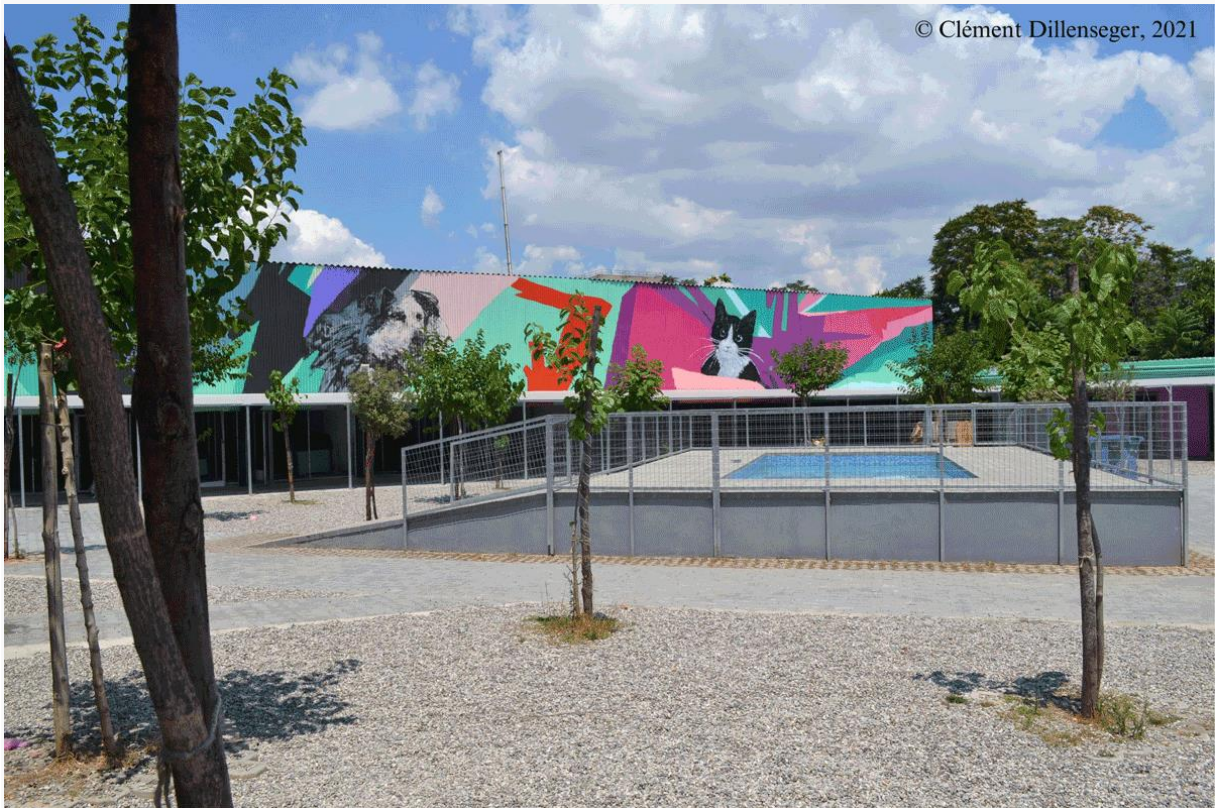
Εικόνα 5: Η Αθήνα ανάμεσα σε σκύλους και γάτες: το αέτωμα του νέου δημοτικού καταφυγίου στον Ελαιώνα / Βοτανικό