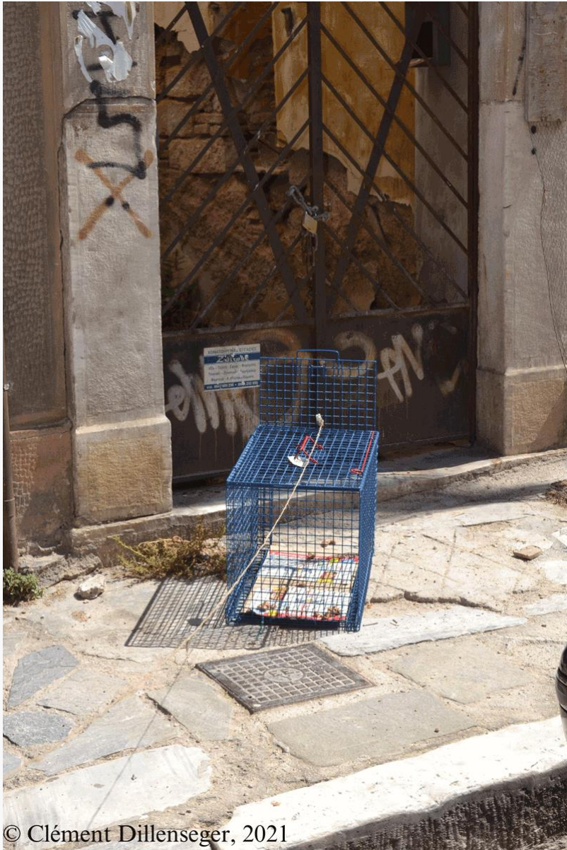
Εικόνα 4: Ένα κλουβί-παγίδα για μια αδέσποτη γάτα με στόχο να στείρωθεί