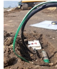
FIGURE 4. Mise en place d’une instrumentation de talus de digue côté val pour l’observation de son comportement vis-à-vis de son environnement.