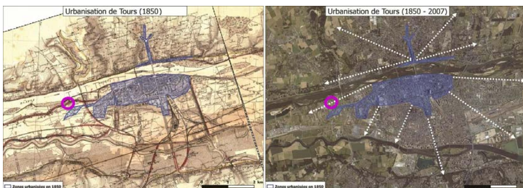
FIGURE 5. Évolution des enjeux d’une zone protégée au cours du temps.

Il est constaté une évolution des enjeux au sein de la zone protégée par le système d’endiguement du val de Tours, avec par exemple l’extension de l’urbanisation à Tours (Figure 5). Ceci invite à réfléchir au suivi de la levée au niveau de points spécifiques. Le site de La Riche instrumenté à l’automne 2023 est repéré en rose sur les cartes.