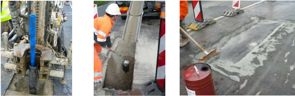
FIGURE 2. Mise en place d'un tubage d'essai de perméabilité pour le suivi à 10 ans d'une tranchée de sol mixe.