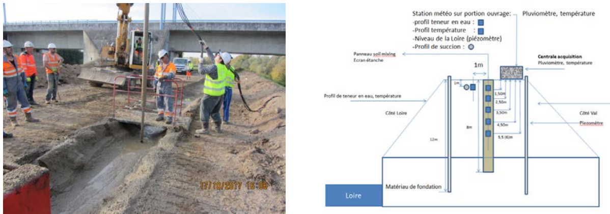
FIGURE 3. Mise en place d'une instrumentation dans une tranchée de sol mixé pour l'évaluation de son comportement à long terme vis-à-vis de son environnement.