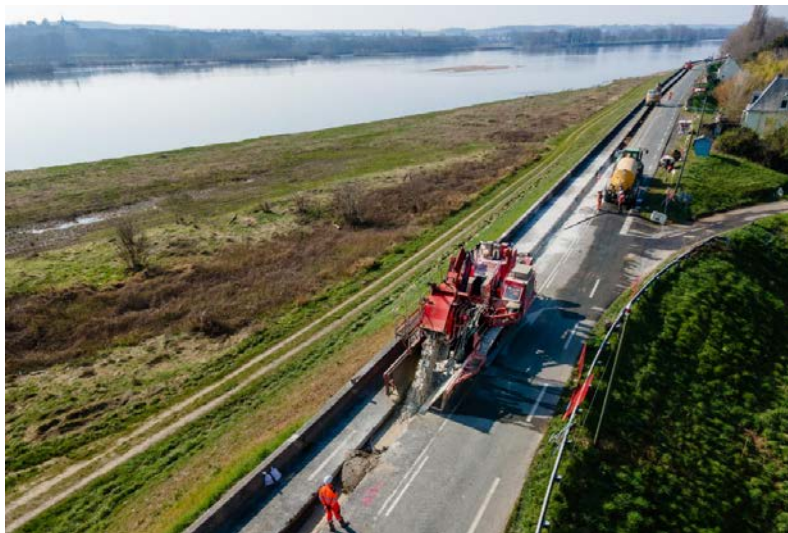
FIGURE 1. Vue générale de la réalisation d'un écran par tranchée de sol mixé.

La levée de Veuves fait partie du grand système d'endiguement protégeant le val de Cisse-Vouvray en rive droite de la Loire entre Blois et Tours. En 2014, un écran étanche par tranchée de sol mixé ( deep soil mixing ), tel qu'illustré par la Figure 1, a été constitué dans le corps de cette levée sur un tronçon d'un kilomètre.