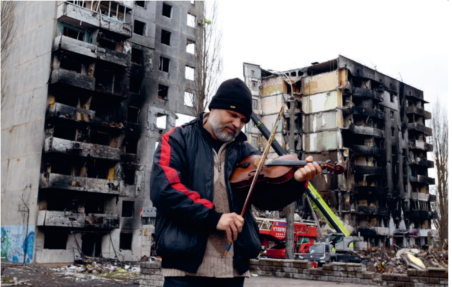
Le 9 avril 2022, dans la ville ukrainienne de Borodyanka, un violoniste joue en hommage aux victimes des bombardements.

états émotionnels, résilience, capacité d’agir, spiritualité, préservation des traditions, ouverture aux autres, rencontre avec les sociétés d’accueil, ressources pédagogiques, santé, élaboration d’un projet de vie. Ainsi se dit une implémentation artistique vertueuse.