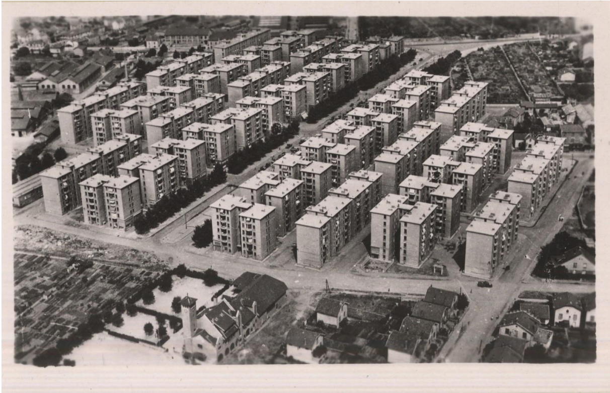
Figure 3 : Vue aérienne, années 1940 (?)