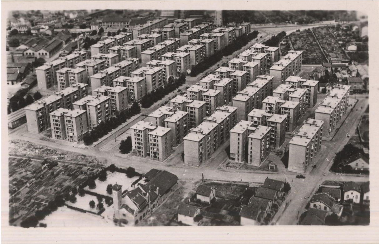
Figure 3 : Vue aérienne, années 1940 (?)