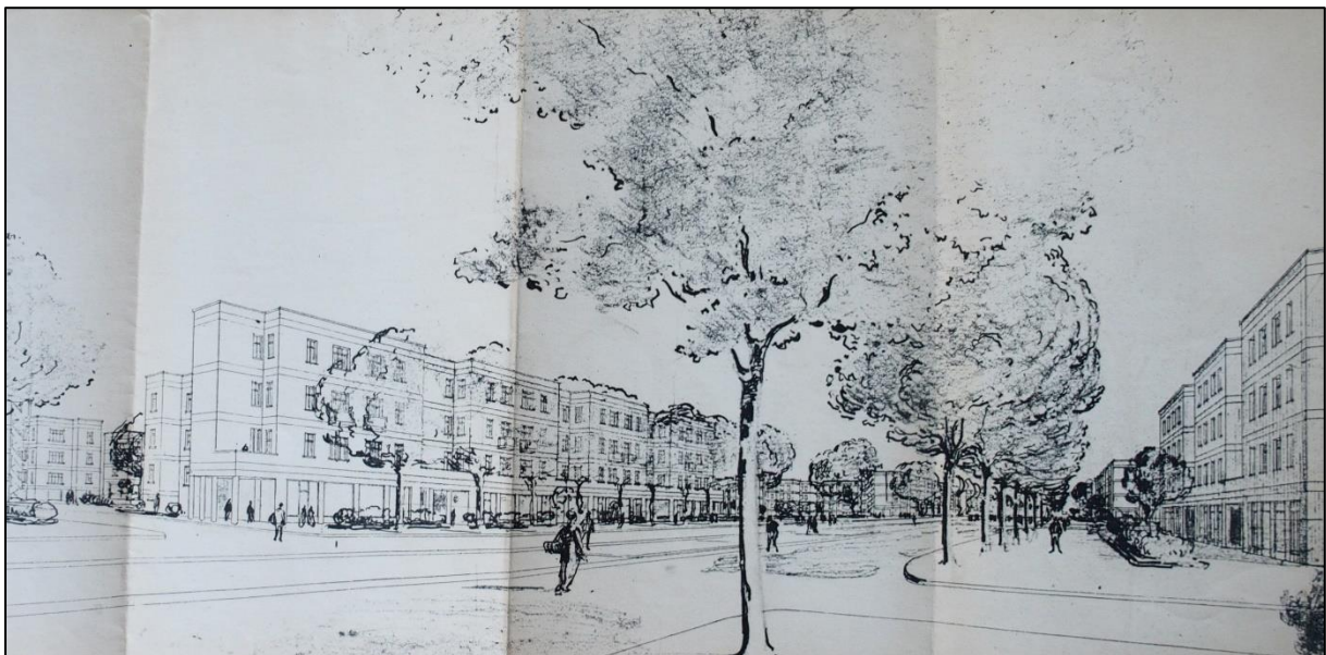
Figure 2 : Esquisse de Tony Garnier pour le boulevard des États-Unis, 1919 (AML 923 WP 70)

Le projet est donc très ambitieux, promettant de réaliser la vision de Tony Garnier d'une cité industrielle susceptible de concilier le développement industriel et l'amélioration des conditions de vie des ouvriers. On en voit une illustration avec une esquisse dessinée en 1919, montrant un boulevard très large dans lequel chaque usager semble avoir sa place (Fig. 2). Il paraît surtout très ouvert et peu dense, avec des immeubles de 3 étages maximum et une végétation très présente. Le projet porte alors sur 1 410 logements censés abriter 11 716 habitants, ainsi que des magasins et divers équipements publics 10 .