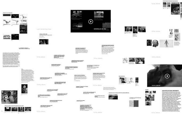
1. Détail de la carte du film World Brain [ http://worldbrain.arte.tv ].

qui serviront à d'autres pièces pourrait faire penser à une activité de détective privé, d'entomologiste amateur, de chercheur de minerais, de pêcheur à la mouche. Cette chasse aux papillons rares se révèle fastidieuse, car les contenus publiés se dupliquent facilement. La trouvaille longuement recherchée se retrouvera ailleurs dupliquée, reprise comme des coquillages emportés par la marée, qu'on nomme aussi mèmes 6 . Le jeu de réception et de renvoi sur Internet est si rapide que les meilleurs coquillages se répliquent à l'identique à travers la planète. Ajoutons à cela l'envoûtement de celui qui cherche une perle rare et qui oublie le temps qui passe, sans oublier le conditionnement des recherches par des algorithmes ciblant ce que vous avez déjà cherché (par le biais de cookies) par des navigations personnalisées et géolocalisées, qui vous enferment dans une recherche prédéterminée – votre moteur de recherche renvoie des liens en fonction des requêtes du passé – et, finalement, vous empêchent de trouver ce que vous cherchez. À moins de choisir des outils adaptés : logiciel libre, désactivation des cookies, changement d'ordinateur, de lieu, persistance des recherches en jonglant et changeant les termes etc.