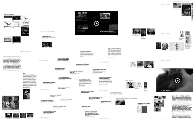
1. Détail de la carte du film World Brain [ http://worldbrain.arte.tv ].

qui serviront à d'autres pièces pourrait faire penser à une activité de détective privé, d'entomologiste amateur, de chercheur de minerais, de pêcheur à la mouche. Cette chasse aux papillons rares se révèle fastidieuse, car les contenus publiés se dupliquent facilement. La trouvaille longuement recherchée se retrouvera ailleurs dupliquée, reprise comme des coquillages emportés par la marée, qu'on nomme aussi mèmes 6 . Le jeu de réception et de renvoi sur Internet est si rapide que les meilleurs coquillages se répliquent à l'identique à travers la planète. Ajoutons à cela l'envoûtement de celui qui cherche une perle rare et qui oublie le temps qui passe, sans oublier le conditionnement des recherches par des algorithmes ciblant ce que vous avez déjà cherché (par le biais de cookies) par des navigations personnalisées et géolocalisées, qui vous enferment dans une recherche prédéterminée – votre moteur de recherche renvoie des liens en fonction des requêtes du passé – et, finalement, vous empêchent de trouver ce que vous cherchez. À moins de choisir des outils adaptés : logiciel libre, désactivation des cookies, changement d'ordinateur, de lieu, persistance des recherches en jonglant et changeant les termes etc.