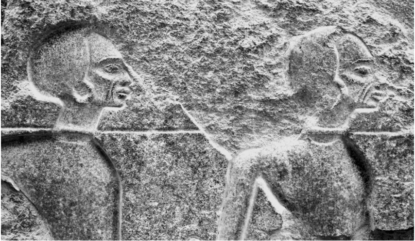
Fig. 3 : Têtes de Nubiens soumis, Louqsor, Statue colossale de Ramsès II