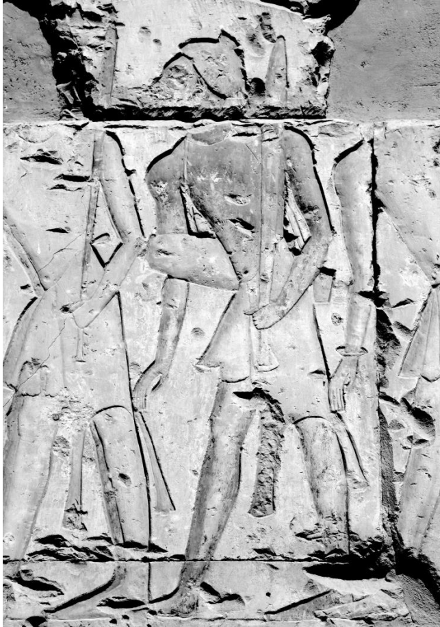
Fig. 1 : Représentation d'un Nubien intégré à l'armée égyptienne avec son arme caractéristique, Abydos, Temple de Ramsès II

des Nubiens, tous reconnaissables à l'aide des caractéristiques propres à chaque ethnie. Les Nubiens y portent arcs et longs bâtons en bois, leurs armes caractéristiques au Nouvel Empire, ainsi que les vêtements et accessoires habituels (boucles d'oreilles, plume dans les cheveux, pagnes courts en lin ou en peau animale).