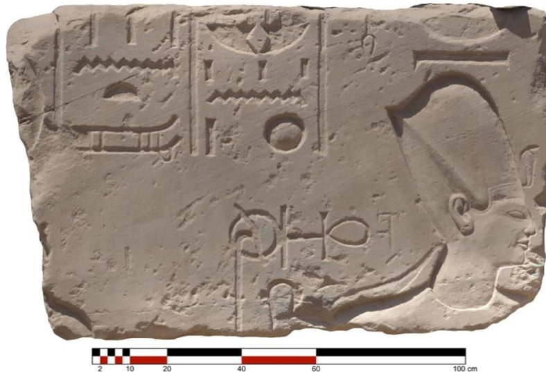
Fig. 2. Orthophotographie du bloc épars n° 260.

§3. C’est le cas du bloc n° 307 entreposé sur les mastabas sud, qui mentionne l’Horus Khentykhety, maître d’Athribis (Fig. 1) 4 . Le bloc est préservé presque dans sa totalité et des restes de peinture jaune sont visibles sur l’ensemble des inscriptions. Il a une longueur d’environ 146 cm, une hauteur de 90 cm et une profondeur de 88 cm. Ces dimensions s’accordent avec celles relevées pour d’autres blocs épars qui devaient être disposés dans le parement de façade en panneresse : leurs dimensions peuvent aller jusqu’à environ 190 cm en largeur, 100 cm en hauteur et en profondeur. La face inscrite situe le bloc entre deux scènes d’offrandes superposées : de celle du haut, il ne reste que la partie inférieure avec les pieds de deux personnages ; de la scène du bas, il reste une grande partie de la légende du dieu. Cette dernière est disposée sur quatre colonnes de texte de 31 cm de largeur (35 cm les bords compris). L’inscription s’accorde avec une deuxième appartenant au bloc n° 260 (Fig. 2), de dimensions similaires, et situé actuellement sur le même mastaba (Fig. 3). Le bloc conserve la tête du roi, coiffé du khéprsh , tourné vers la droite. Derrière le roi se tient une divinité munie d’un disque sur la tête. Son visage n’est pas conservé. La lecture complète de la légende du dieu sur ces deux blocs peut être proposée :