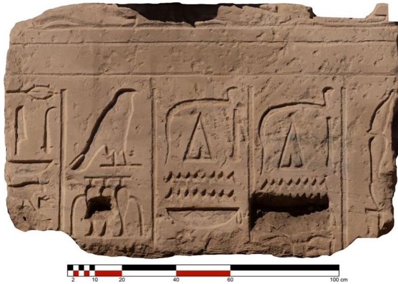
Fig. 1. Orthophotographie du bloc épars n° 307.