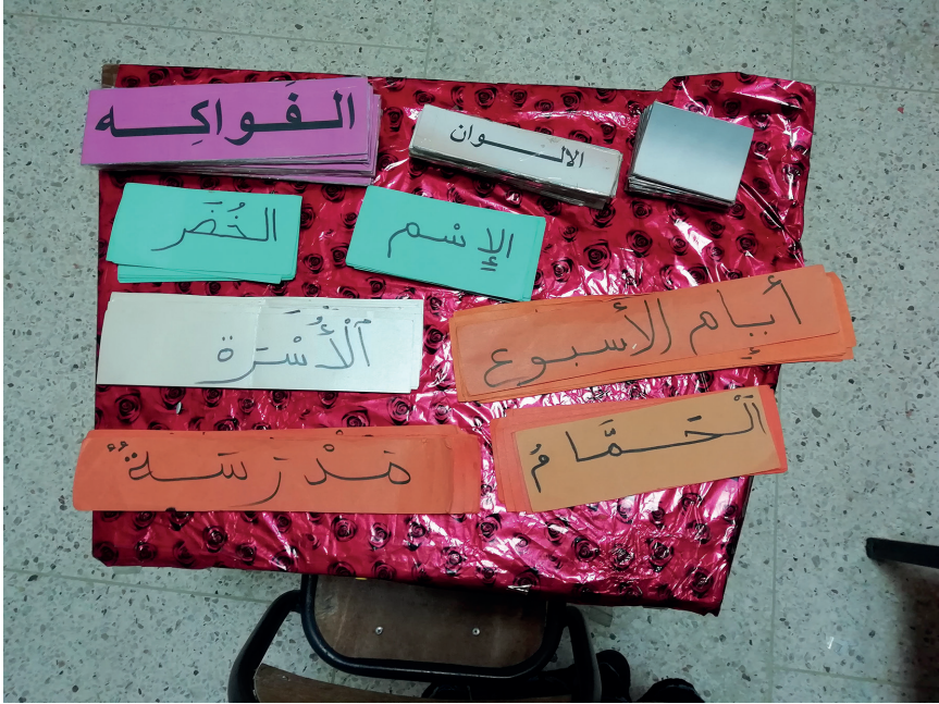
Figure 3. Fiche vocabulaire de la petite section

L'exercice consiste à traduire l'ASM écrit en LSM. L'enseignante sourde se déplace auprès de chaque élève pour demander la traduction du vocabulaire de l'écrit vers la LSM, puis sa collègue entendante se place devant le tableau pour lire le vocabulaire que les élèves répètent plus ou moins en fonction de leur degré de surdité (pour les surdités sévères et profondes, la réception et la production restent laborieuses). On note ici un usage de l'espace beaucoup plus marqué chez l'enseignante sourde, qui va se mettre en scène et incarner des rôles pour faciliter la compréhension. Une fois cet exercice terminé, les élèves sont invités, à tour de rôle, au tableau interactif pour mettre dans l'ordre les jours de la semaine et pour relier une liste de vocabulaire en ASM aux images correspondantes. La deuxième partie du cours débute avec une traduction de l'alphabet de l'ASM vers la LSM (dactylogie) 22 et se termine par un exercice de repérage des lettres sur la base du vocabulaire révisé en première partie. Malgré une présence importante d'affichages écrits (et imagés) dans les classes et une révision quasi quotidienne d'une centaine de mots, les élèves peinent à retenir le vocabulaire en ASM. Ils retiennent environ 40 % du vocabulaire en ASM écrit contre 80 % en LSM 23 . La modalité gestuelle semble être mieux