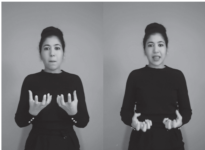
Figure 1B. Bilinguisme bimodal et contact des langues, exemple 2. La locutrice prononce les 2 syllabes du mot « Bghit (je veux) » en arabe dialectal marocain (ADM). Simultanément à cette prononciation, elle signe en langue des signes française (LSF) le mot « Vouloir ». © Belkadi, 2023

Les observations de Manel Khayech auprès de sourds tunisiens (2014) et cette étude mettent en exergue des compétences langagières inhérentes à la surdit , dont les combinaisons fluctuent chez les locuteurs sourds en fonction des situations de communication, du niveau d' ducation et des repr sentations sociales. Ces derni res sont « une forme de connaissance, socialement  labor e et partag e ayant une vis e pratique et concourante   la construction d'une r alit  commune   un ensemble social » (Jodelet, 1989 : 36). Ici, « les h t ro-repr sentations 13 et les auto-repr sentations 14 » (Bedoin, 2018) influent sur les repr sentations des langues chez les enseignantes (sourdes et entendantes) et les  l ves sourds du centre. La surdit  est-elle une d ficiance, une diff rence ou un fait biologique (Benvenuto, 2011 ; Mottez, 2006) ? Selon la d finition retenue, la place de la langue des signes sera plus ou moins pr sente (ou accept e) en tant que langue d'enseignement de l'ASM. D s lors que la surdit  est per ue comme une d ficiance, une lacune   pallier, c'est l'arabe sign  (traduction mot   mot de l'ASM) qui est utilis , ou de simples mimes. Ainsi, l'unique finalit  devient l'acquisition d'une langue vocale,