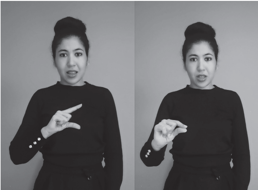
Figure 1A. Bilinguisme bimodal et contact des langues, exemple 1. La locutrice prononce les 2 syllabes du mot « Namshi (je pars) » en arabe dialectal marocain (ADM). Simultanément à cette prononciation, elle signe en langue des signes française (LSF) le mot « Partir ».

Chez les sourds marocains, le bilinguisme LSM/ADM est à l'image des contacts de langue des entendants marocains. Il se traduit par les combinaisons suivantes : LSM et LSF (modalité signée) / ADM et français (modalité orale), sans associer la langue des signes à la langue vocale majoritaire à laquelle elle renvoie (LSF/français ou LSM/ADM), chaque langue étant distincte, comme le montre les exemples suivants (fig. 1).