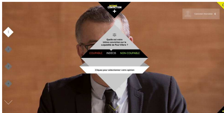
Figure 7 - L'élaboration de l'intime conviction