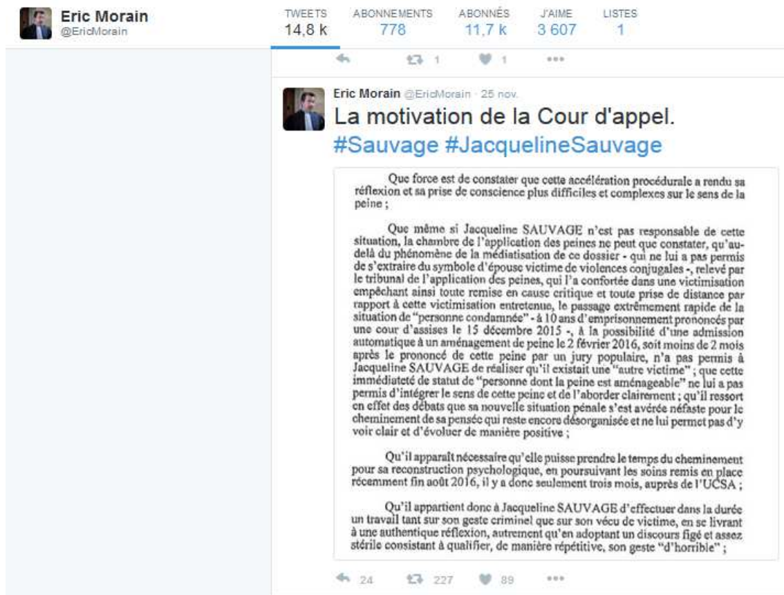
Figure 3 - La reproduction de la motivation de la Cour d’assises d’appel en tweet