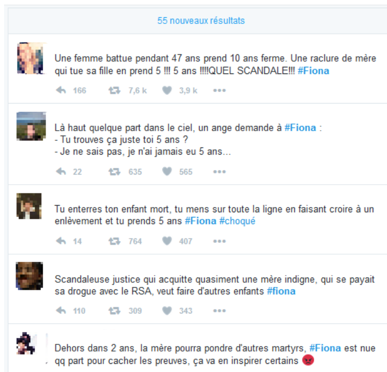
Figure 4 - #Fiona, le 25 novembre 2016, après le prononcé du verdict acquittant Cecile Bourgeon des coups mortels portés à sa fille Fiona