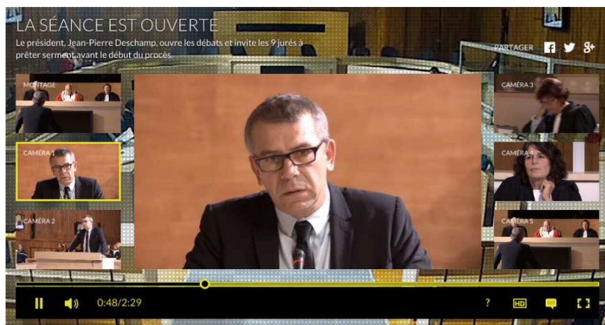
Figure 6 - Websérie Intime conviction