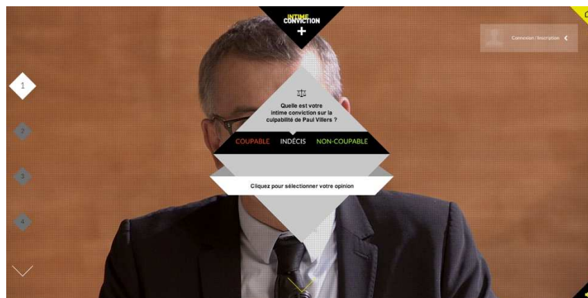
Figure 7 - L'élaboration de l'intime conviction