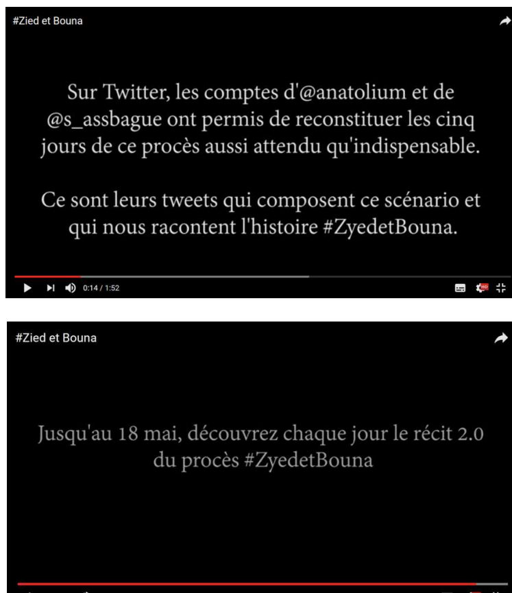
Figure 5 - Captures d'écran du film #zyedetbouna, le procès 2.0

Source : Youtube, #ZyedetBouna Jour 1 (4098 vues) et #ZyedetBouna teaser (1833 vues), mis en ligne en 2015 par Visio Nostra (membre depuis le 11/10/2014, 1913 abonnés, 327 698 vues)