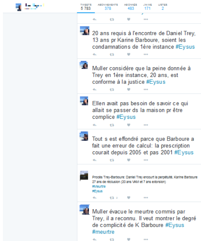
Figure 1 - Capture d'écran du compte d'un live-tweeter de procès