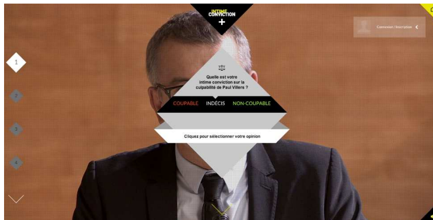
Figure 7 - L'élaboration de l'intime conviction