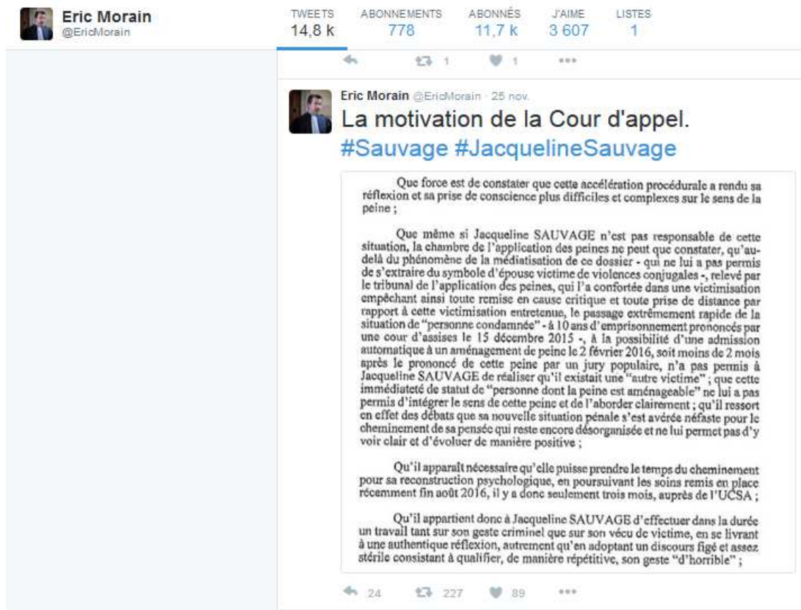
Figure 3 - La reproduction de la motivation de la Cour d’assises d’appel en tweet