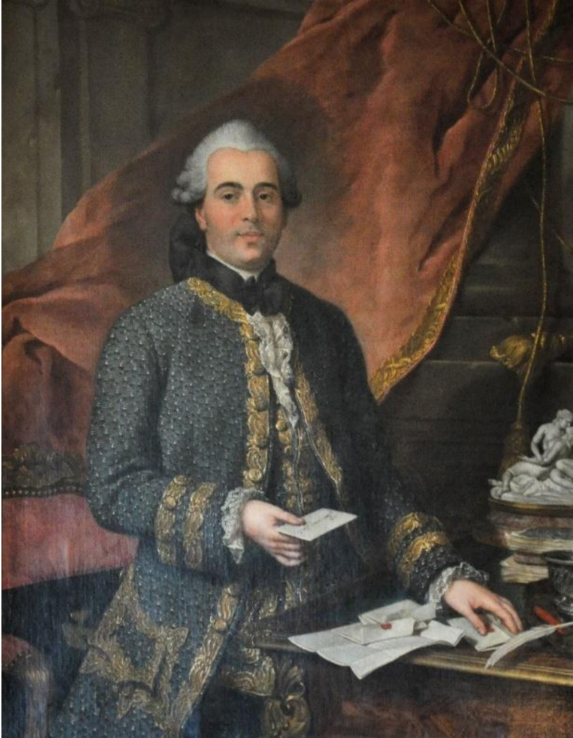
Figure 2 : Portrait de Jacques de Flesselles, par Donat Nonnotte, musée Carnavalet, Paris.

En novembre 1767, l'intendant de la généralité fraîchement nommé est Jacques de Flesselles (1730-1789), auparavant intendant de Moulins (1762) puis de Rennes (1765). Il reste en charge à Lyon jusqu'en 1784. Il favorise la liberté du commerce, l'installation de manufactures, l'amélioration de l'agriculture et contribue au développement de l'école vétérinaire de Lyon. Il encourage les travaux de l'Académie de Lyon et y fonde plusieurs prix, dont un pour le perfectionnement de la