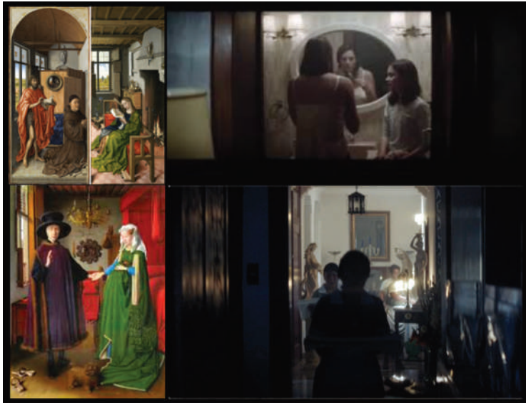
Imagen 4. Montaje comparativo entre la pintura flamenca (a la izquierda, arriba el Retablo de Werl y abajo El matrimonio Arnolfini ) y dos fotogramas de La Llorona en el que aparece la presencia del espejo.