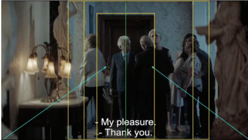
Imagen 3. Fotograma de La Llorona . Simetría dinámica y sobreencuadre.

el plano, para proporcionarnos una sensación de progreso para unos y de hundimiento para otros.