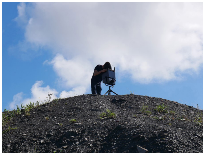
©Faubourg 132, « Mirages, regards vers le futur », 2020 à aujourd'hui.

et Raby 27 . C'est ce qu'expérimente par exemple Faubourg 132 dans une recherche sur les manières de « questionner et réinventer » les paysages des territoires des Hauts de France avec leurs habitants. Ces derniers sont invités à regarder leur territoire autrement, au travers d'une « machine à voir le futur 28 » que le collectif d'artistes-designers installe dans l'espace public. Par l'intermédiaire du dessin, les riverains racontent et partagent leurs « mirages », c'est à dire leurs visions et désirs d'avenir portant sur l'évolution de leur terrain de vie. Ce dispositif est à la fois un outil de diagnostic de la réalité, un activateur d'expression citoyenne, et un outil de prospective stimulant l'exercice créatif pour de futurs projets collectifs.