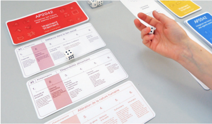
© Vraiment-Vraiment, « AP2042 », jeu de prospective sur l'action publique, 2019.

continuer » 22 . Les scénarios fictifs, écrits et dessinés à mesure qu'ils sont narrés collectivement, forment une base pour la réflexion prospective de l'agence de design qui travaille sur ces questions à travers ses projets.