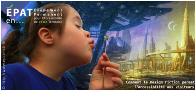
©Polymorphe Design, « EPATen... Événement Permanent pour l'Accessibilité du Territoire », 2021.

choix parmi plusieurs proposés (dont un stage de langue dauphin dans une cité sous-marine, la découverte d'un État africain 100% durable, ou encore une escalade sportive en forêt verticale de 3000 étages), pour des clients aux profils psychique et/ou physique divers (trouble obsessionnel de l'ordre, tétraplégie ou électro-sensibilité par exemple) décrits sur la base de données scientifiques réelles. Les scénarios des différentes équipes, construits en un temps compté, sont débattus en fin de séance avec les designers ainsi qu'avec des professionnels de la santé.