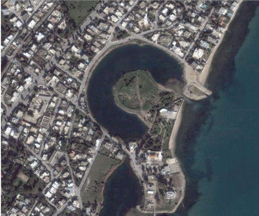
Document n° 1 : Les lieux de l'ancien port de Carthage

Caronni croit avoir localisé avec précision le port antique de Carthage. Selon une reconstruction moderne ces mêmes lieux devaient être semblables à ceux du document n° 2 et 3.