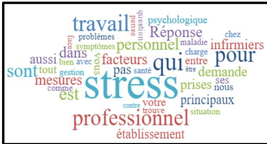
Figure 2 : Nuage des mots " Thème 2 "

D'après le nuage des mots relatif au thème 2, il apparaît que les mots « stress, professionnel, travail, psychologique, personnel, infirmiers, hiérarchique, relation... » sont les mots les plus fréquents dans les données collectées. Et les mots « carrière, départ, absentéisme, culture, conditions, motivations... » apparaissent d'une manière moins importante.