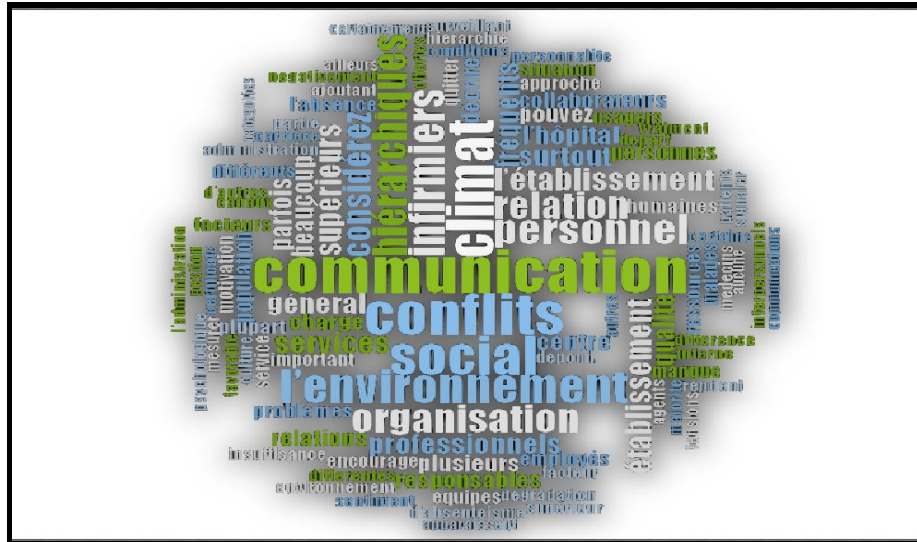
Figure 1 : Nuage des mots " Thème 1 "

Le nuage de mots est un outil qui montre la présence et l'apparence des mots les plus utilisés dans les documents collectés dans une recherche. En effet, le logiciel Nvivo, permet cette option pour avoir des résultats préliminaires et de manière rapide, ce qui donne une vision générale sur les éléments abordés dans l'analyse des résultats. La figure ci-dessous donne le nuage de mots selon le premier thème de notre étude : l'environnement organisationnel et le stress.