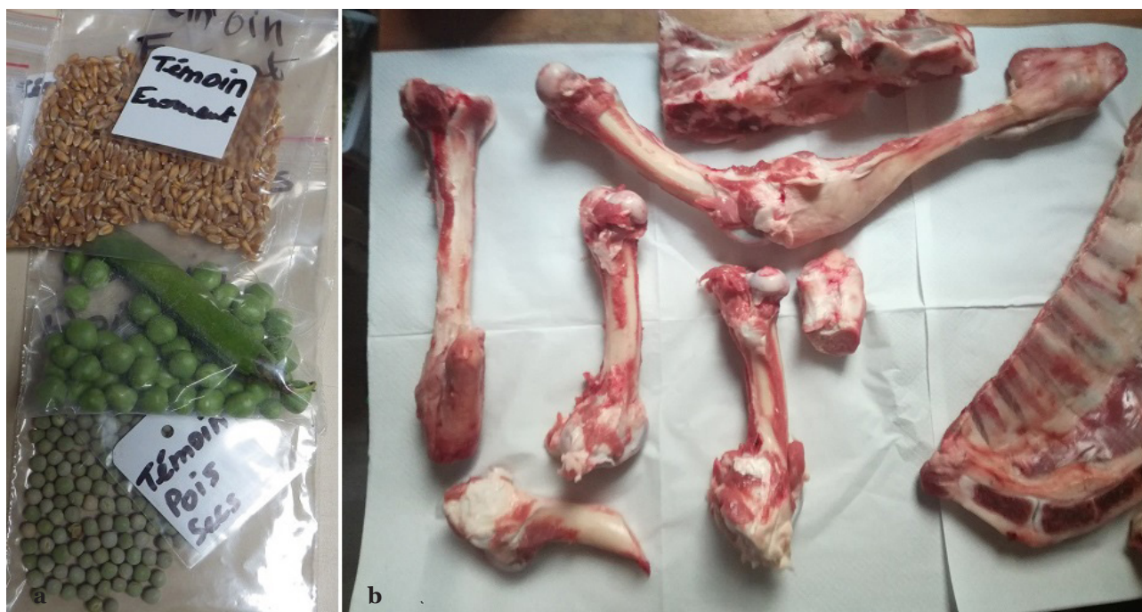
Fig. 4 : Exemples des végétaux et ossements animaux utilisés. a. Les échantillons témoins de froment, pois frais et pois secs. b. Les ossements témoins de mouton. On peut voir sur ces derniers l'état décharné dans lequel l'ensemble des ossements ont été utilisés.

Les cuissons rôties en milieu clos sont réalisées dans le four expérimental du haut Moyen Âge réalisé en 2002 par Gaele Bruley-Chabot, François Gentili et les équipes du site du château d'Orville (Bruley-Chabot et Warmé 2009). Un feu vif y est allumé préalablement aux cuissons, qui sont entamées lorsque le four est chaud et les flammes restreintes. Le feu est entretenu en continu. Les aliments sont déposés dans un coquemar contenant un fond d'eau, avant d'être enfourné à proximité des parois, de part et d'autre de la bouche, sur la sole, alors que le feu est poussé plus en arrière.