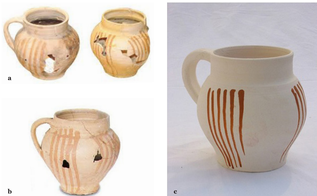
Fig. 1 : Coquemars des XIII e -XIV e siècles et exemple d'un fac-similé utilisé pour l'opération expérimentale. a. Coquemar du XIII e ou XIV e siècle retrouvés à Longjumeau (Essonne). b. Coquemar du XIII e ou XIV e siècle retrouvés à Chevilly-Larue (Val-de-Marne). c. Coquemar réalisé par Véronique Duray d'après les modèles du XIII e -XIV e siècle.

les sites médiévaux et donc propice à réaliser des comparaisons. Cependant, il a été nécessaire de sélectionner deux de ces trois groupes pour restreindre le nombre d'opérations, qui était déjà élevé. Le porc, moins représenté au second Moyen Âge dans la plupart des contextes archéologiques, bien qu'il puisse être majoritaire dans certains contextes élitaires, a donc été exclu. Par ailleurs, sa structure osseuse particulière, plus poreuse que celle du bœuf ou du mouton, aurait réduit le nombre de comparaisons possibles avec d'autres espèces, notamment sauvages. Le budget de l'opération ne permettait pas de se procurer des pièces de viandes avec os et chair sans risquer une réduction drastique du nombre d'échantillon. Il a donc été décidé de prendre en boucherie des déchets de désossage, ce qui a été décisif dans les parties anatomiques sélectionnées. Cette option n'en demeurerait pas moins efficace pour les objectifs que nous poursuivons : le matériel faunique étant