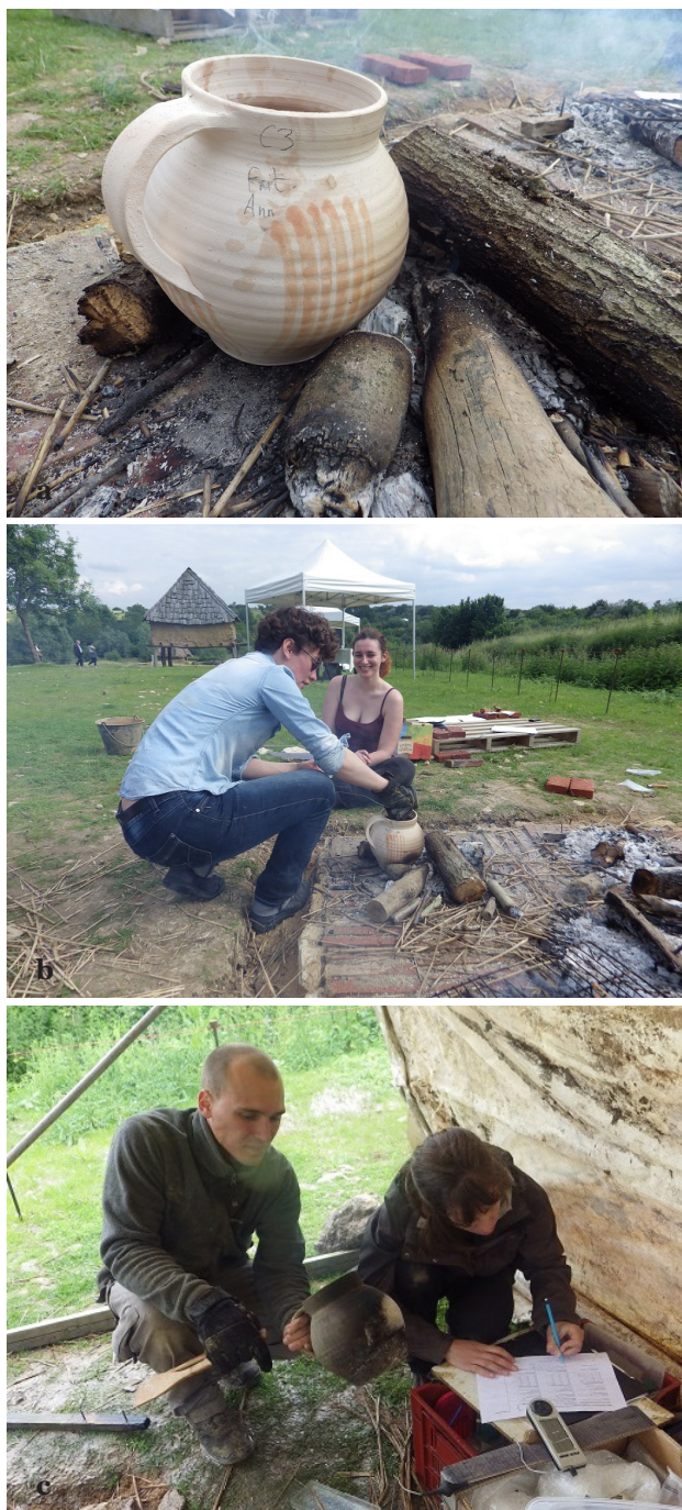
Fig. 8 : Mise en œuvre des opérations expérimentales sur le site d'Orville, avec comme exemple les principales étapes du suivi d'une céramique. a. Identifiants inscrits au crayon sur le col et l'épaule, et positionnement par rapport au feu. b. Prise de température durant les opérations. c. Observations enregistrées après chaque opération.

sur les interprétations. En parallèle, des analyses chimiques (IRTF et chromatographie) ont été demandées au laboratoire CIRAM afin de vérifier la fiabilité de nos grilles d'analyses. Les résultats ont été concluants, mettant en évidence à la fois