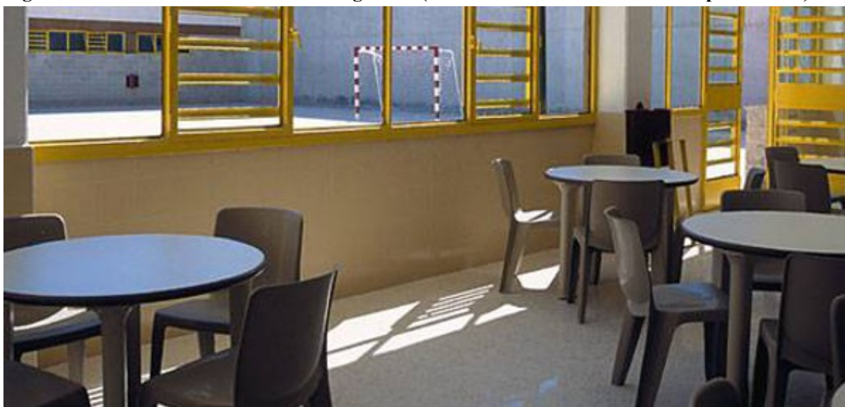
Figure 4. Intérieur d'un module d'hébergement (salle de vie commune et cour de promenade)