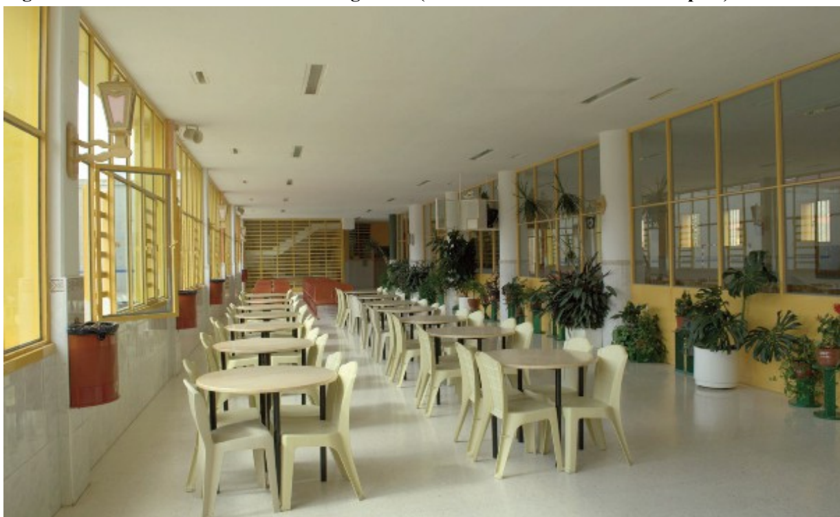
Figure 5. Intérieur d'un module d'hébergement (salle de vie d'un module de respect)