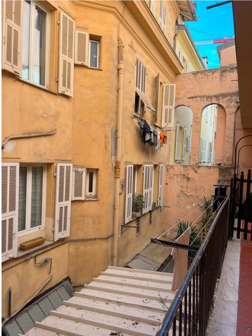
Fig.7 - Exemple de linge suspendu et d'utilisation des espaces publics