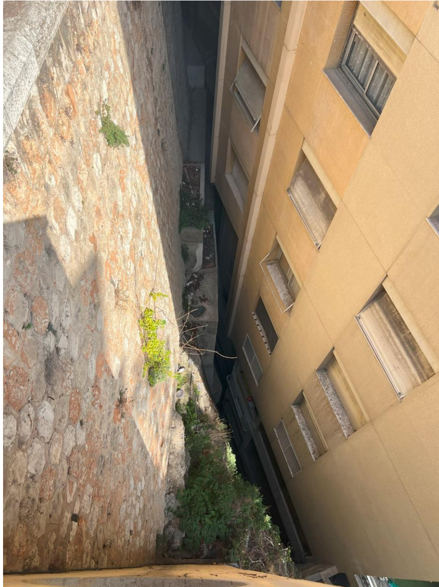
Fig.2 - L'aspect distinct d'un immeuble urbain.

On y voit cinq étages, chacun avec des fenêtres donnant sur un imposant mur de pierre. Ce mur massif obstrue complètement la vue depuis les fenêtres de l'immeuble.