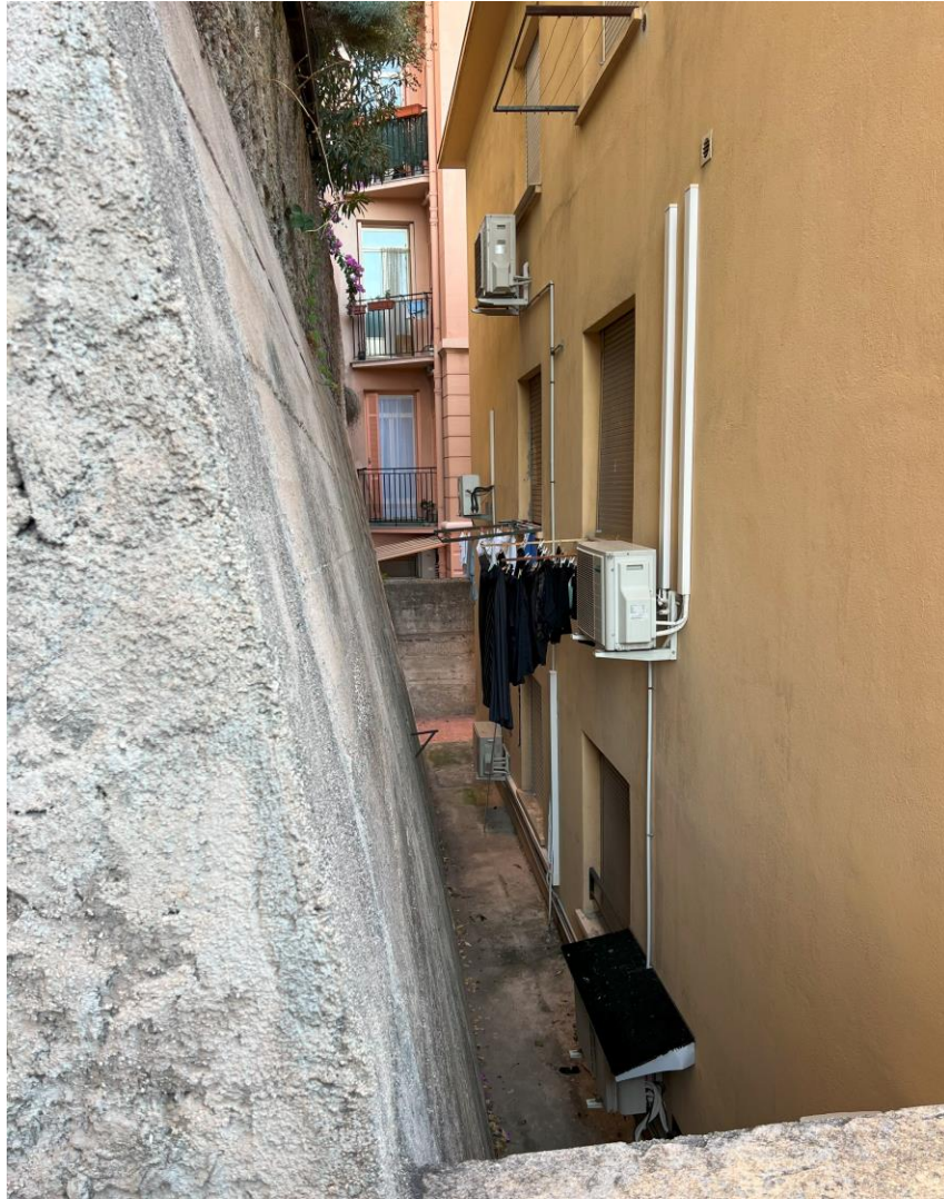
Fig.6 - Un espace servant pour le séchage du linge au quotidien