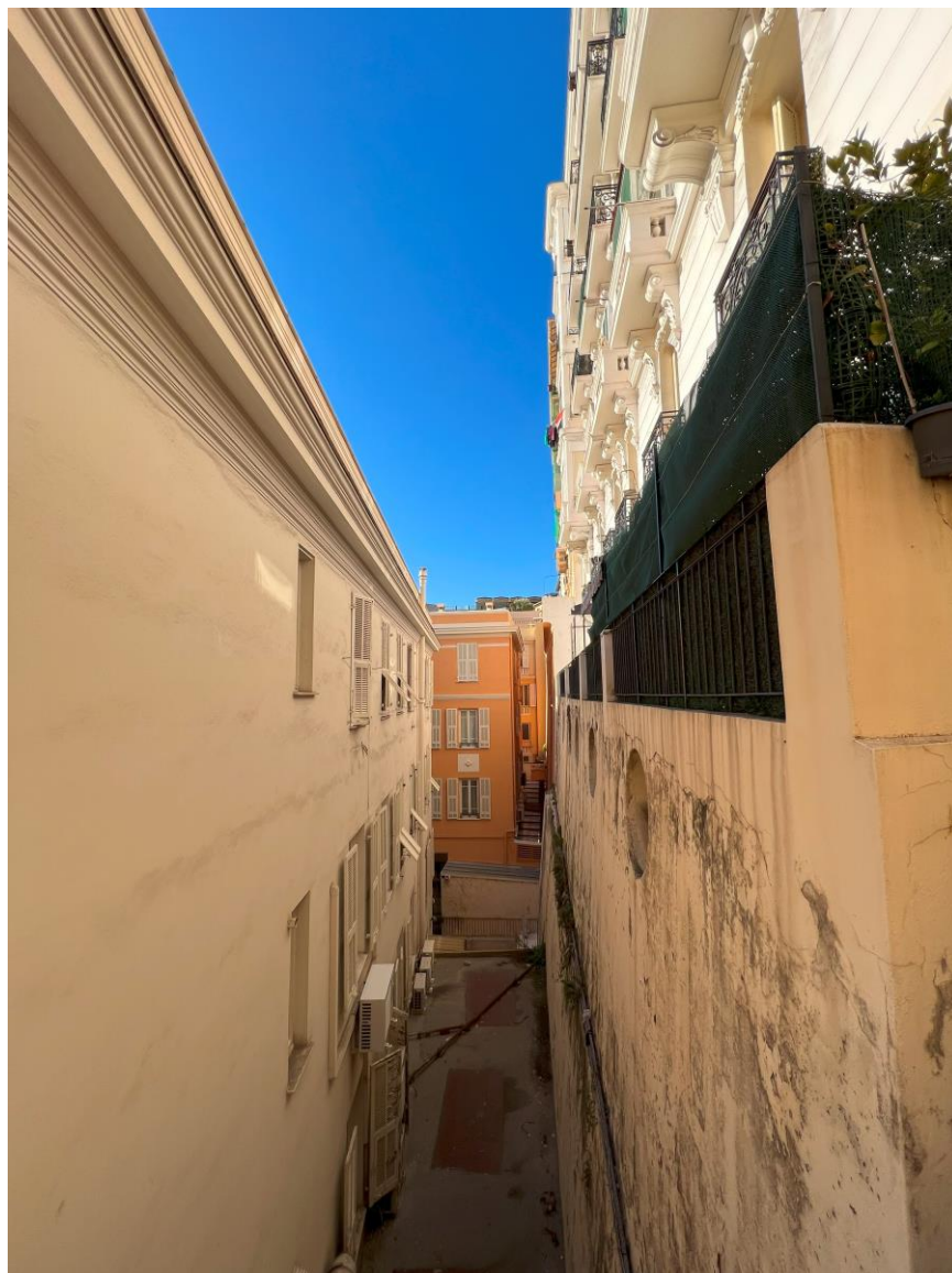
Fig.1 – Fenêtres sur mur aveugle

tous les logements, optent pour intégrer des fenêtres même dans les parties des bâtiments qui donnent sur l'arrière ou sur les murs de fondation des constructions adjacentes plus élevées (fig.1). Cela suggère une réaffectation d'espaces potentiellement techniques en logements, et cette approche, visant à maximiser l'utilisation de chaque parcelle disponible, conduit à la création d'espaces interstitiels étroits entre la fenêtre et le mur, parfois de moins d'un demi-mètre.