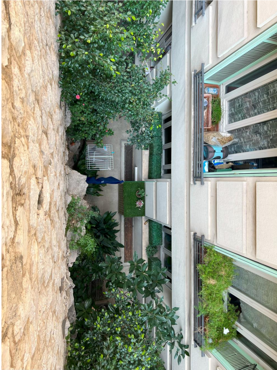
Fig.3 - Un espace interstitiel aménagé entre un mur en pierre et une fenêtre. Ce coin, bien végétalisé, respire la tranquillité et la créativité dans l'utilisation de l'espace urbain restreint. Les plantes apportent une touche de nature et de fraîcheur à un cadre autrement inanimé, transformant un espace confiné en un petit havre de paix et de beauté naturelle.

considérées comme « chanceuses ». Ailleurs, une fenêtre est éclairée par la lumière du soleil bien qu'elle soit située en face d'un mur (fig.4).