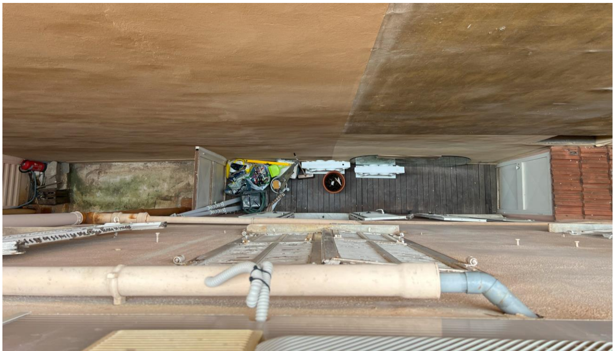
Fig.5 - Un espace interstitiel utilisé pour le stockage et l'embellissement Des articles de bricolage, un morceau de verre ovale, un pot de fleurs, et une cave couverte de schiste avec une porte blanche sont visibles.

Les espaces libres situés entre les bâtiments sont souvent des endroits non identifiés, ni privés ni publics, mais collectifs. L'étude montre qu'ils sont souvent utilisés comme espaces utilitaires, même s'ils ne sont pas désignés comme tels. D'après nos observations, le mur devant la fenêtre représente un endroit tacitement laissé pour un usage personnel dans la majorité des cas. Lors de notre visite d'un appartement dans le quartier de la Condamine, dont les fenêtres donnent sur un mur, le propriétaire nous a montré comment les voisins du premier étage avaient utilisé l'espace interstitiel en dessous pour créer une zone privée de stockage (fig.5) avec plusieurs paquets contenant divers objets facilement identifiables : du scotch, de la colle, une éponge, quelques rouleaux de tissu, une serpillière, une petite pelle avec un balai, plusieurs tringles et quelques outils. On peut supposer que cette zone sert de rangement pour des articles utilisés pour le bricolage ou de petites réparations. Nous voyons également un grand morceau de verre ovale, probablement pour une table, un pot de fleur avec de la terre, ainsi qu'une cave aménagée de manière indépendante et recouverte de schiste, avec une porte peinte en blanc. Ainsi, les résidents du premier étage ont réussi à gagner quelques mètres carrés d'espace précieux, tient-on à préciser, à Monaco. En observant d'autres endroits similaires, nous avons rencontré des espaces de stockage pour des baskets, des pots, des casseroles.