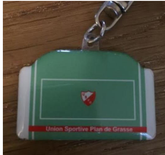
Fig.9- Porte-clefs fronton

bien plus qu'un aménagement pour une pratique sportive puisqu'il est utilisé par les habitants pour différentes raisons. Il est un espace central du village et est respecté dans le sens où il n'a été que très rarement dégradé par des tags : une seule fois au cours des huit dernières années. Le fronton a été intégralement repeint en 2015. Juste avant qu'il ne soit repeint, quelques tags y avaient été réalisés et les habitants s'en étaient largement indignés : « toucher au fronton, c'est toucher au cœur du village », dit un des habitants.