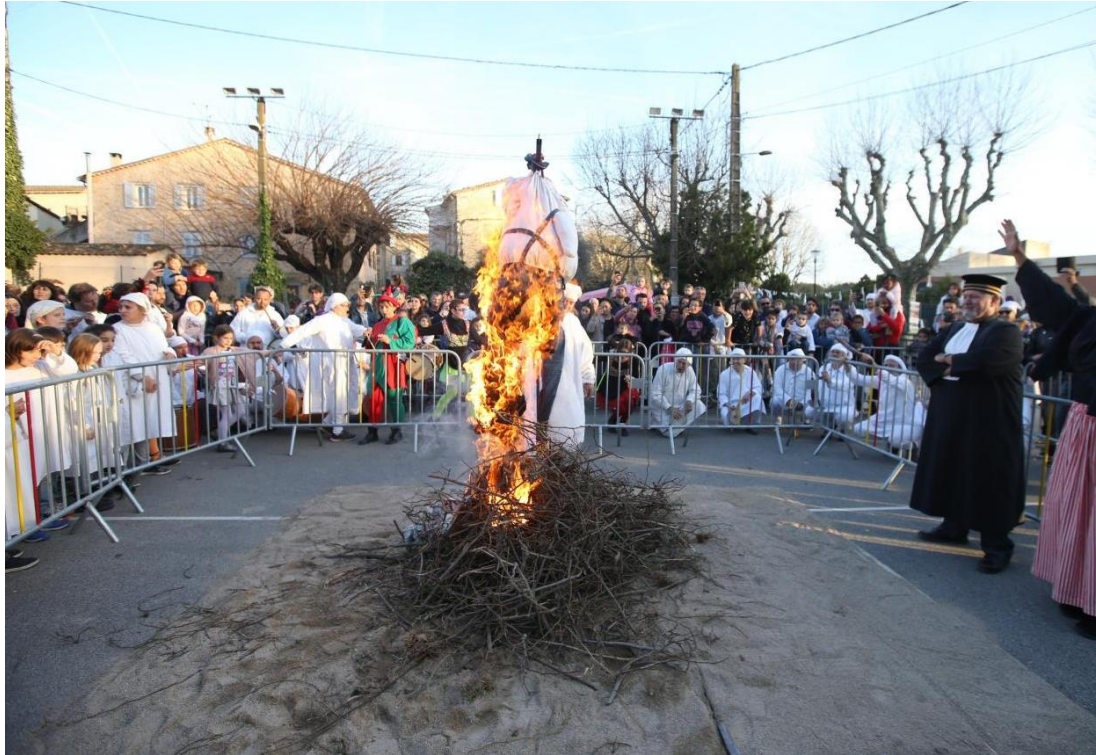
Fig.5 - Jugement de Caramentran, Carnaval des Boufetaires