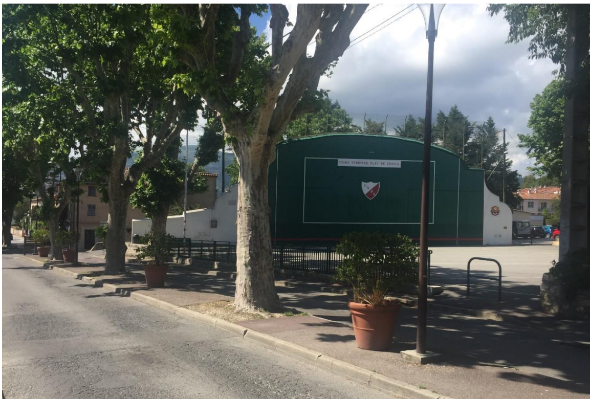
Fig.2 - Fronton avec logotype de l'USPG.

La pelote basque est un jeu de balle indirecte originaire du Pays Basque. Les joueurs s'échangent la balle par l'intermédiaire du fronton sur lequel elle rebondit. Le mur est un médiateur entre les pelotari . La balle doit être rattrapée à la volée ou au rebond : un seul rebond au sol autorisé sinon le point est perdu. La pelote basque peut se jouer à main nue avec une raquette en bois courte (la pala ), avec une raquette en bois longue (la xare ) ou comme un jeu de rebot (2012_67717_INV_PCI_FRANCE_00160). Chacune de ces variantes possède ses propres règles (2012_67717_INV_PCI_FRANCE_00159) mais l'objectif est d'envoyer la balle contre un mur de manière ce que l'adversaire ne puisse pas la renvoyer.