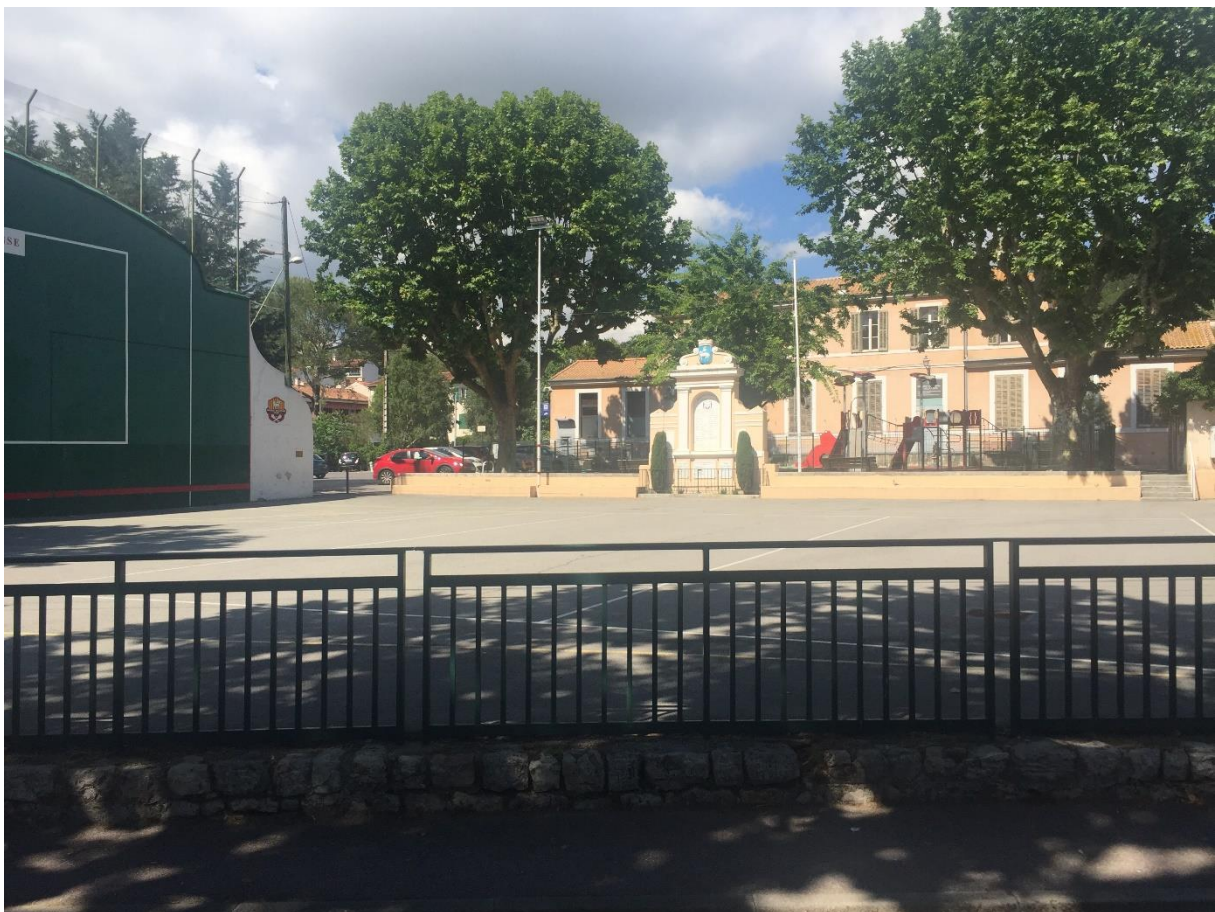
Fig. 1 - Le fronton, l'ancienne mairie école aujourd'hui Poste et bâtiments municipaux, le monument aux Morts.

En 1887, la mairie annexe et un groupe scolaire comprenant une aile pour les filles et une pour les garçons sont construits derrière le fronton. En 1921, un monument aux morts est érigé, pour compléter l'ensemble architectural. Le groupe scolaire devenu trop petit laisse sa place à la Poste et à des équipements municipaux. En 1970, la mairie annexe est déplacée de l'autre côté de la route, à côté de la nouvelle école. Son ancien parvis devient une aire de jeu pourvue, à la fin des années 1990, d'un revêtement caoutchouté et agrémenté de toboggans et balançoires (fig.1). Des commerces et des restaurants sont installés à proximité redessinant peu à peu le centre du village.