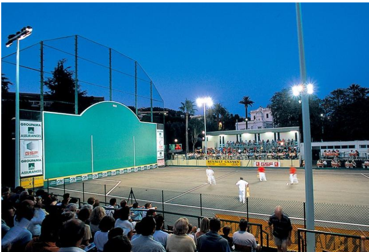
Fig.3 - Fronton Michel Ughetto à Cannes

Ce type d'installation sportive est très commun au Pays Basque (français et espagnol) mais peu courant ailleurs. Pour la plupart des pelotari interrogés, c'est probablement la pratique locale de la pelote provençale qui a favorisé l'émergence et l'implantation de la pelote basque. Cette dernière y aurait permis de sauvegarder le fronton. En effet, à la fin du XIX e siècle, plusieurs autres villages alentours possèdent des frontons dont la plupart ont disparu comme à la Colle-sur-Loup ou à Châteauneuf-de-Grasse (Nice-Matin du 10 décembre 2017). D'autres frontons, plus récents, sont dédiés uniquement à la pratique sportive avec barrières grillagées et parfois même gradins comme c'est le cas à Villeneuve-Loubet ou encore Cannes dont la construction remonte à 1959 (fig.3).