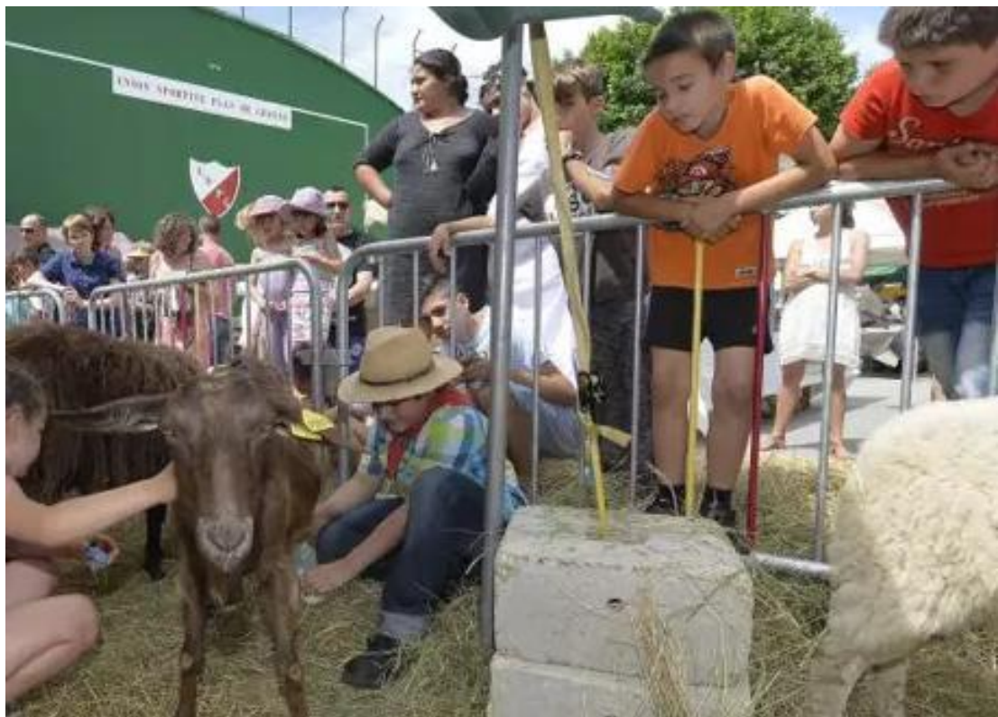
Fig.6 - Espace terroir, la traite d'une chèvre