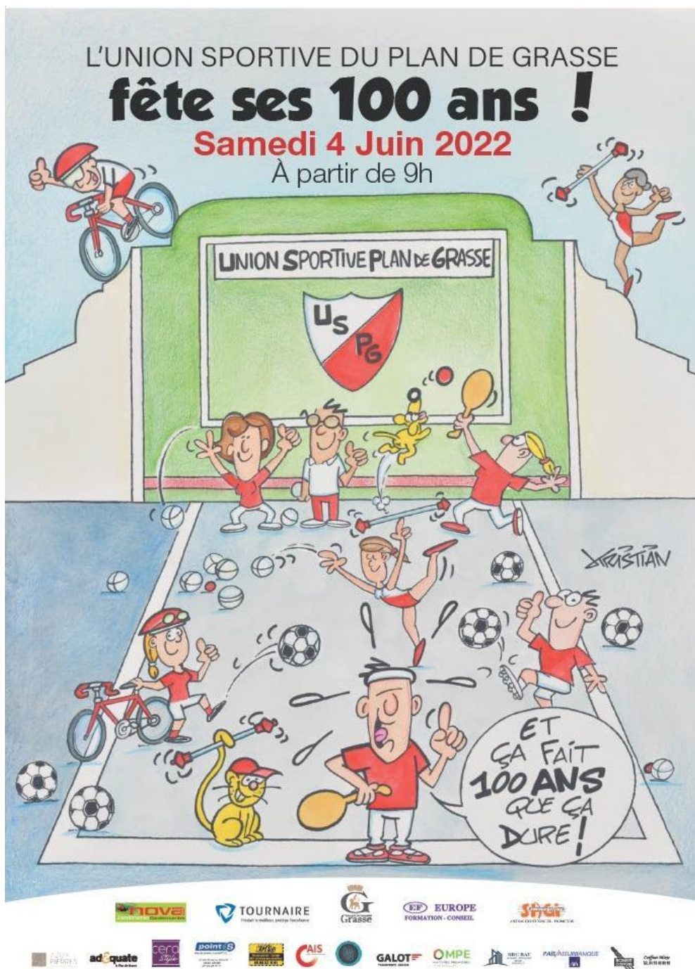
Fig.4 - Affiche de la célébration des 100 ans de l'USPG