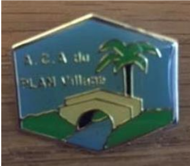
Fig 8 - Pin's du « vieux pont » © C. Rosati-Marzetti, 2023.