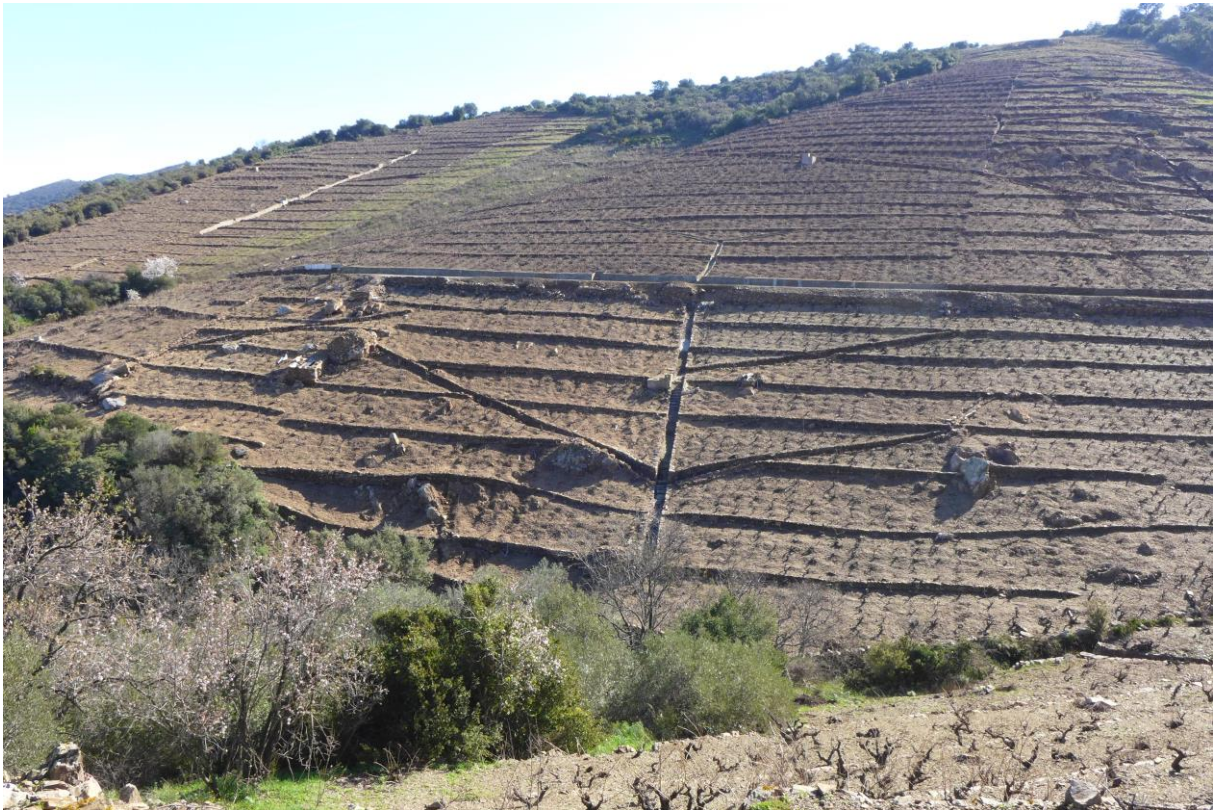
Fig.6 – Les murs du vignoble de Collioures (Pyrénées-Orientales)