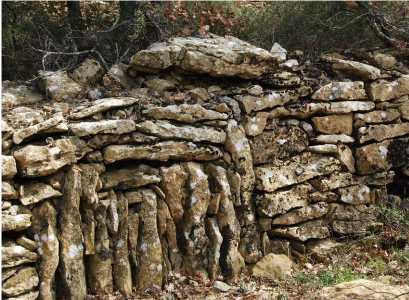
Fig.1a – Appareil composite (Var)