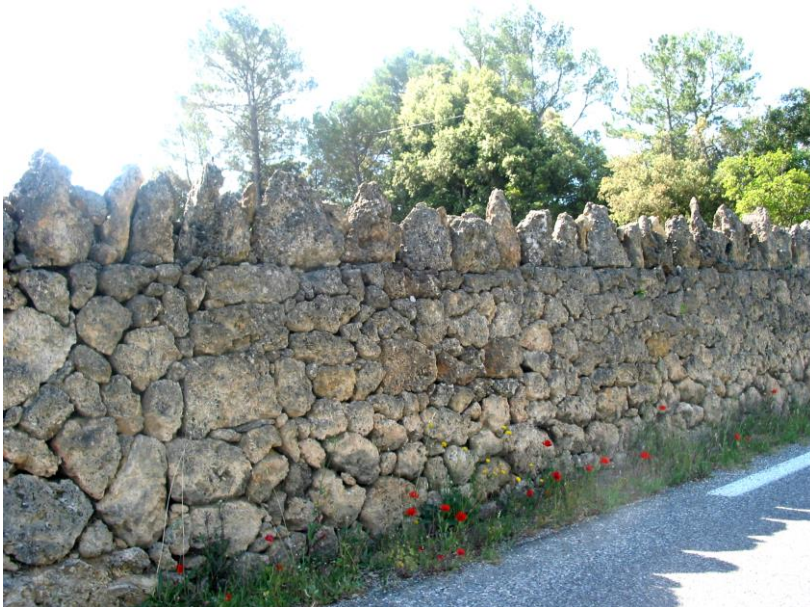
Fig.1b – Mur en tuf calcaire non assisé (Var)