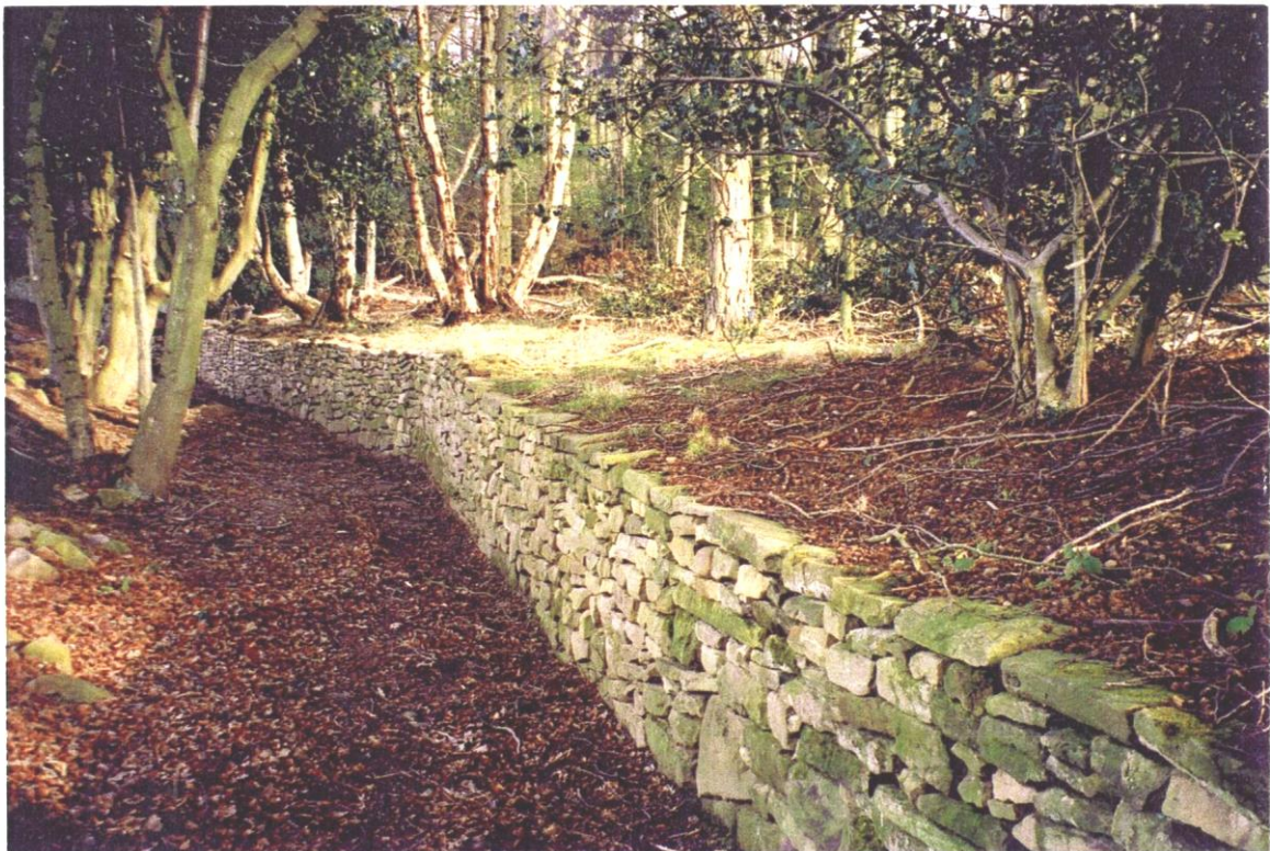
Fig.7 – Restauration du Ha-ha (Angleterre)