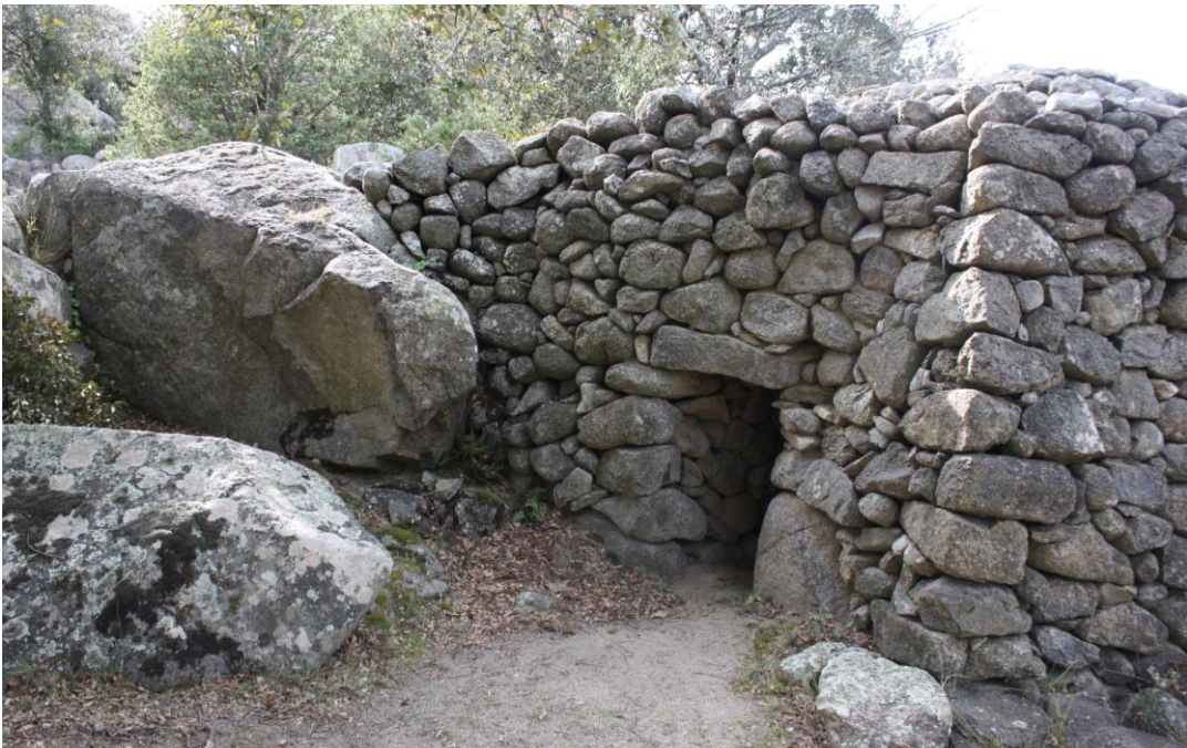
Fig.3 – Cabane et rocher dans les Pyrénées-Orientales