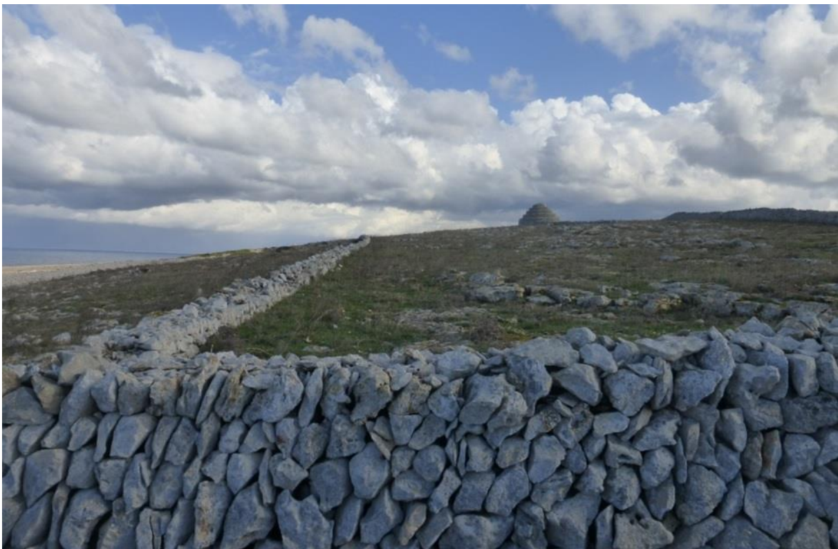
Fig.8 – Un mur qui se promène à Minorque

après le XVe siècle et donne les espaces de coltura promiscua , liés à une production de subsistance très proche de la complantation . Ce développement est favorisé aussi aux XVIe-XVIIIe siècles avec la fuite et concentration des populations vers le littoral suite aux conquêtes turques. Les espaces issus offrent une terre arable maigre et irrégulière et sont hérissés soit de chicots, soit de rochers « arrondis » signalant les « têtes des lapiés 3 ». La trame quadrangulaire revient dans l'après-guerre favorisant la maturation de vignobles (dont ceux de malvoisie), avec la création de microclimats chauds et peu ventés dans de petites parcelles encloses. Pierriers, enclos (fig.8), couloirs barrés mais aussi cabanes, fermettes et réserves d'eau sont l'héritage de ces épierrements et aménagements centenaires.