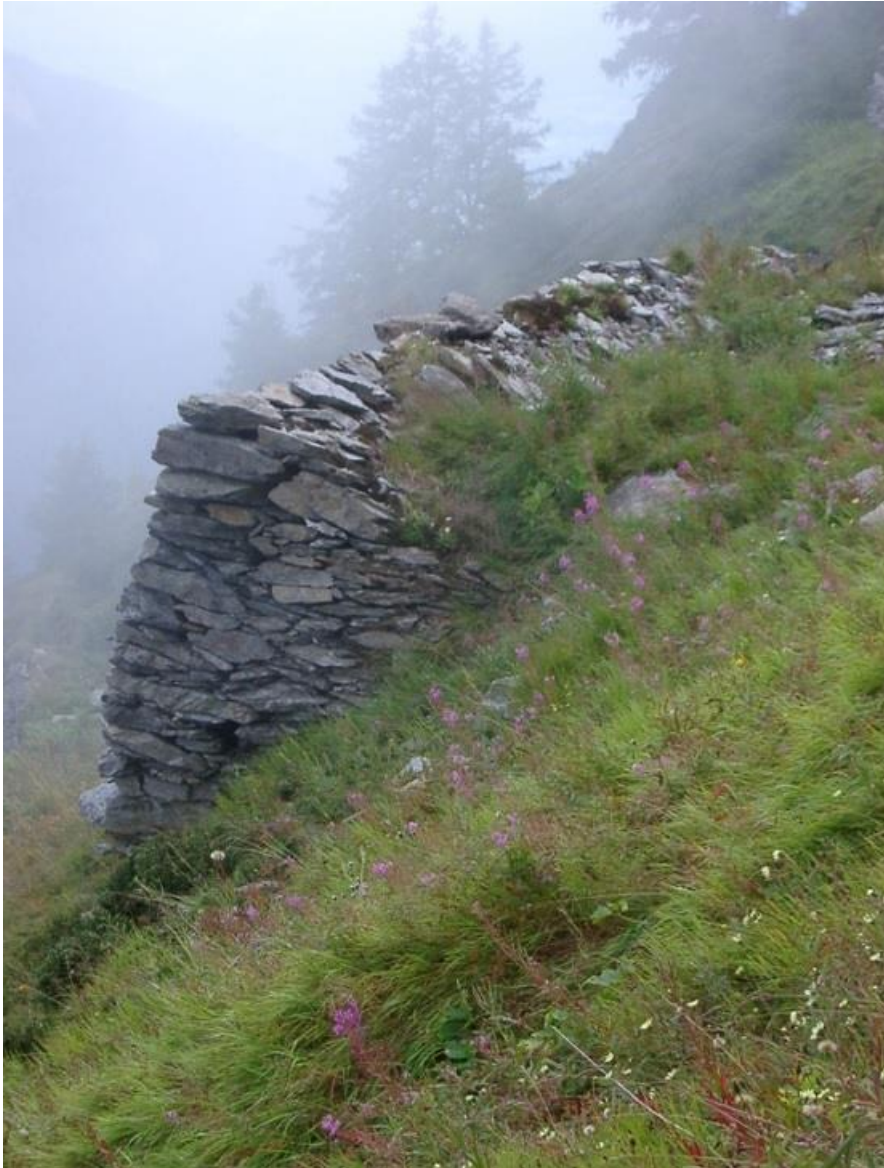
Fig.5 – Mur pare-avalanche (Suisse)