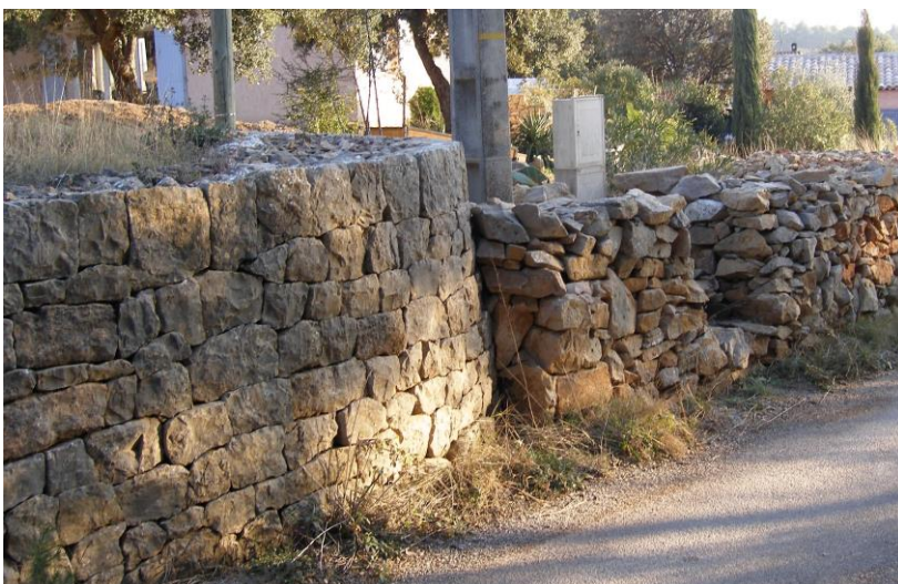
Fig.1c – Restauration actuelle en moellons équarris (Var)