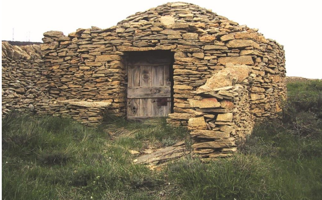
Fig.4 – Caseta du Pays valencien