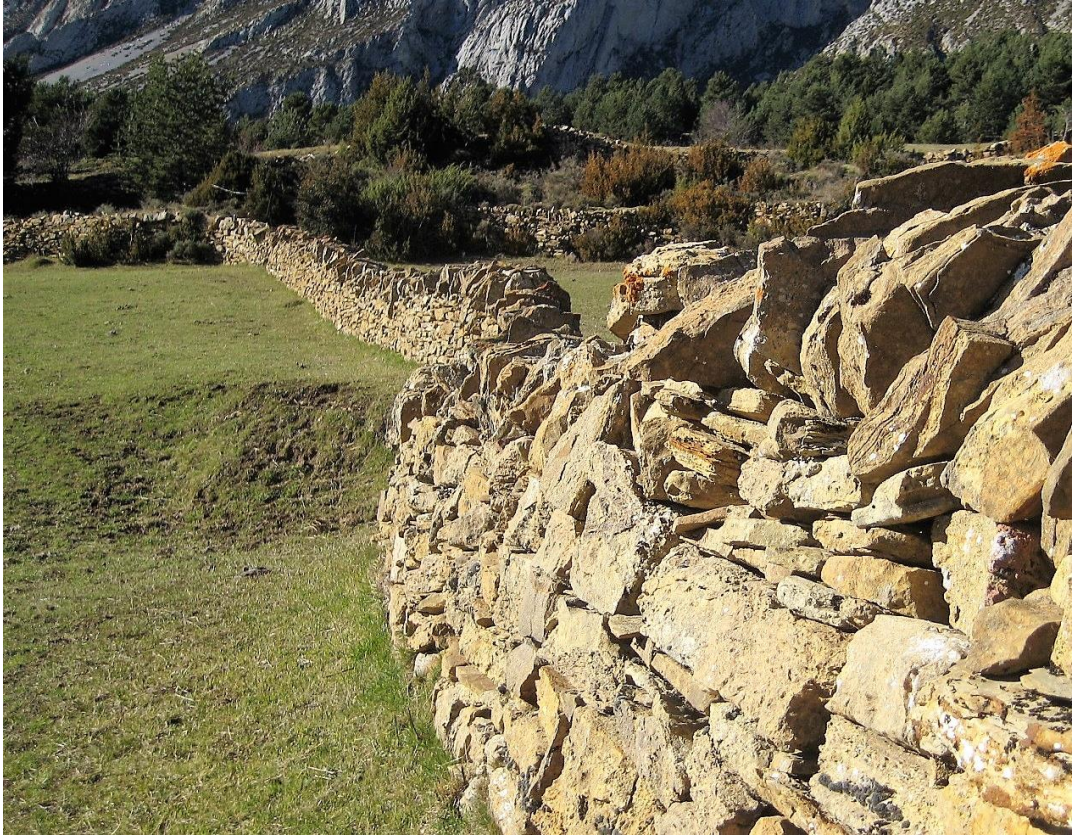
Fig.2 – Murs de pâtures dans les Pyrénées-Orientales