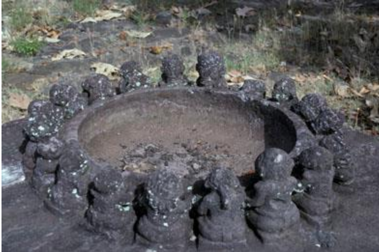
Assemblée à Nuku Hiva, sculpture de l'esplanade de Taiohae

De manière assez inattendue, l'une des particularités du Quart Livre est aussi la décision de Pantagruel de tenir le journal de l'expédition :