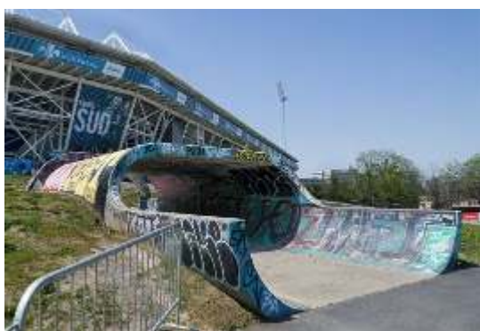
Photographie du spot « Big O » à Montréal