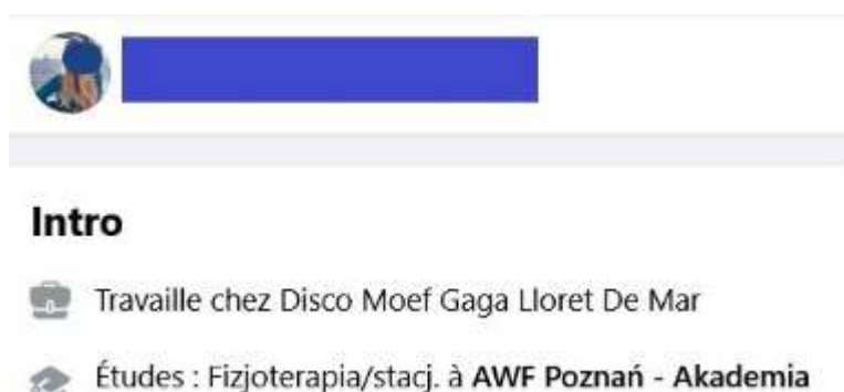
Image 1 Un travail qui s'affiche sur les réseaux.

Source : Capture d'écran Facebook sur la page d'une ancienne employée de boîte de nuit. Plusieurs années après la fin de son travail de saisonnière, cette jeune femme n'a pas changé la mention de son emploi dans une discothèque de Lloret sur son profil Facebook.