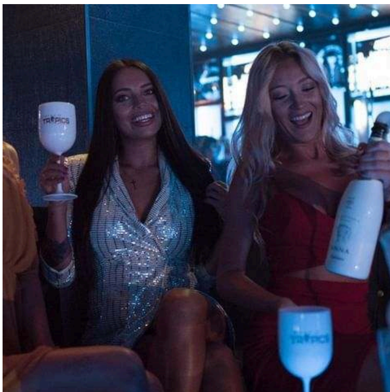
Image 12 : Brouillage entre loisir et travail pour les T.Girls dans la communication du club.