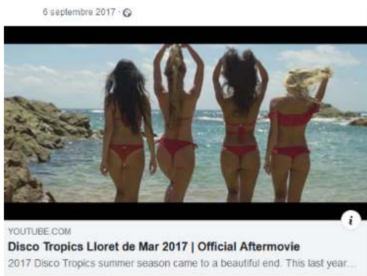
Image 10 : Cover image de la vidéo promotionnelle du club T. mettant en scène les T. Girls dénudées.