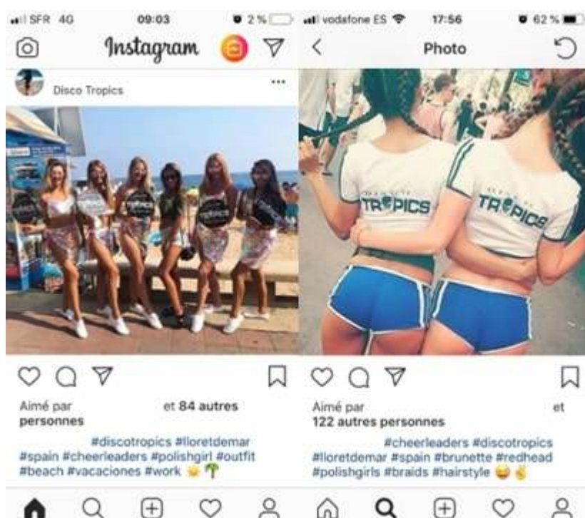
Image 6 et 7 : Une représentation outrancière du genre affichée sur les réseaux.