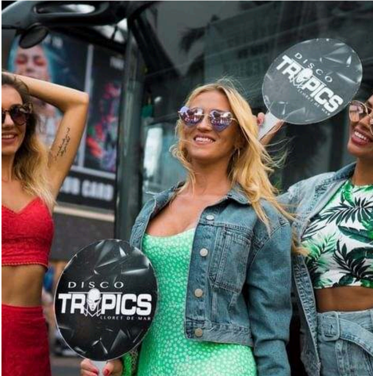
Image 9 : Une photo de T. Girls moins populaire sur les réseaux sociaux.