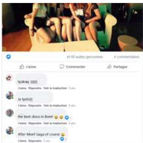
Image 11 : Les rabatteurs représentent le club en toutes circonstances, y compris sur les réseaux.