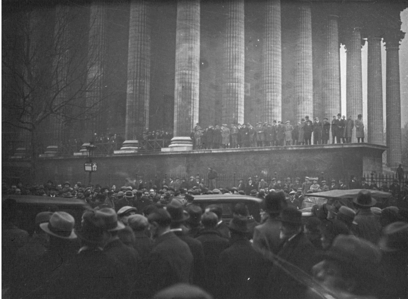
Les manifestants se rassemblent place de la Madeleine, le 6 février 1934.