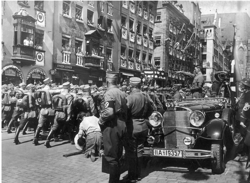
Des SA défilent devant Hitler à Nuremberg, en septembre 1934.

La reprise des discussions d'État à État, hors du cadre de la SDN, contribue à marginaliser l'organisation internationale qui est, de plus, à la peine pour trouver des solutions et imposer des arbitrages. Face à la dégradation de la situation internationale, la défense des intérêts particuliers des États prend le dessus, chacun cherchant à son profit, au besoin au détriment des autres, y compris quand il s'agit de ses propres alliés, une sécurité sur laquelle planent désormais de plus lourdes menaces.