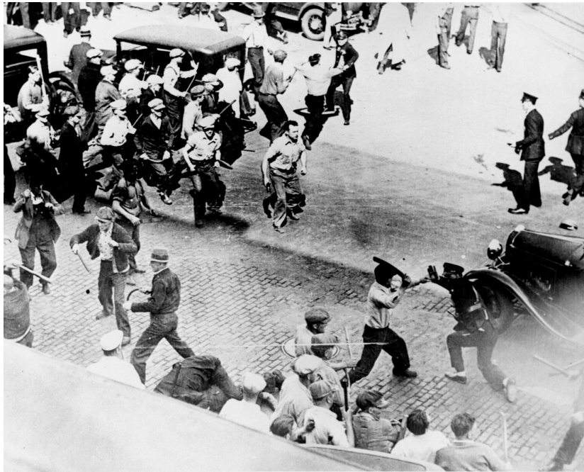
Affrontements violents pendant une grève à Minneapolis en juin 1934.

contraignant engagement en faveur de la mise sur pied d'un système garantissant la sécurité de tous les pays européens.