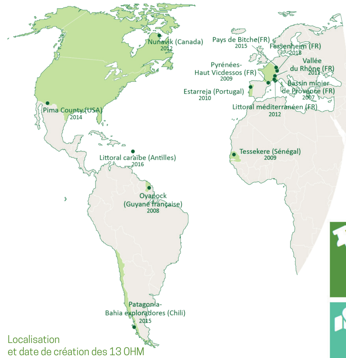
Localisation et date de création des 13 OHM

Dispositif de Recherches Interdisciplinaires sur les Interactions Hommes-Milieu