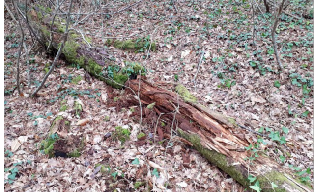
Figure 2 : tronc en décomposition, lieu de prélèvement de la mousse (ALIBERT, 2022)

Dans cet exemple, la mousse est utilisée pour le confort des humains, et possiblement pour sa dimension esthétique. La valeur instrumentale semble dominer. En reprenant la typologie de l'IPBES sur les façons de se connecter à la nature, on peut interpréter cette situation comme une façon de « se considérer comme vivant de (from) la nature » (encadré 1), où