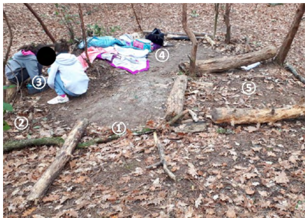
Figure 4 : Cabane de deux louvettes (8-11 ans), sortie du 19 février 2023 (ALIBERT, 2023). La numérotation renvoie aux différentes pièces créées : 1- entrée ; 2- salle de bain ; 3- salle de jeux ; 4- salon/salle à manger ; 5- jardin

la cabane se compose d'une « cuisine », d'une « salle de bains » et d'un « salon ». D'une sortie sur l'autre, on retrouve un découpage fonctionnel qui évolue assez peu. Lors de la sortie du 19 février 2023, les deux louvettes me montrent les différentes pièces qu'elles ont créées (figure 4) : une « entrée », après l'entrée à gauche la « salle de bain », juste après la salle de bain le « mini parc », le « salon / salle à manger » et le « jardin ». Le mini-parc deviendra très vite la « salle de jeux ».