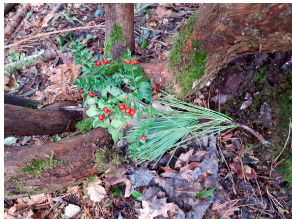
Figure 8 : Les végétaux récoltés sont disposés par E24 (F, 8 ans) dans sa cabane (ALIBERT, 2023)

Force est de constater que l'activité qui consiste à cueillir, à récolter s'avère aussi une façon de tisser des liens sensibles avec la nature (encadré 5, figure 8)