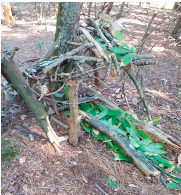
Figure 7 : Cabane construite lors de la sortie du 11/09/22. Un « lit » est aménagé entre deux morceaux de bois et tapissé de feuilles de châtaigner (ALIBERT, 2022)

Ils se disputent sérieusement cette fois-ci, pas un jeu de rôle. [...] je note aussitôt les échanges sur mon téléphone portable. Signe de la dispute, ils jettent des bâtons, se fâchent et se séparent.