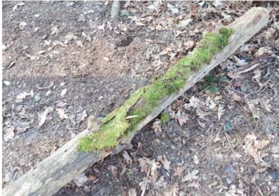
Figure 1 : rondin recouvert de mousse pour aménager un banc dans la cabane (ALIBERT, 2022)

Le groupe a l'idée de ramener de la mousse pour recouvrir le rondin qui constitue à la fois une limite et qui va être aménagé comme un « banc » confortable, pour s'asseoir. Le garçon ramène de la mousse aux deux filles, qui la placent ensuite sur le rondin [figure 1]. La mousse qui est utilisée provient d'un autre tronc, plus loin, en décomposition [figure 2]. Le garçon ramène à chaque fois un morceau qu'il récupère sur ce tronc. [...] L'une des filles affirme en parlant de l'espace recouvert de mousse : « ce sera la meilleure place ».