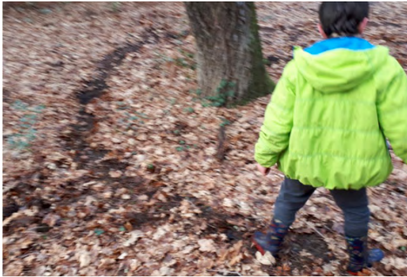
Figure 5 : « Je trace mon trait de défense, mon territoire » (E21) – (ALIBERT, 2023)