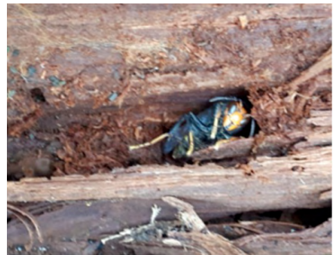
Figure 3 : la « guêpe morte » trouvée par le garçon chargé de collecter la mousse (ALIBERT, 2022)

[...] Le garçon retourne chercher de la mousse sur le vieux rondin. En soulevant l'écorce, il trouve une « guêpe morte ». Il souhaite la montrer à ses copines. Il revient vers elles et leur demande de venir. Il veut leur montrer une « surprise » mais une surprise « triste » dit-il. Les filles vont voir, regardent, et disent qu'elle est morte. Elles repartent. Le garçon remet l'écorce à son emplacement, telle qu'elle était. Il recouvre l'insecte. J'interprète son geste comme une forme de respect. Curieux, moi aussi je me dirige plus près pour voir ce qu'il a montré, je soulève l'écorce et m'approche. Le garçon me demande : « Pourquoi tu regardes ? ». Je lui réponds que je voulais voir ce que c'était. [...] Ensuite, le garçon continue de prendre de la mousse mais à l'extrême opposé de là où il a vu l'insecte mort.