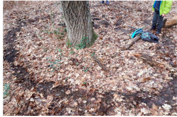
Figure 6 : territoire tracé par E21 tandis que E27 se situe en dehors du tracé (ALIBERT, 2023)