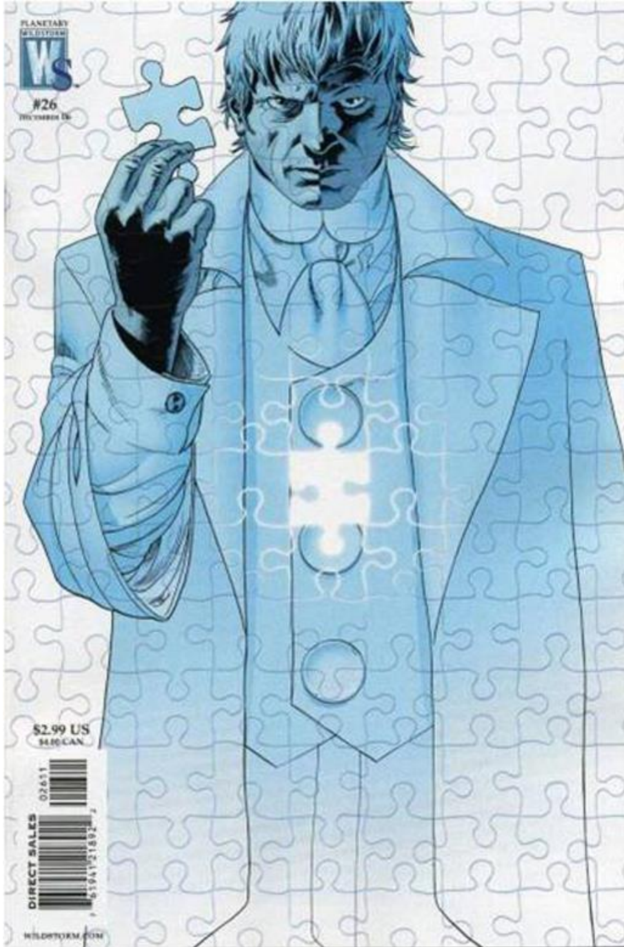
Illustration 9 (TM & © 2013 DC COMICS. ALL RIGHTS RESERVED)