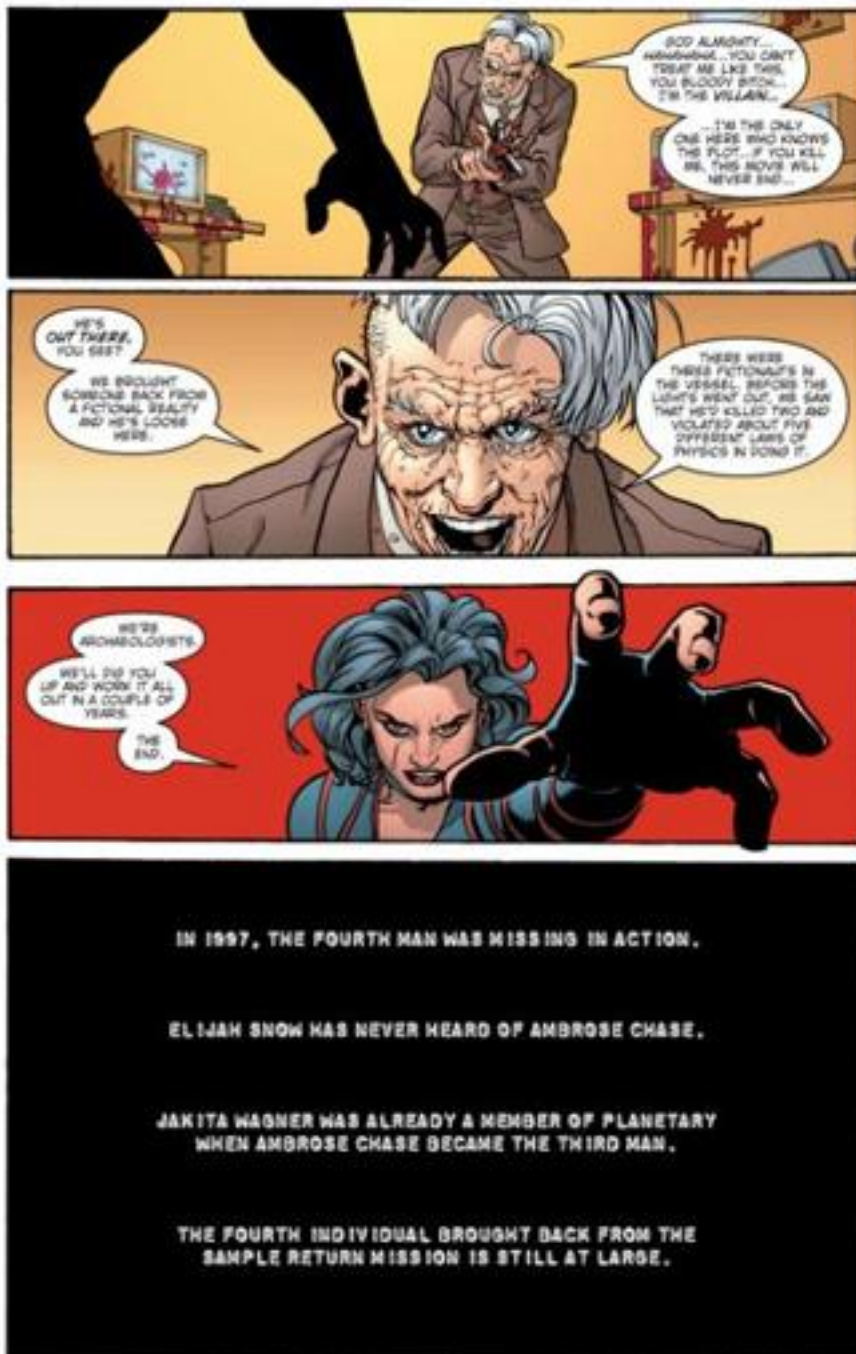
Illustration 3 (TM & © 2013 DC COMICS. ALL RIGHTS RESERVED)

Rompant de son caractère textuel la dynamique graphique de la planche, la case est d'emblée problématique, extérieure à la narration tout en n'appartenant pas véritablement au paratexte. Sa position en bas de page accentue le paradoxe, au même titre que les propos de Jakita Wagner dans l'avant-dernière vignette : « We're