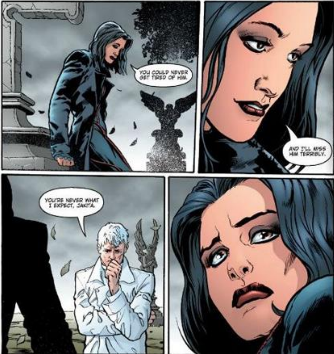
Illustration 6-1