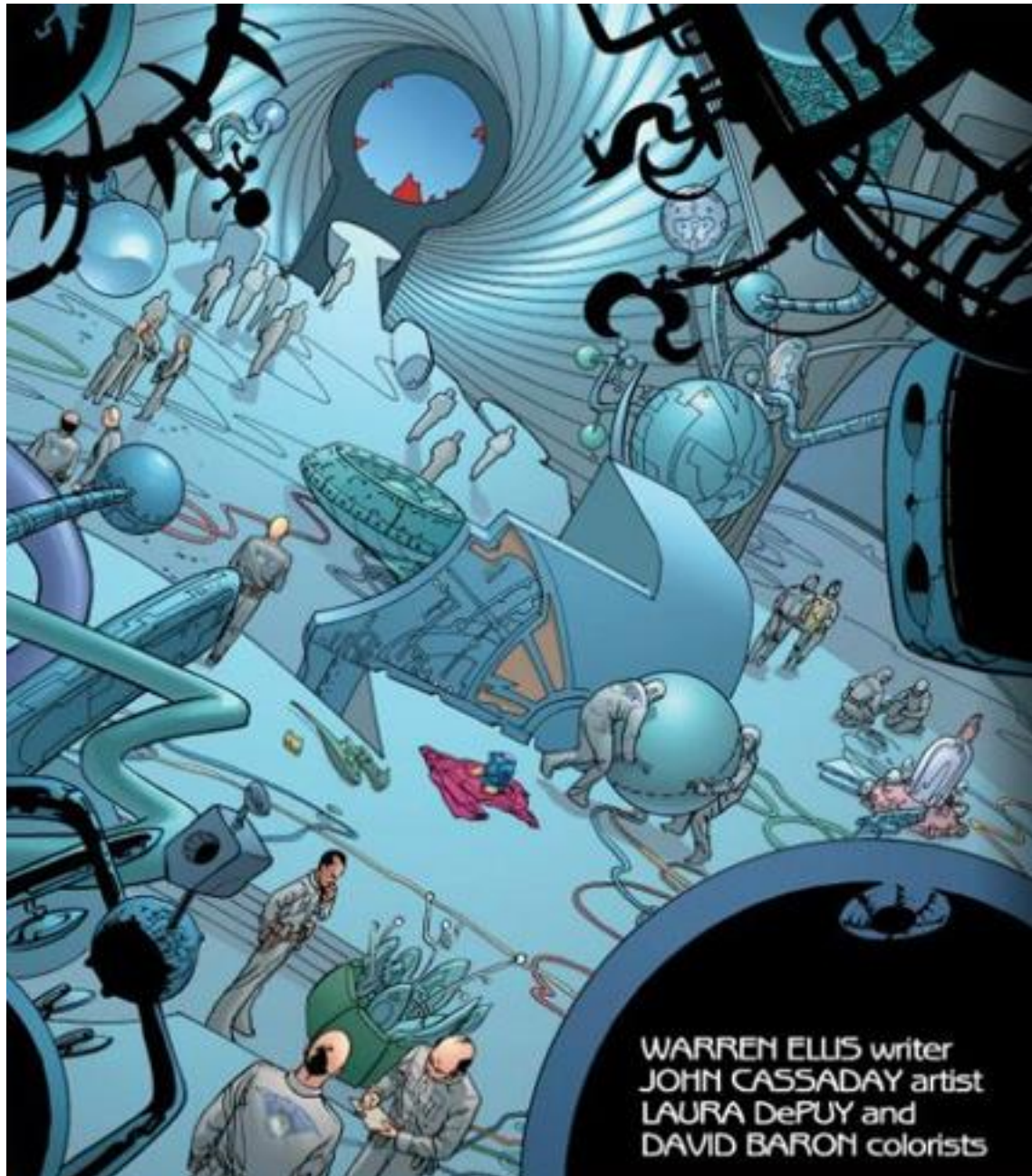
Illustration 1 (TM & © 2013 DC COMICS. ALL RIGHTS