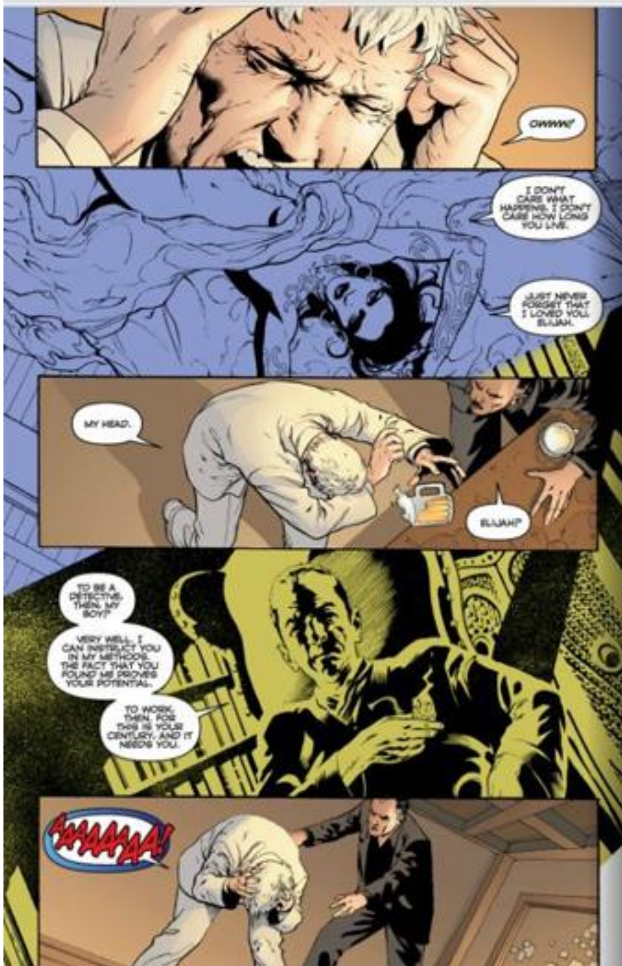
Illustration 4 (TM & © 2013 DC COMICS. ALL RIGHTS RESERVED)

vignettes extraites de leur situation d'origine. En tant que segments narratifs isolés de leur contexte, elles acquièrent une valeur proleptique, suggérant la reconstitution future des séquences auxquelles elles appartiennent.