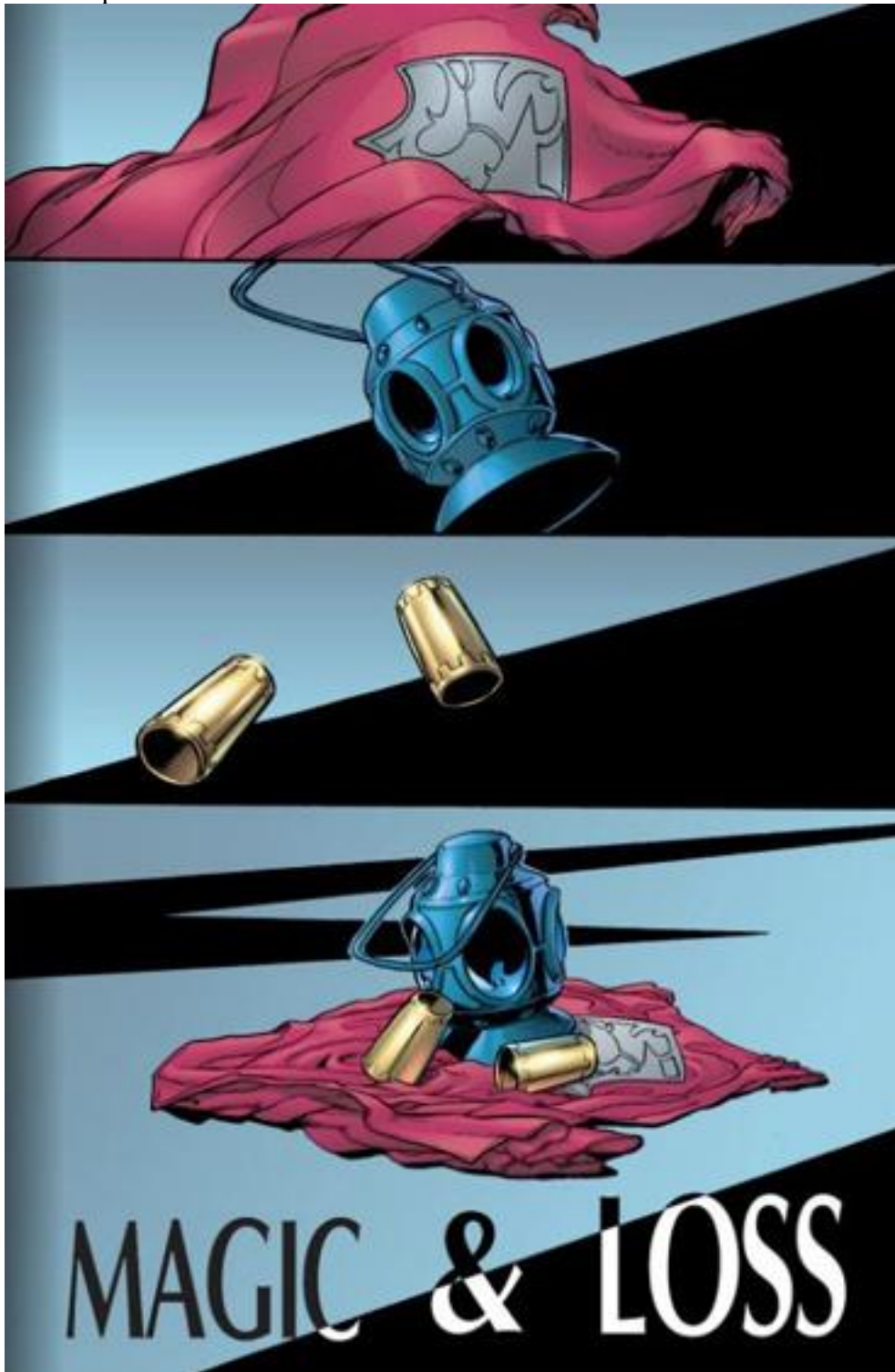
Illustration 2 (TM & © 2013 DC COMICS. ALL RIGHTS RESERVED)

découvre-t-on alors, sont d'exactes imitations de ces trois super-héros emblématiques.