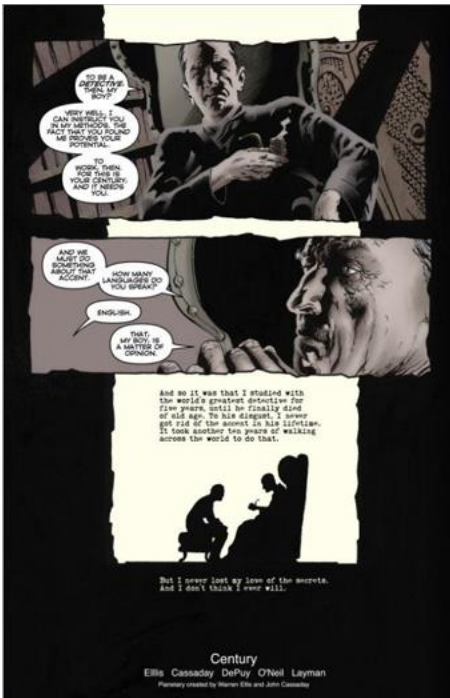
Illustration 5

Cette réitération met alors l'accent sur l'alinéarité du récit qui juxtapose en une même planche différentes temporalités. L'exemple est d'autant plus révélateur que, dans l'ordre temporel de l'intrigue, la rencontre entre Snow et le détective est antérieure et constitue une analepse. La première représentation de la vignette a donc une double valeur : extrait d'un flashback dans la chronologie de l'histoire et segment proleptique dans la mise en récit puisque sa scène d'origine sera représentée ultérieurement. Cet enchâssement produit en cela un bouleversement