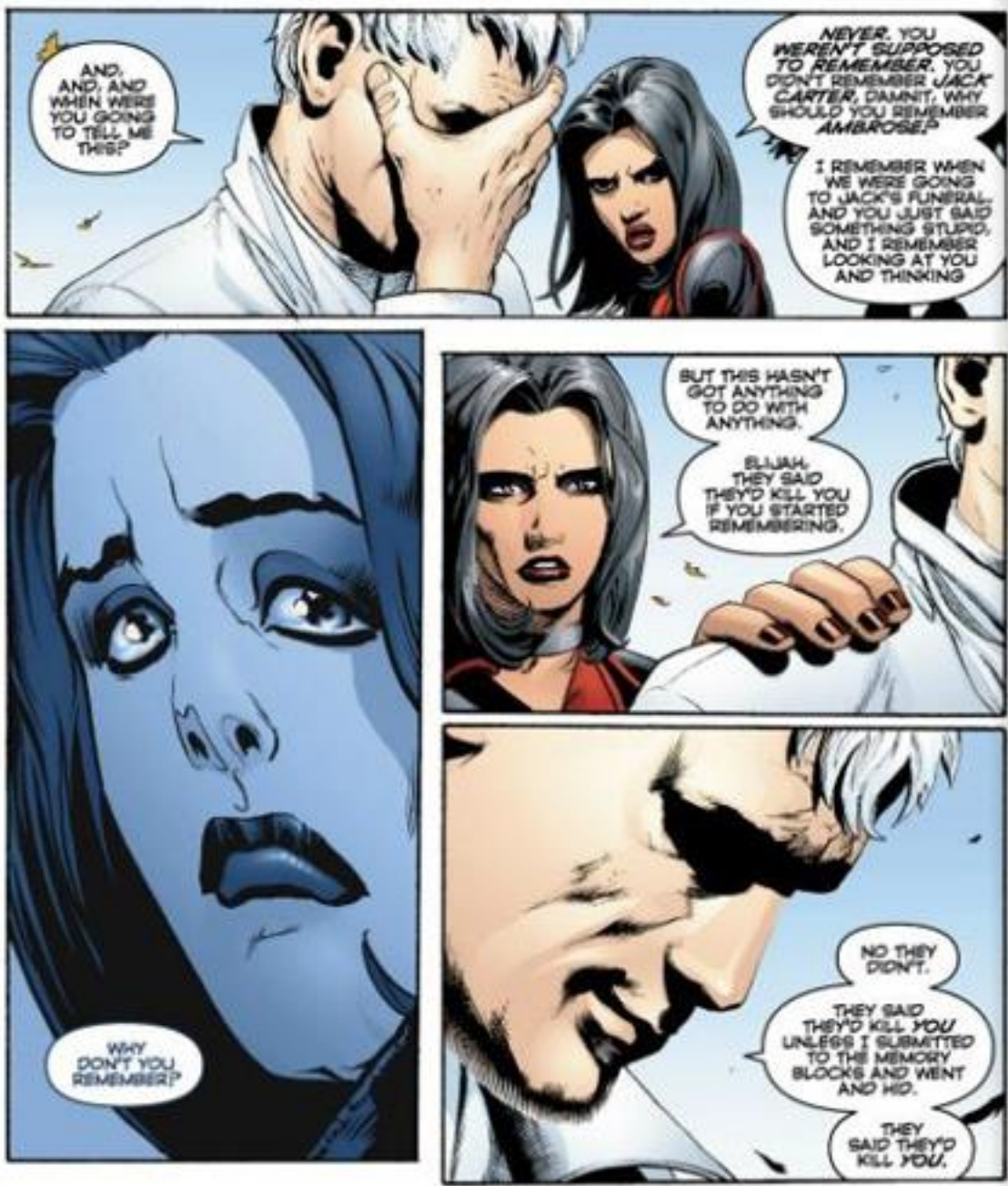
Illustration 6-2 (TM & © 2013 DC COMICS. ALL RIGHTS RESERVED)

Le regard, revu dans un contexte différent, statue sur ses fonctions de leurre et d'indice et entraîne une relecture de la scène dont il est extrait. Le texte (« Why don't you remember? 21 ») assure une fonction de commentaire, complétant le mystère du détail en lui donnant un autre rôle, celui d'un fragment destiné à réintégrer son contexte d'origine.