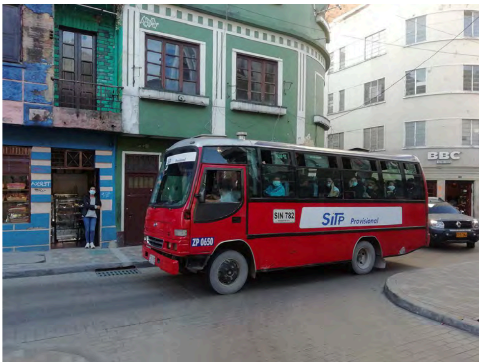
Figure 8 : Buseta du SITP Provisional à La Candelaria avant sa disparition, en novembre 2021.

transport artisanal à couvrir les lignes manquantes avec les vieilles busetas , de manière provisoire, sous le nom SITP Provisional (Figure 8). La transition du transport artisanal au SITP Zonal s'est donc faite ligne par ligne, sur une décennie : la SDM créait la nouvelle ligne sur le parcours de l'ancienne, puis retirait le permis d'exploitation de cette dernière, ce qui n'a pas été sans générer de la résistance de la part des transporteurs concernés. La disparition totale du SITP Provisional , par retrait des permis des dernières lignes, n'est intervenue qu'en en décembre 2021, alors même que le déploiement du nouveau système n'était pas encore complet [E19, 2021 ; E22, 2022].