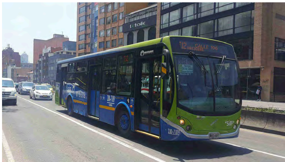
Figure 7 : Bus urbain du SITP Zonal sur la 7 e Avenue en mars 2020.