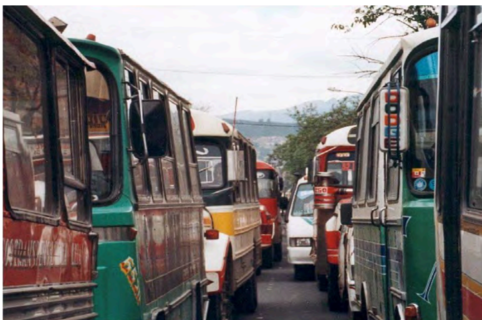
Figure 3 : Congestion de busetas sur la 10 e Avenue en 1998.