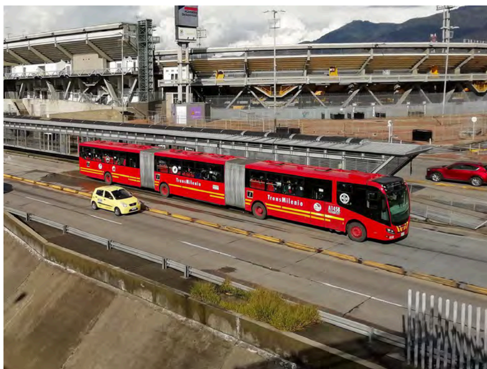
Figure 4 : Bus biarticulé de Transmilenio sur l'Avenue Ciudad de Quito en novembre 2021.

« À l'origine, il était envisagé que Transmilenio atteigne la couverture des charges d'exploitation avec les recettes de billetterie une fois que le système serait complètement en service. [...] Évidemment, en réalité le District doit subventionner l'exploitation. » [J. Pinzón, Sociologue et urbaniste, Université Santo Tomás, Bogotá (E19, 2021)]