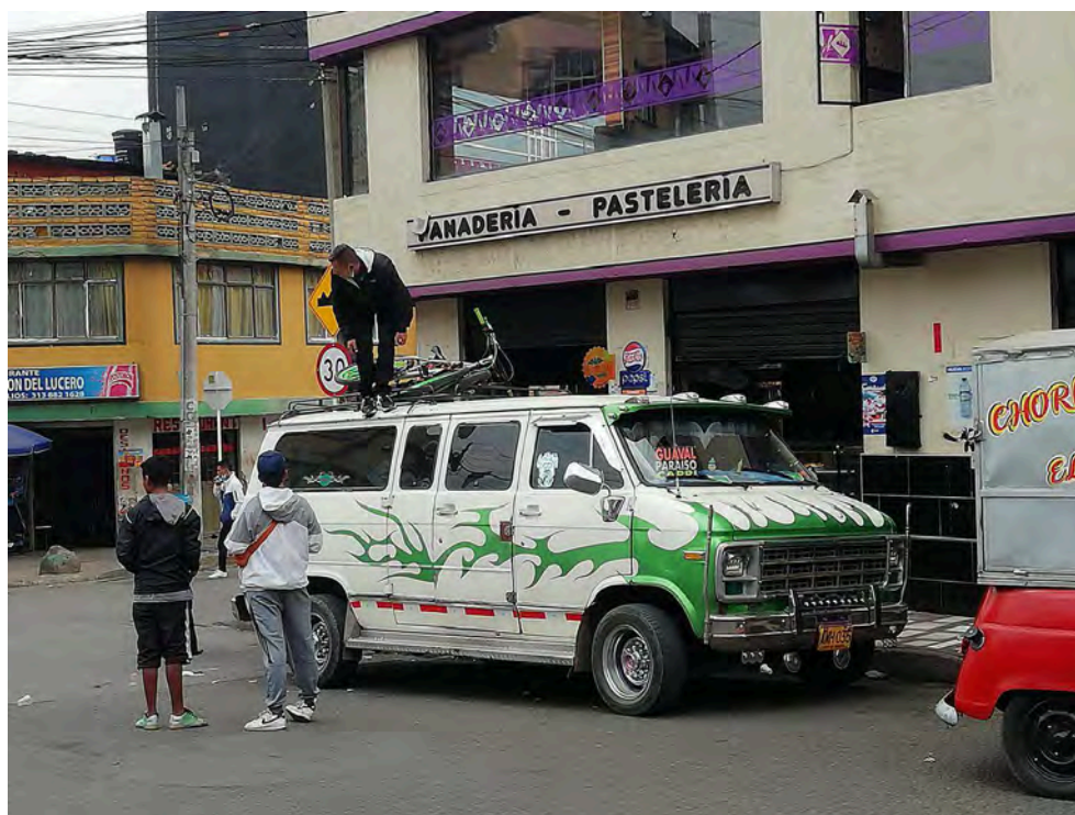
Figure 9 : Van informel chargeant un vélo à Ciudad Bolívar en janvier 2022.