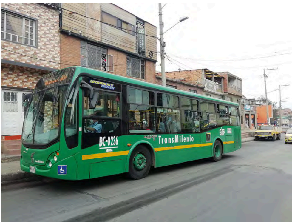
Figure 5 : Bus de rabattement de Transmilenio à Ciudad Bolívar en janvier 2022.