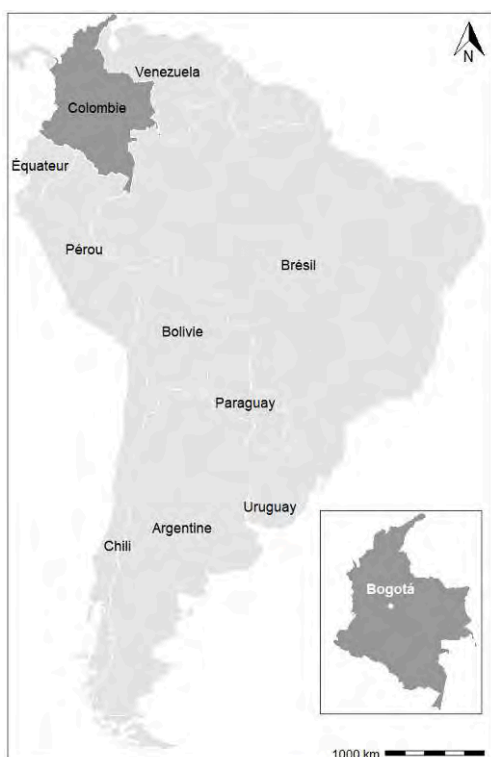
Figure 1 – Localisation de Bogotá en Amérique du Sud. Élaboration des auteurs à partir des données GADM 1