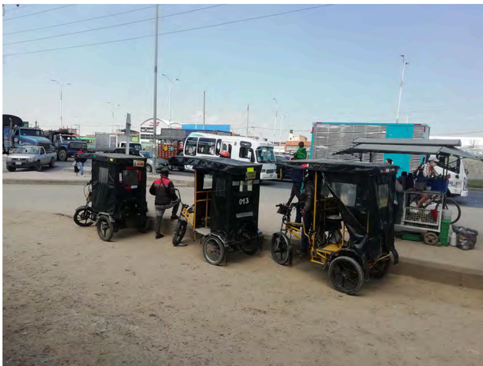
Figure 10 : Vélotaxis diesel attendant des passagers à Soacha en décembre 2021.