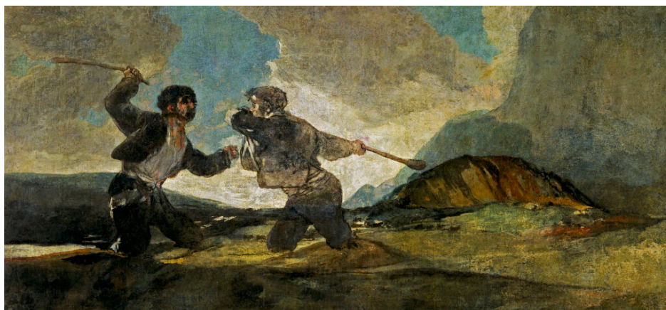
FIGURE 3. « DUELO A GARROTAZOS », 1820-1823 FRANCISCO DE GOYA