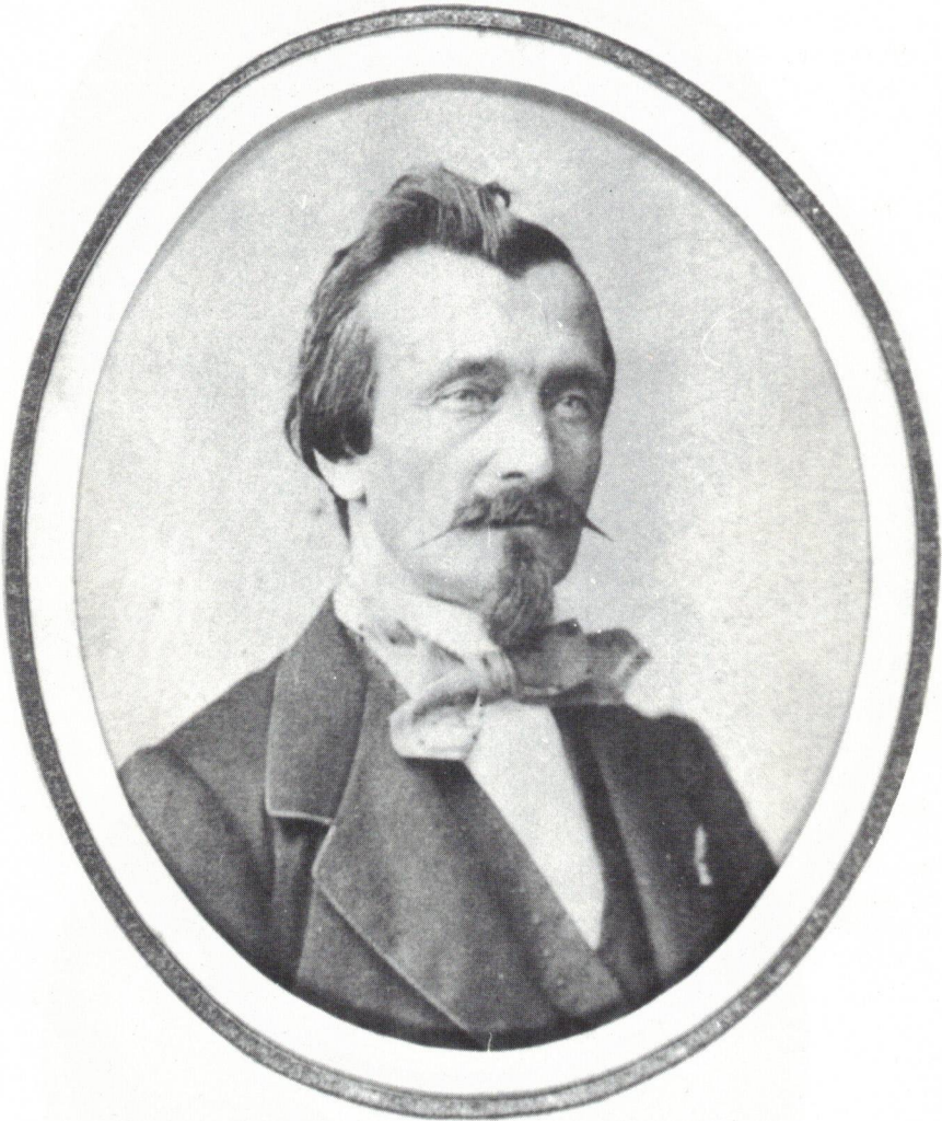
CHENANTAIS Architecte - 1864.

Collection Syndicat des Architectes de Loire-Atlantique