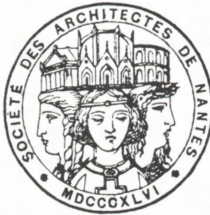
Timbre de la Société des Architectes de Nantes. Dessin de Bourgerel. Les trois sources de l'architecture au XIX e : Athènes, Rome et le Moyen Age gothique.