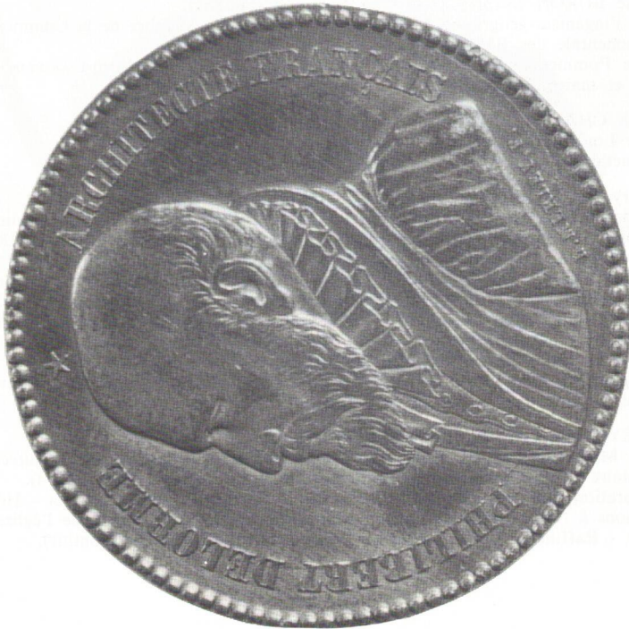
Médaille de la Société des Architectes de Nantes. Collection G. Ganuchaud