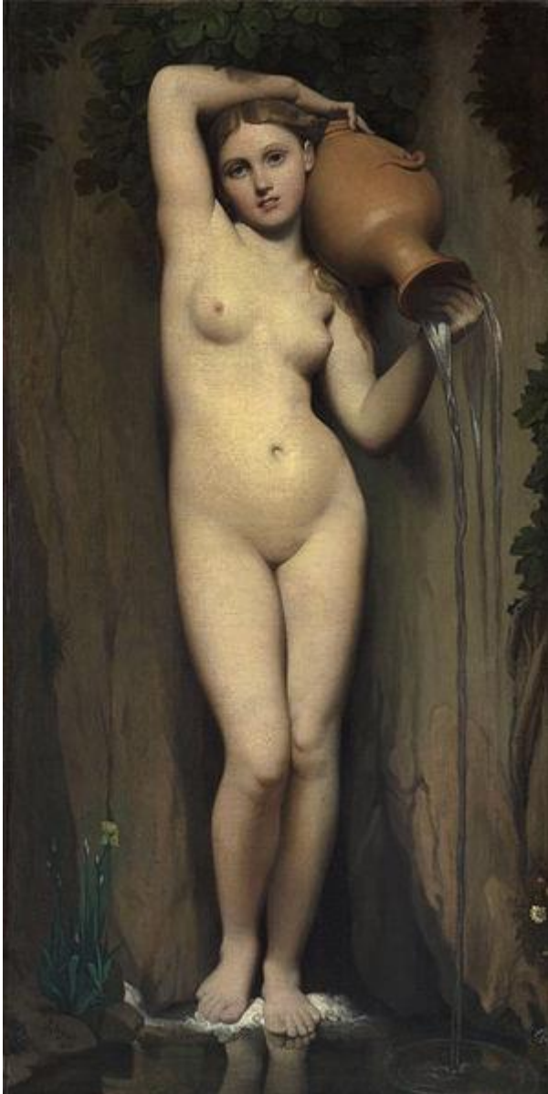
La Source, Ingres, 1820-1856. Musée d'Orsay, Paris.

Ingres était le plus grand représentant de l'art académique, chef de file du néoclassicisme. Il est évident que Pedro Américo, élève à l'École des Beaux-Arts, ne pouvait pas l'ignorer. Il était aussi un des disciples du néoclassicisme 9 . Il faut