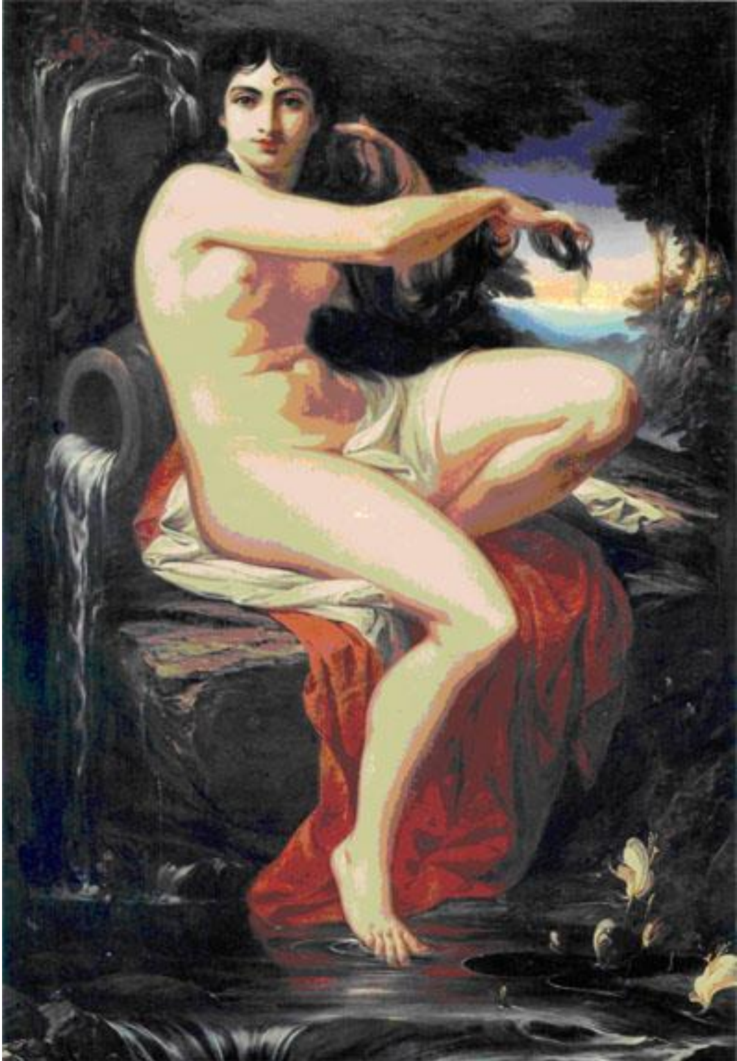
La Carioca, Pedro Américo, 1882, Museu de Belas Artes, Rio de Janeiro.