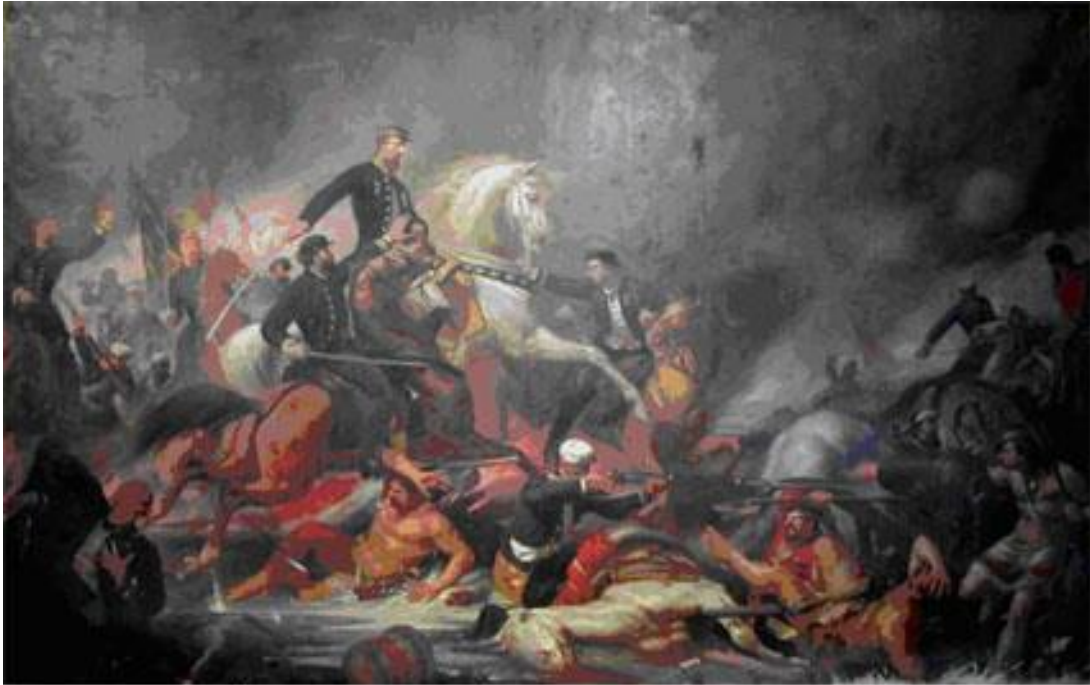
PEDRO AMÉRICO DE FIGUEIREDO E MELO (1843-1905): Batalha de Campo Grande , 1871. Óleo sobre tela, 332 x 530 cm. Petrópolis, Museu Imperial.

amplement couvert par la presse de l'époque rend le peintre définitivement célèbre dans son pays.