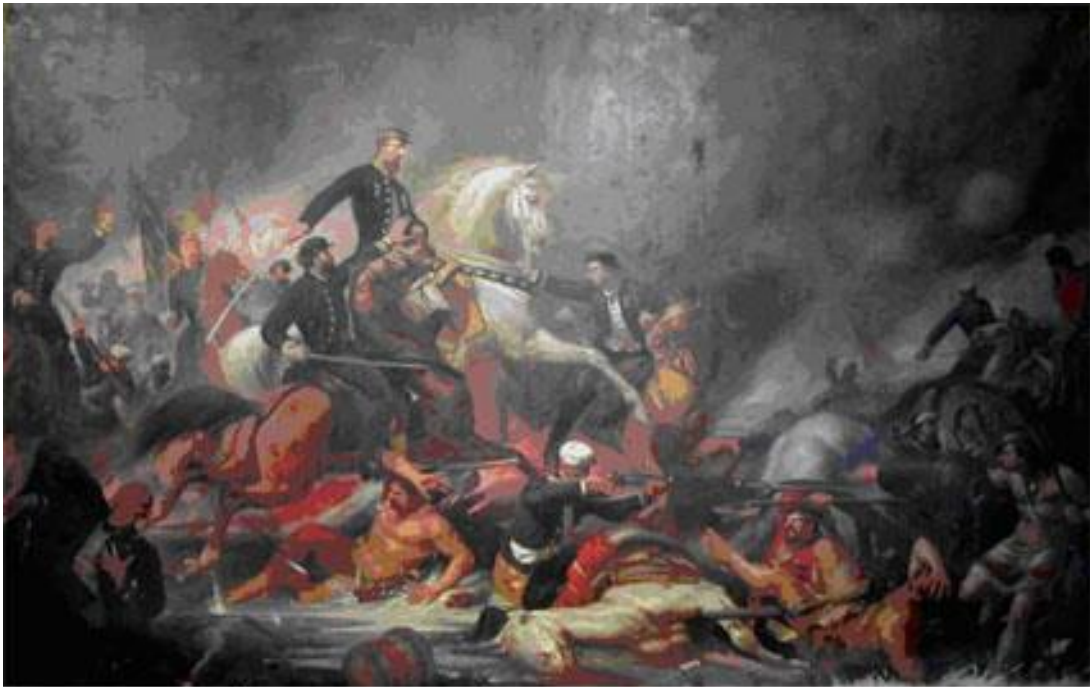
PEDRO AMÉRICO DE FIGUEIREDO E MELO (1843-1905): Batalha de Campo Grande , 1871. Óleo sobre tela, 332 x 530 cm. Petrópolis, Museu Imperial.

amplement couvert par la presse de l'époque rend le peintre définitivement célèbre dans son pays.