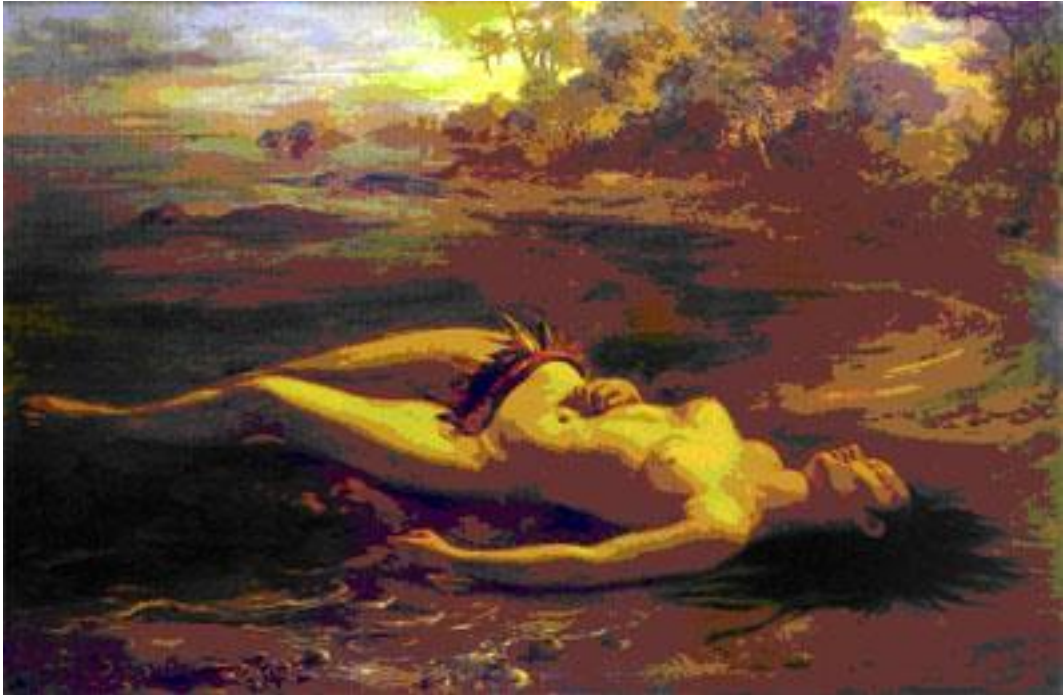
Moema, Victor Meirelles, 1866. Museu de Arte de São Paulo.