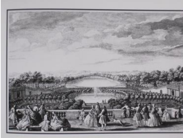
5. Jacques Rigaud, Vue de l'Orangerie de Versailles prise du Parterre du Midi, Maisons royales de France , vers 1730

La distribution irrégulière des groupes dans l'espace, l'aisance et la nonchalance des postures, la suggestion du mouvement, autant d'éléments exprimant l'imprévisibilité de l'âme humaine et la surprise des rencontres, forment un contraste piquant avec la solennité quelque peu sévère des compositions de Le Nôtre. Ainsi, Rigaud représente un moment de transition, où l'esthétique du tableau mouvant si essentielle aux jardins pittoresques commence à s'installer à l'intérieur du jardin classique, dont la distribution, associée dans le cas de Versailles à une éthique de l'ostentation mondaine, conduit cependant à mettre l'accent sur la composante humaine du spectacle. Les commentaires de Morel trouvent ici une parfaite illustration, dans la mesure où l'attrait visuel de la promenade repose essentiellement sur l'agrégation instable des corps, le ballet aléatoire résultant de l'addition de dynamiques particulières.