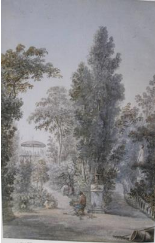
9. Jean Pillement (attr. à), Vue du jardin de Beaumarchais, gouache sur papier

de l'artiste ou de l'amateur ou dessinant sur le motif est si récurrente qu'elle devient un poncif du genre [fig.9].