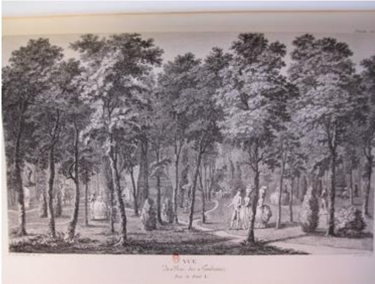
7. Louis Carrogis de Carmontelle, Jardin de Monceau, Vue du Bois des Tombeaux , 1779

Sur le plan de la répartition des masses visuelles, cela signifie que l'élément naturel devient prépondérant par rapport à la composante humaine. Bien entendu, la signification de la figure ne peut être interprétée en dehors des contraintes esthétiques ou techniques de la représentation plastique. Dans la tradition des vues topographiques, la figure occupe la double fonction d'ornement et d'instrument herméneutique : elle est au cœur d'une transformation du lieu en « lieu pratiqué » qui permet de mettre en évidence ses fonctions, ses usages habituels (ou d'éventuels détournements de ces derniers) ; mais elle intervient aussi comme unité de mesure, permettant d'apprécier les proportions d'un édifice, la distance qui sépare les différents plans de l'image. En effet, avec l'abandon du dessin géométrique, le corps humain est investi du rôle d'étalon dévolu jusque-là aux repères fixes de la perspective linéaire 19 . La localisation de la figure devient en elle-même signifiante, dans la mesure où elle indique l'emplacement des différents principaux points de vue du jardin. Le contact oculaire et l'échange des rôles respectifs de spectateur et d'acteur s'effectuent désormais dans le cadre de ces vis-à-vis concertés, ces croisements de point de vue à partir desquels se définit le tracé du chemin dans la genèse du jardin paysager, et qui imprime son dynamisme à la promenade. Dans la « Vue de la hauteur du Minaret », un itinéraire est jalonné par la silhouette des