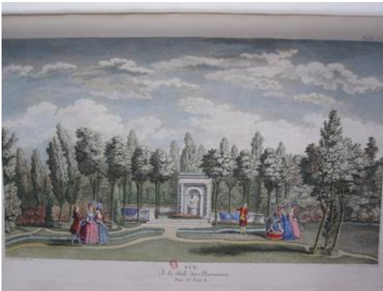
6. Louis Carrogis de Carmontelle, Jardin de Monceau , Vue de la Salle des Marronniers, 1779

J'illustrerai ce propos à partir des vues que Carmontelle 17 a données du « jardin de Monceau », dans un recueil de gravures qui fut publié à l'issue des travaux d'aménagement dont le duc de Chartres lui avait confié la responsabilité 18 . La promenade y apparaît comme activité pratiquée à l'intérieur d'une société restreinte (cercle familial ou amical, relation galante). En même temps, les vues montrent clairement comment la structure séquentielle du jardin paysager exclut les effets de réunion et de concentration observés dans les parcs réguliers.