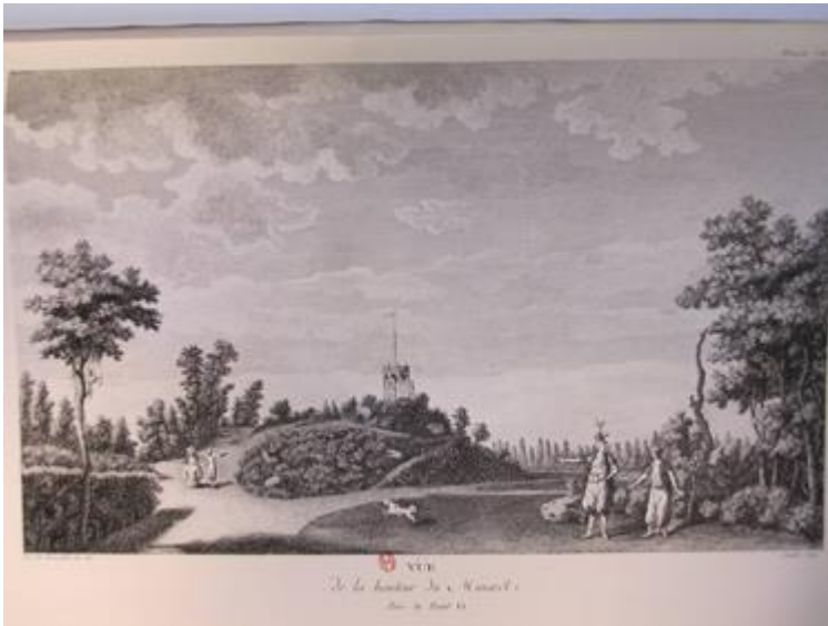
8. Louis Carrogis de Carmontelle, Jardin de Monceau, Vue de la hauteur du Minaret, 1779

différents personnages et fléché par le geste de ceux qui désignent du doigt un point d'observation distant comme une étape ultérieure du trajet [fig.8].