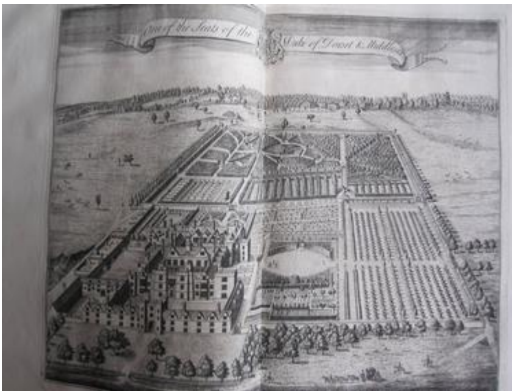
1. J. Badeslade et J. Rocque, « One of the Seats of the Duke of Dorset and Middlesex », Vitruvius Britannicus , t. IV, 1739

Le fonds iconographique apporte, à cet égard, un précieux complément aux sources écrites. Le témoignage apporté par les gravures est d'autant plus précieux qu'il permet de restituer la dimension esthétique de la promenade publique, alors qu'elle tend à devenir souvent, dans la littérature, un simple prétexte à une galerie des types sociologiques et à une chronique des mœurs du temps dont elle offre un condensé. Avant de proposer une lecture de quelques-unes de ces estampes, il n'est sans doute pas inutile de dire quelques mots du rapport que l'imagerie hortésienne entretient avec l'histoire des techniques de représentation topographique. Au XVII e siècle, deux modes de restitution graphique des demeures seigneuriales et princières et de leurs environs sont privilégiés par les ingénieurs géographes et les architectes : d'une part les vues « à vol d'oiseau », d'autre part, des cartes combinant la projection horizontale et la représentation en élévation des bâtiments, hybridation qui configurait un espace paradoxal, mais qui offrait le double avantage d'une information synthétique mettant en évidence la distribution générale du domaine seigneurial et son inscription dans le pays, et d'une visualisation réaliste, par essence limitée mais conforme au sens commun [fig. 1 et 2].