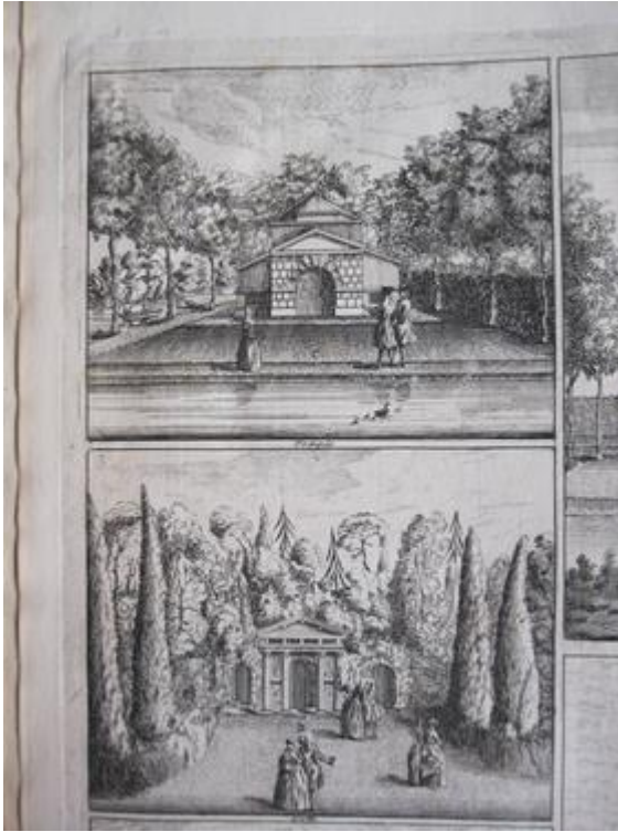
3. J. Rocque, Temple et grotte à Esher, Vitruvius Britannicus , t. IV, 1739

de l'espace. Fidèles à l'esprit des créations de Kent 10 , les gravures de Rocque témoignent d'une conscience claire des potentialités scénographiques du landscape garden de la première heure. On y observe un patron architectural récurrent, dans lequel la fabrique forme la toile de fond d'un plateau délimité latéralement par des éléments végétaux, et occupé par un ou plusieurs personnages [fig. 3] 11 .