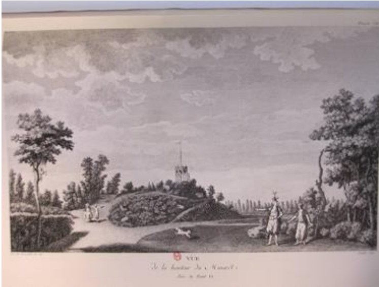
8. Louis Carrogis de Carmontelle, Jardin de Monceau, Vue de la hauteur du Minaret, 1779

différents personnages et fléché par le geste de ceux qui désignent du doigt un point d'observation distant comme une étape ultérieure du trajet [fig.8].