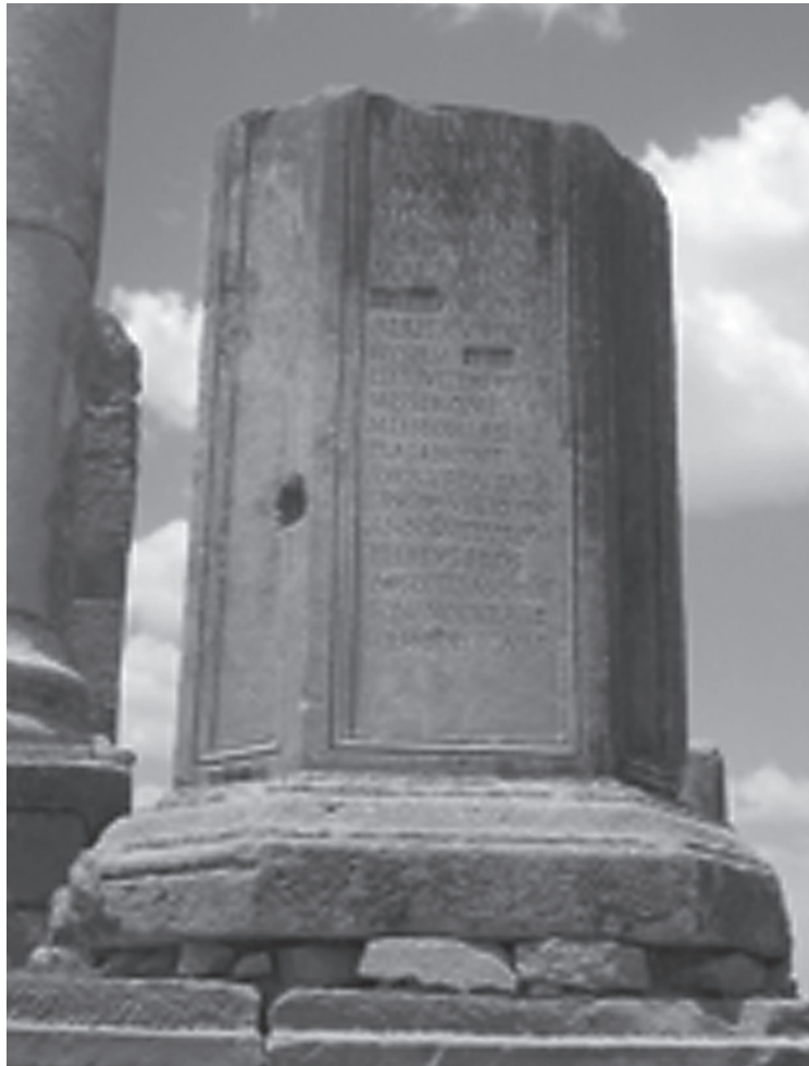
Fig. 3. L'inscription CIL VIII, 2354 Thamugadi.