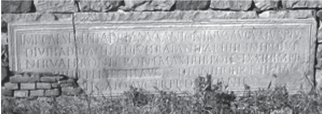
Fig. 2. L'inscription CIL VIII, 4203 Verecunda (photographie de l'auteur 2007).