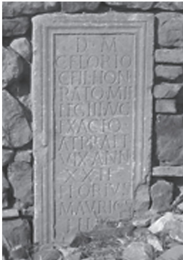
Fig. 1. CIL VIII , 4240 (p. 1769) ( ILS 2387 ) Verecunda, Numidie.

Quelques rares textes n'auraient pas été touchés ayant échappé « à la rage destructrice » évoquée par Y. Le Bohec (31). Dans plusieurs inscriptions, le nom de la légion n'a donc pas été martelé, c'est le cas d'une inscription funéraire (32) de Verecunda du II e p.C.