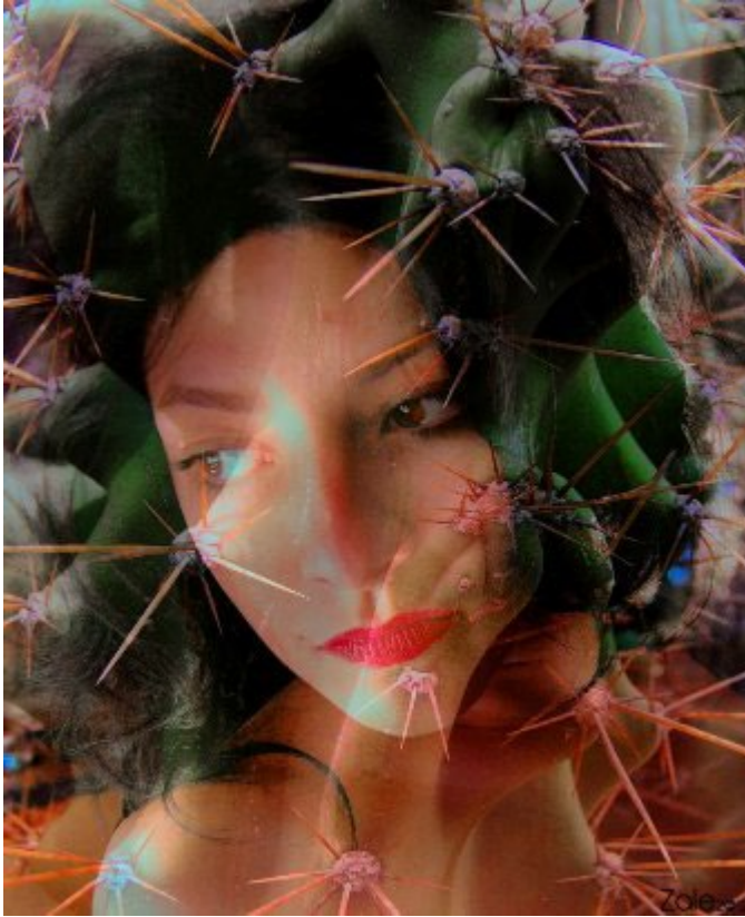
Figure 1 : Philippe Zalé, « Bwa l'épine », exposition Pié d'bwa , 2012.

Le corps est enveloppé de cette douce ou épineuse gangue que l'artiste a voulu lui attacher. Si l'association femme-fleur peut sembler facile, elle amène néanmoins à rendre visible l'invisible, tout ce qui dans le rapport à l'autre est susceptible d'être ressenti et met le spectateur en relation avec ses propres expériences. D'un point de vue temporel, cette démarche s'inscrit aussi dans un rapport à l'Histoire de l'art. Zalé reprend le concept de Madone, icône médiévale de la femme idéalisée et vénérée. Hubert Mary pour sa part (Figure 2, 2011) nous renvoie à cette problématique de la Renaissance qu'est la représentation de l'espace.