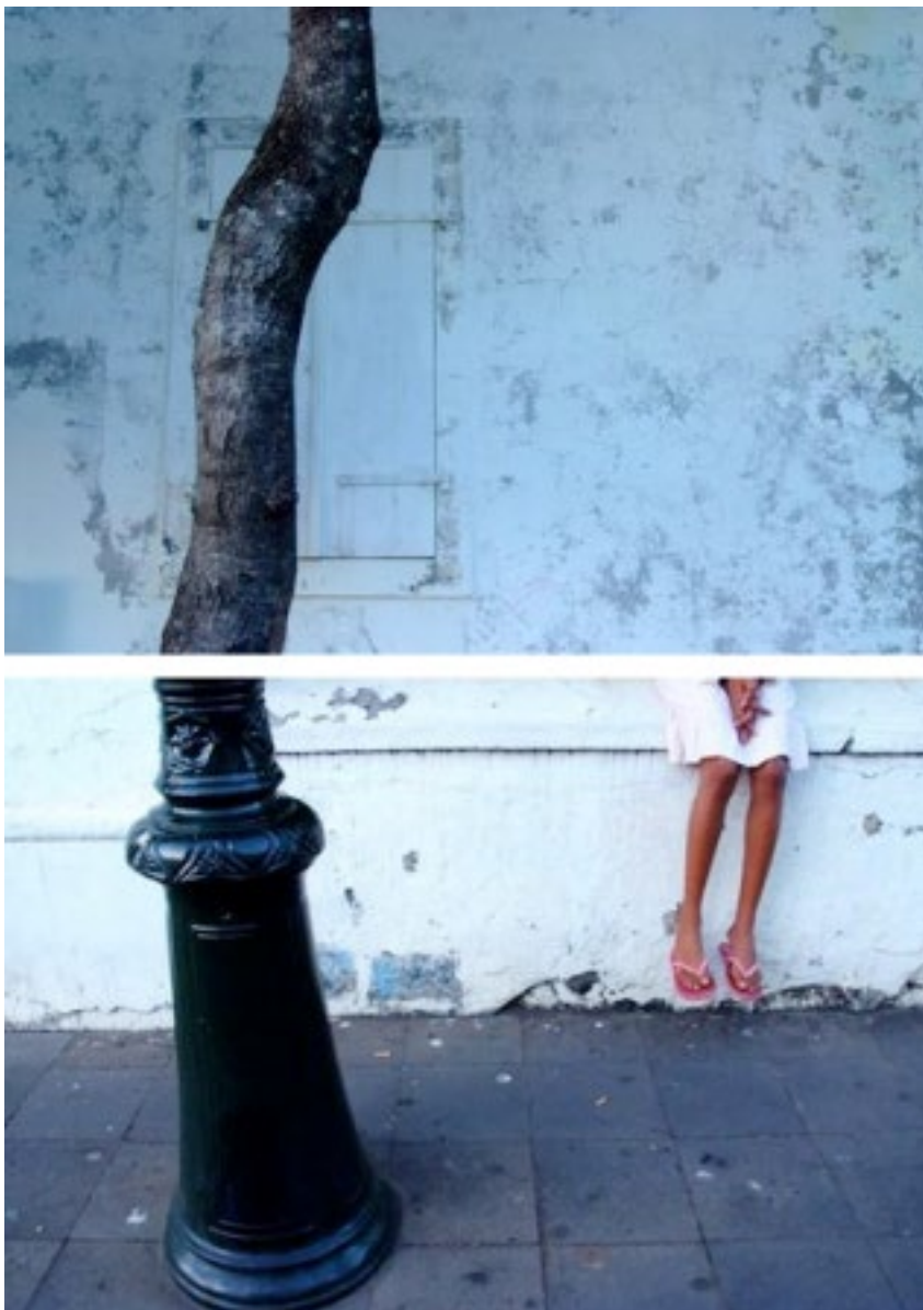
Figure 4 : Johanna Clémencet, « Silence », dans la série Tropical sugar cubes , 2009.

Le passant et la place publique sont sujets de prédilection, ainsi que le bâti un peu décrépi, l'élément naturel et les jambes. À certaine distance, l'Autre demeure entier, mais dès que l'artiste se rapproche, la pudeur fait descendre le regard et nous offre ces corps tronqués. Les différents éléments de ce langage photographique singulier tissent une polysémie, ouvrent à une variété d'interprétations.