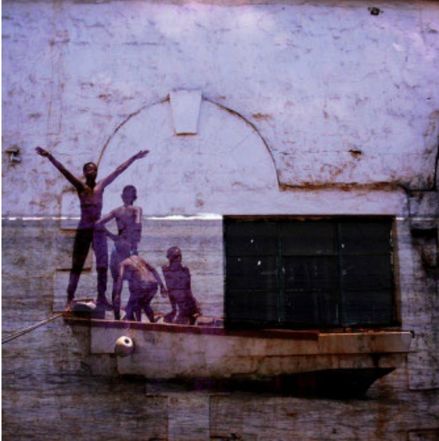
Figure 2 : Hubert Mary, « Les Rois du monde », exposition Surimpressions des Mascareignes , 2011.

Plusieurs de ses photographies placent au centre une fenêtre comme celle à laquelle Alberti faisait référence pour expliquer la composition réaliste d'espaces en perspective. Mary superpose dans une même image le mur, la fenêtre et le paysage cadré par cette fenêtre théorique. Il téléscopie le dénoté, mais aussi la charge connotative de ces éléments visuels. Le passé hante le présent ; ces façades de bâtiments hérités de l'industrie sucrière se surimpriment aux paysages animés de pêcheurs et d'enfants qui jouent dans la mer, autrement dit, tout ce que le touriste des lagons devrait vouloir chérir de son objectif. La réalité délaissée s'accroche à la réalité qui nous captive. En outre, toujours frontale, cette double vision où la barrière du mur est ouverte par ces larges horizons océaniques renvoie à une réalité culturelle réunionnaise. En effet, le peuple réunionnais est traditionnellement tourné vers la montagne et non vers la mer. Cette spécificité tend à changer, les zones maritimes étant peu à peu conquises par différentes activités sportives et récréatives. Mais historiquement, les Réunionnais ont toujours préféré avoir les pieds bien ancrés sur la terre ferme, se méfiant de ce géant liquide qui les cernait.