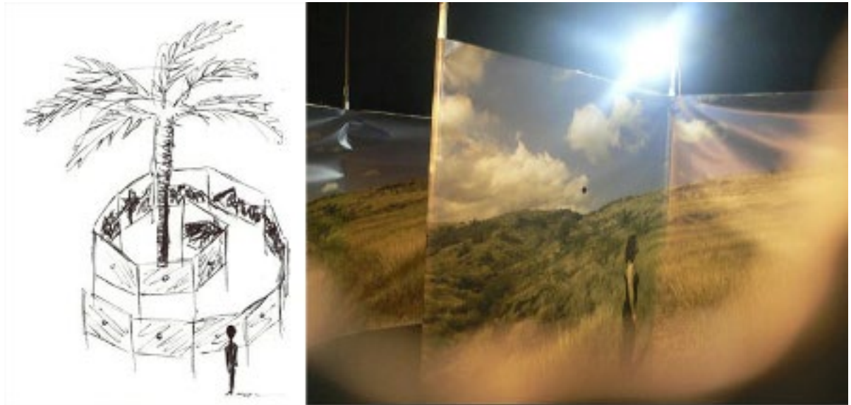
Figure 6 : Valérie Abella « Spirale », exposition Les Nuits de la pleine lune , 2011.

de Valérie Abella (Figure 6, 2011), cernant le spectateur, allant même jusqu'à le gober dans le maelström paysager que cette dernière avait conçu.