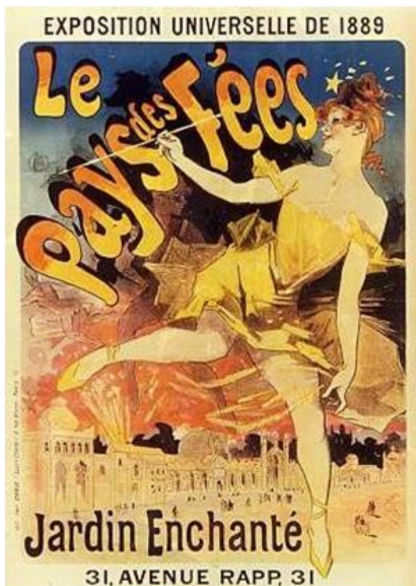
Jules Chéret, Le pays des fées. Jardin enchanté, 1889, Paris, Bibliothèque nationale de France 14

L'affiche, réalisée par Jules Chéret, représente une femme qui porte les attributs d'une fée : elle est vêtue d'un tutu, chaussée de pointes de danse et tient dans ses mains une baguette magique. Une étoile flotte au-dessus de son visage. Le pouvoir de l'électricité et sa dimension spectaculaire sont renforcés par la complémentarité des couleurs : le corps de la femme et le palais illuminent par leurs tons chauds un ciel bleu marine. La dimension magique de l'électricité est mise en valeur à travers la posture de la fée, dont le pied s'évade du cadre de l'affiche, comme pour s'évader du réel. L'électricité permettait donc aux visiteurs de s'évader dans un autre monde. En 1900, un bâtiment entier lui est consacré, le palais de l'électricité, surplombé par une statue de six mètres de hauteur, « la Fée Électricité ».