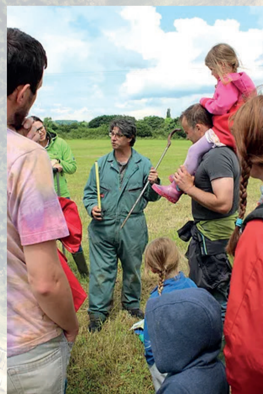
Séance participative de carottage à Bagendon

En fin de projet : évaluation de nos stratégies et approches, validation et modulation.