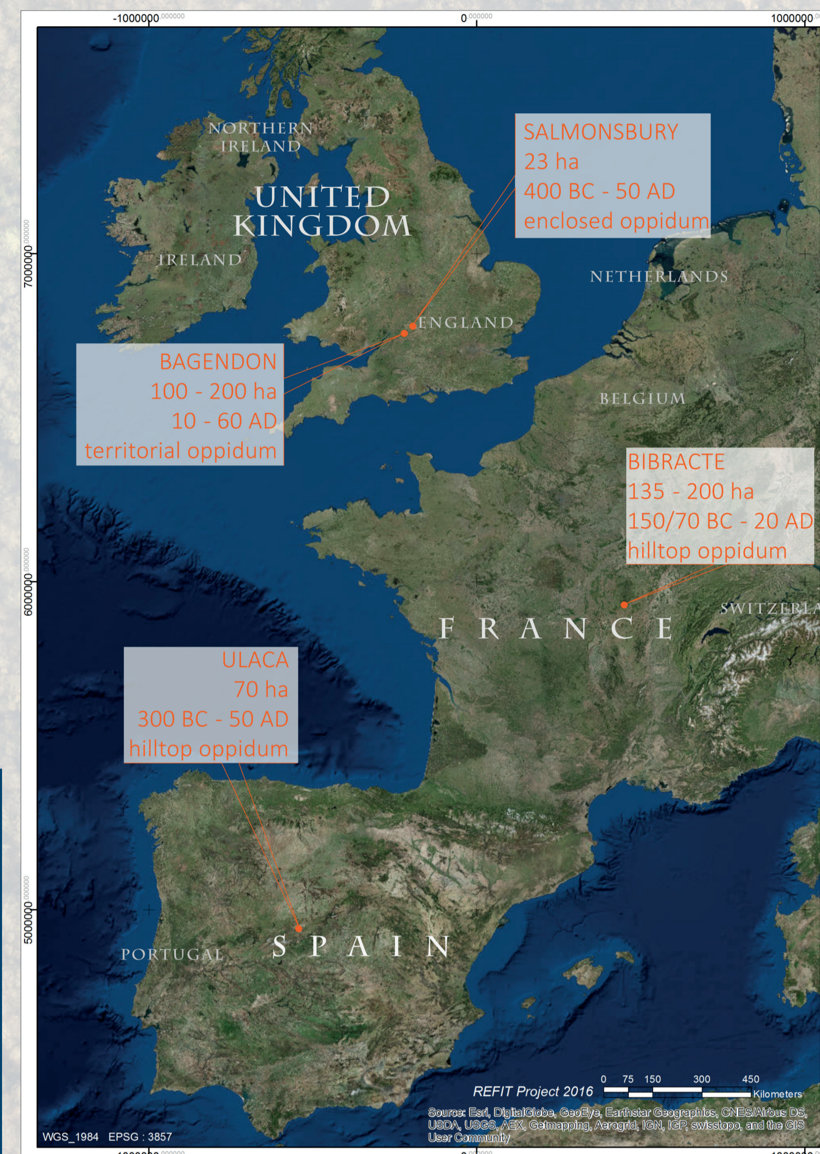
Carte de localisation des sites étudiés pour le projet

Ces quatre sites sont un reflet de la diversité du phénomène des oppida en Europe et tous ont été l'objet d'importants projets de recherches archéologiques qui ont accru notre compréhension de ces paysages.