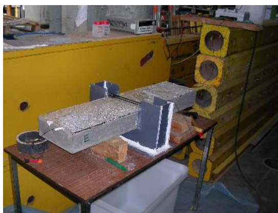
FIGURE 1 – Corrosion des armatures sur une longueur contrôlée de 10 cm

Dans le cadre du projet APPLLET (Durée de vie des ouvrages : Approche PrédicTive Performantielle et probabilisTe), une action de recherche vise à mieux appréhender le comportement d'éléments de structure corrodés sous sollicitations différées a été lancée. Pour cela, deux corps d'épreuve en béton armé de dimension 100 \times 25 \times 10 cm ont été réalisés avec pour armatures deux aciers de type HA20. L'enrobage latéral est de 3,5 cm et 2,5 cm en fond de coffrage. Ces corps d'épreuve ont été corrodés de manière intensiostatique sur des longueurs contrôlées (10 et 50 cm centraux) avec une densité de courant voisine de 100 \mu A/cm^2 pendant une durée de 30 jours. La figure 1 montre le montage expérimental qui a été réalisé afin de contrôler la longueur sur laquelle la corrosion doit se développer.