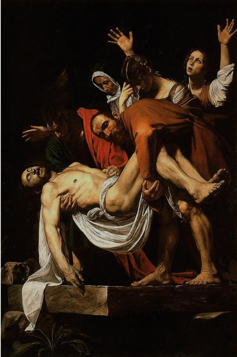
Le Caravage, Mise au tombeau , 1602-1604. Musée du Vatican, Rome