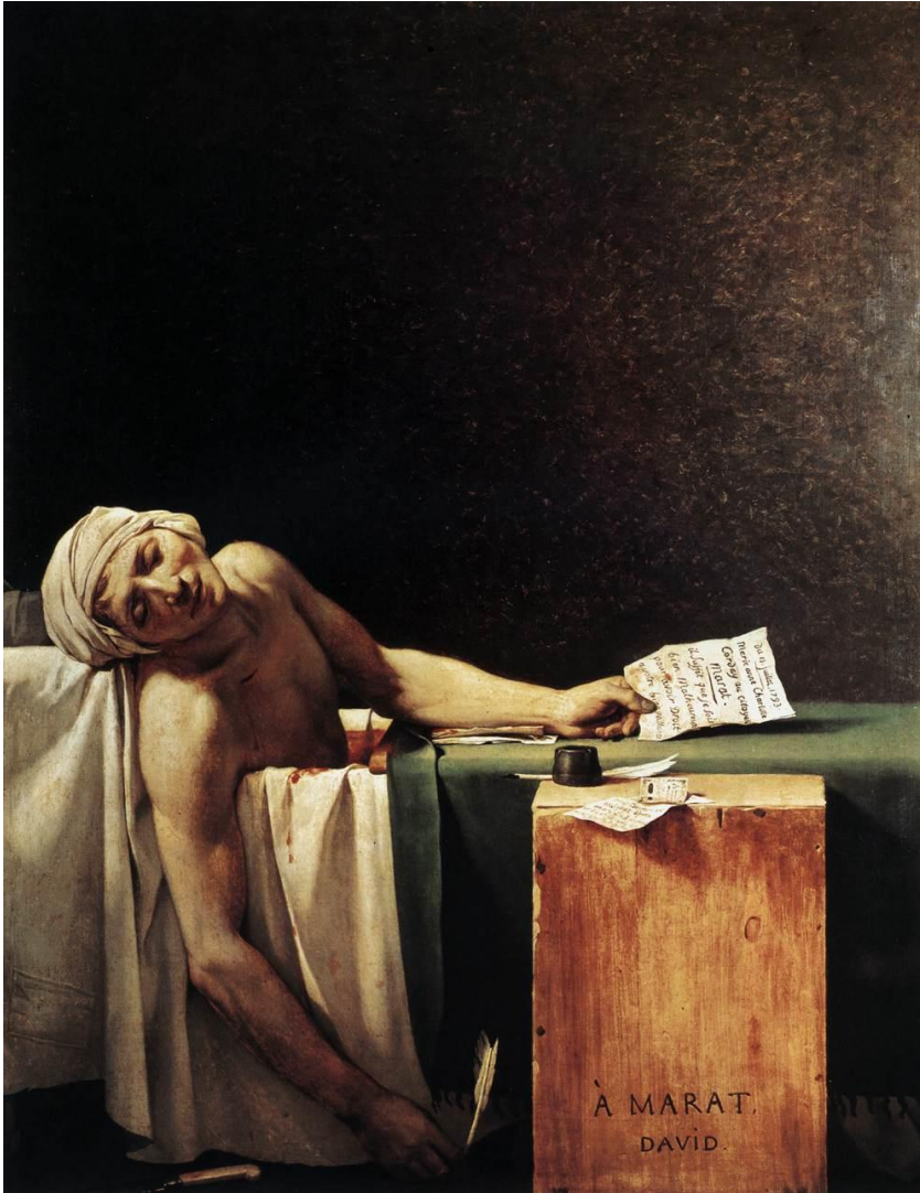
Jacques-Louis David, La mort de Marat , 1793. Collection des Musées royaux des beaux-arts de Belgique, Bruxelles 26

Les références à Marat sont nombreuses dans le récit de Michon, du buste qui traîne dans l'église au moment de la commande, à la comparaison physique à Corentin tout en passant par le tableau lui-même. Le projet de David consiste à célébrer le sacrifice de cette figure importante de la révolution, mais la mise en scène du portrait rappelle directement l'iconographie religieuse, ce qui a comme conséquence d'officialiser son sujet en tant que saint martyr patriote :