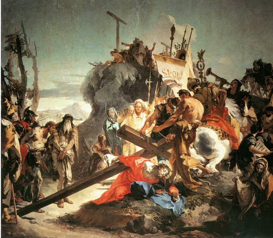
Giambattista Tiepolo, Chemin de croix (Montée du Calvaire) 1737-1738. Sant'Alvise, Venise 19