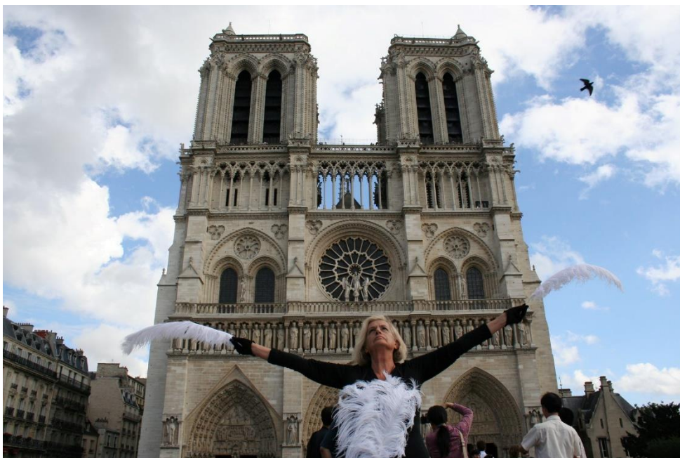
Ottobre 2006. Performance a Parigi nel progetto Atelier Nomade.