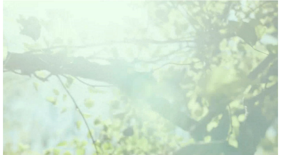
True Mothers (2020)