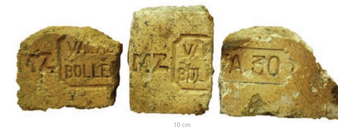
Briques de la société Valabrègue à Bollène Saint-Denis, RSMA-R, 2012

Les cachots, longtemps inaccessibles en raison du couvert végétal, font l'objet d'un programme de réhabilitation. L'opération a livré des informations stratigraphiques permettant de distinguer quatre grandes phases de construction et d'aménagement successives. La mise en contexte historique, étayée par l'analyse des données archivistiques, permet de bien replacer l'évolution de cet établissement dans le contexte plus large de l'évolution des lieux de santé à la période contemporaine (Legros,