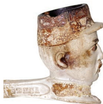
Pipe en kaolin à l'effigie de Mac-Mahon, Saint-Pierre, sur le littoral de Terre-Sainte