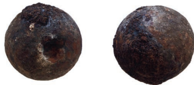
Boulets de canon découverts lors d'un diagnostic archéologique sur le barachois

La problématique industrielle est également majeure à La Réunion. De nombreux sites ont déjà été recensés et protégés dans les années 1990, mais certains restent mal connus dans leur organisation