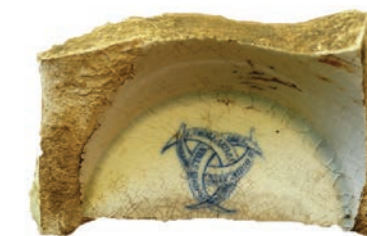
Base de soupière « Johnston Bordeaux » Saint-Denis, RSMA-R, 2012