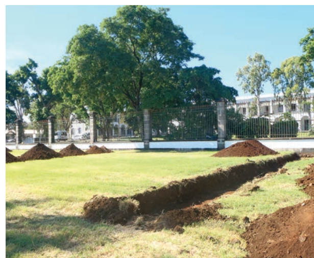
Vue du diagnostic archéologique face à la caserne Lambert à Saint-Denis

Corollaire de l'organisation de l'espace, l'organisation de la société se traduit par la mise en place d'édifices spécialisés. L'archéologie de la détention est particulièrement bien illustrée par de nombreux travaux récents. À Saint-Denis, le site d'une ancienne léproserie, située dans le quartier Saint-Bernard, a fait l'objet d'une opération en 2017. Il s'agit d'un lieu de quarantaine sanitaire destiné à accueillir les lépreux, qui fut construit vers 1855 et abandonné durant le premier tiers du XX e siècle.