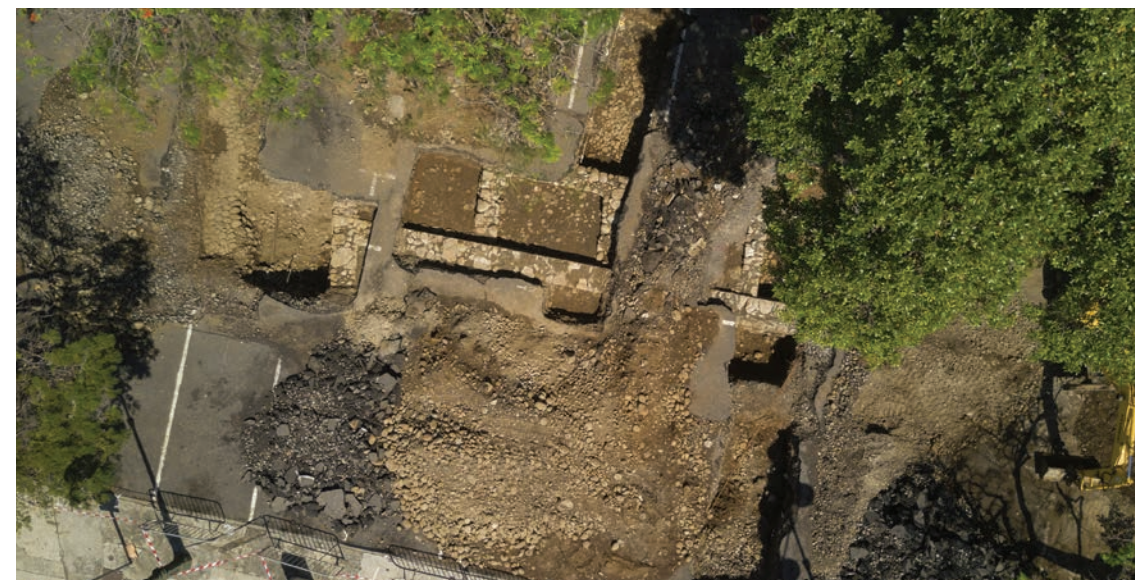
Vue zénithale du diagnostic de la place Charles-de-Gaulle