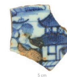
Faïence fine européenne à motif de chinoiserie représentant une pagode, XIX e siècle, Saint-Denis, Projet NEO, 2017