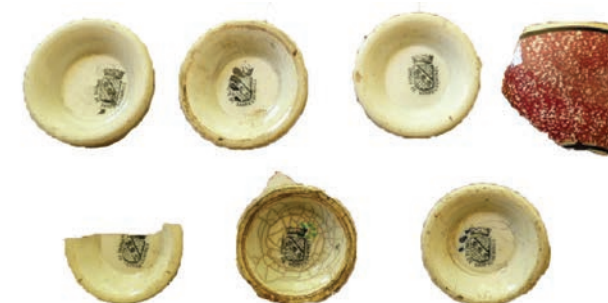
Bases de bols « Opaque de Sarreguemines » Saint-Denis, RSMA-R, 2012