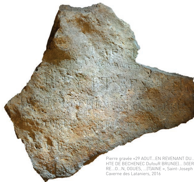
Pierre gravée «29 AOUT...EN REVENANT DU...HERY ET SES FILS... HTE DE BECHENEC DufouR BRUNIE)... [M]ERGOZ TH..... RE...O...N, OGUES, ...[T]AINE », Saint-Joseph - Le Tampon, Caverne des Lataniers, 2016

Si les traces du marronnage sont minces, ce contexte des cavités offre également l'opportunité d'apporter des éléments matériels pour illustrer une pratique qui émerge au XIX e siècle : le développement des explorations autour du volcan. À ce titre, le site de la caverne des Lataniers, fouillée également en 2017 (Motte, 2018), est un exemple emblématique puisque la caverne, qui a pu être occupée antérieurement, fut un important gîte d'étape dans lequel les explorateurs ont