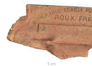
Tuile mécanique en terre cuite estampillée Roux Frères, Saint-Henry (Bouches-du-Rhône), XIX e siècle, Saint-Denis, Léproserie de Saint-Bernard, 2017