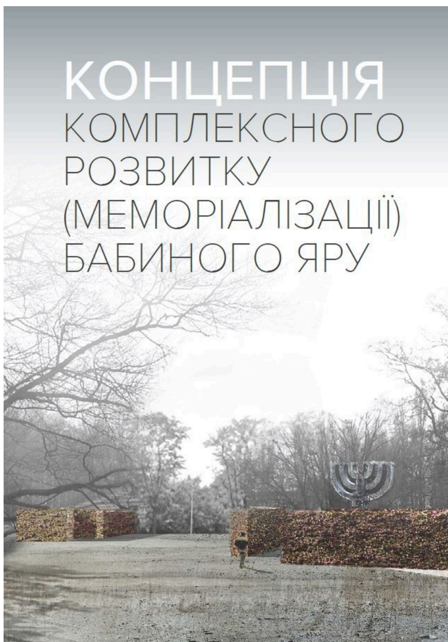
Couverture de la brochure présentant le projet de mémorialisation et d'agrandissement de la « Réserve historico-mémorielle nationale de Babi Yar », 2021.

toutes les victimes, sans distinction, soient honorées : toutes les victimes de la politique raciale nazie, mais aussi les collaborateurs nationalistes ukrainiens qui ont soutenu la politique génocidaire nazie.