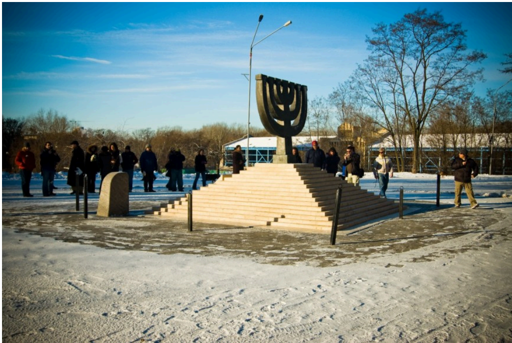
Menora sur le site de Babi Yar symbolisant l'identité juive de la majorité des victimes. Photographie de 2008 de Sarah McGee.

une Menora de bronze est inaugurée [10] , inscrivant dans le paysage mémoriel de Babi Yar que c'est en tant que Juifs que des vieillards, des femmes, des hommes, des enfants ont été assassinés. L'histoire aurait pu s'arrêter là, mais elle continue depuis trente ans, car c'est aujourd'hui un centre mémoriel et un musée qu'il s'agit de bâtir pour donner une narration à un lieu qui manque de lisibilité. Mais quelle narration proposer pour un lieu à plusieurs facettes ?