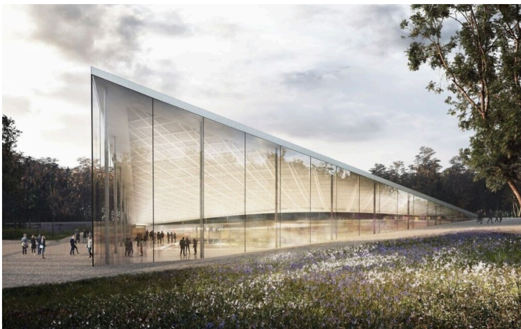
Plans pour le Babi Yar Holocaust Memorial Center, tel qu'il a été conçu pour être achevé en 2026.

présentation officielle, le « premier centre mémoriel en Europe de l'Est dédié à la mémoire de la Shoah sur les lieux même où les événements tragiques ont eu lieu ». En réalité, un autre ravin, dans les environs de Kharkiv a, depuis 2002, son modeste complexe mémoriel ayant réussi à régler les deux problèmes principaux : trouver un financement et avoir le droit de construire sur le terrain [19] . A priori, tout s'annonce relativement bien pour l'ambitieux projet kiévien né sous les meilleurs auspices puisqu'ils ont les deux.