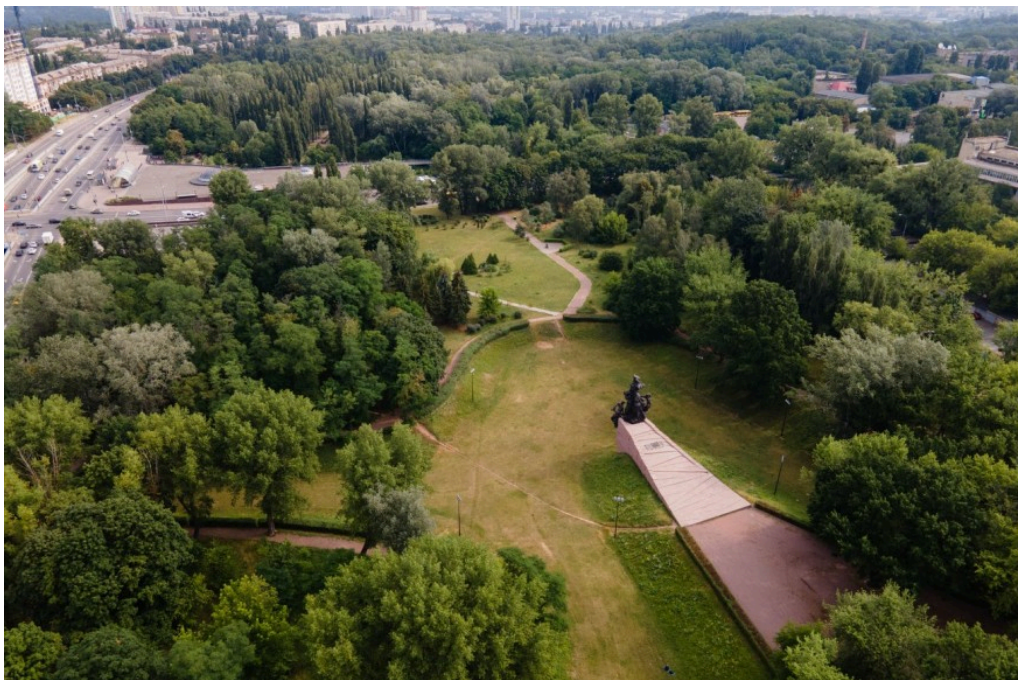
Vue aérienne de Babi Yar.

Après l'invasion de l'Ukraine par la Russie, Lisa Vapné a ajouté en fin de texte quelques paragraphes relatifs au bombardement du site de Babi Yar