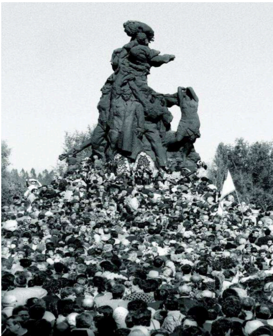
Inauguration le 2 juillet 1976 du monument aux citoyens soviétiques et prisonniers de guerre tués à Babi Yar, Kiev.