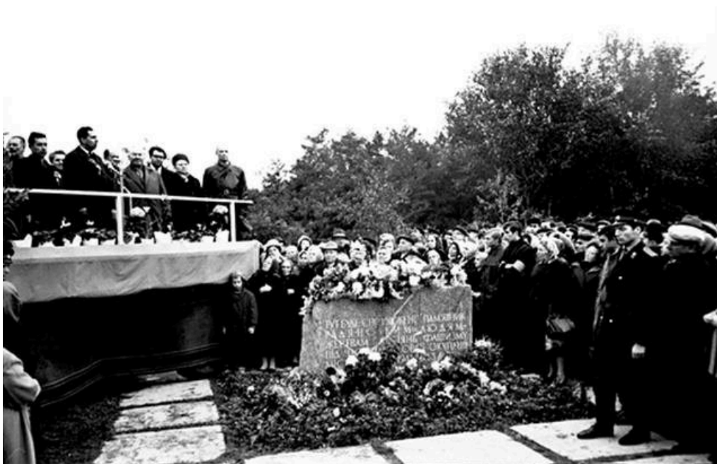
Rassemblement de septembre 1968 à Babi Yar, devant la pierre où apparaît l'inscription barrée.

Produire de l'oubli en imposant le silence s'avérant peu efficace, les autorités ukrainiennes soviétiques décident finalement de l'érection d'une simple pierre tombale où il est écrit, en ukrainien : « Ici va être érigé un mémorial aux Soviétiques victimes des crimes du fascisme pendant l'occupation de la ville de Kiev entre 1941 et 1943 ». L'inscription sur cette pierre – où les Juifs sont omis volontairement – est très rapidement barrée d'un trait par une main vengeresse. Paradoxalement, cette pierre donne à ceux qui veulent commémorer Babi Yar un lieu autour duquel se rassembler [7] – alors que plus rien ne demeure dans la morphologie du ravin qui puisse rappeler le lieu des exécutions.