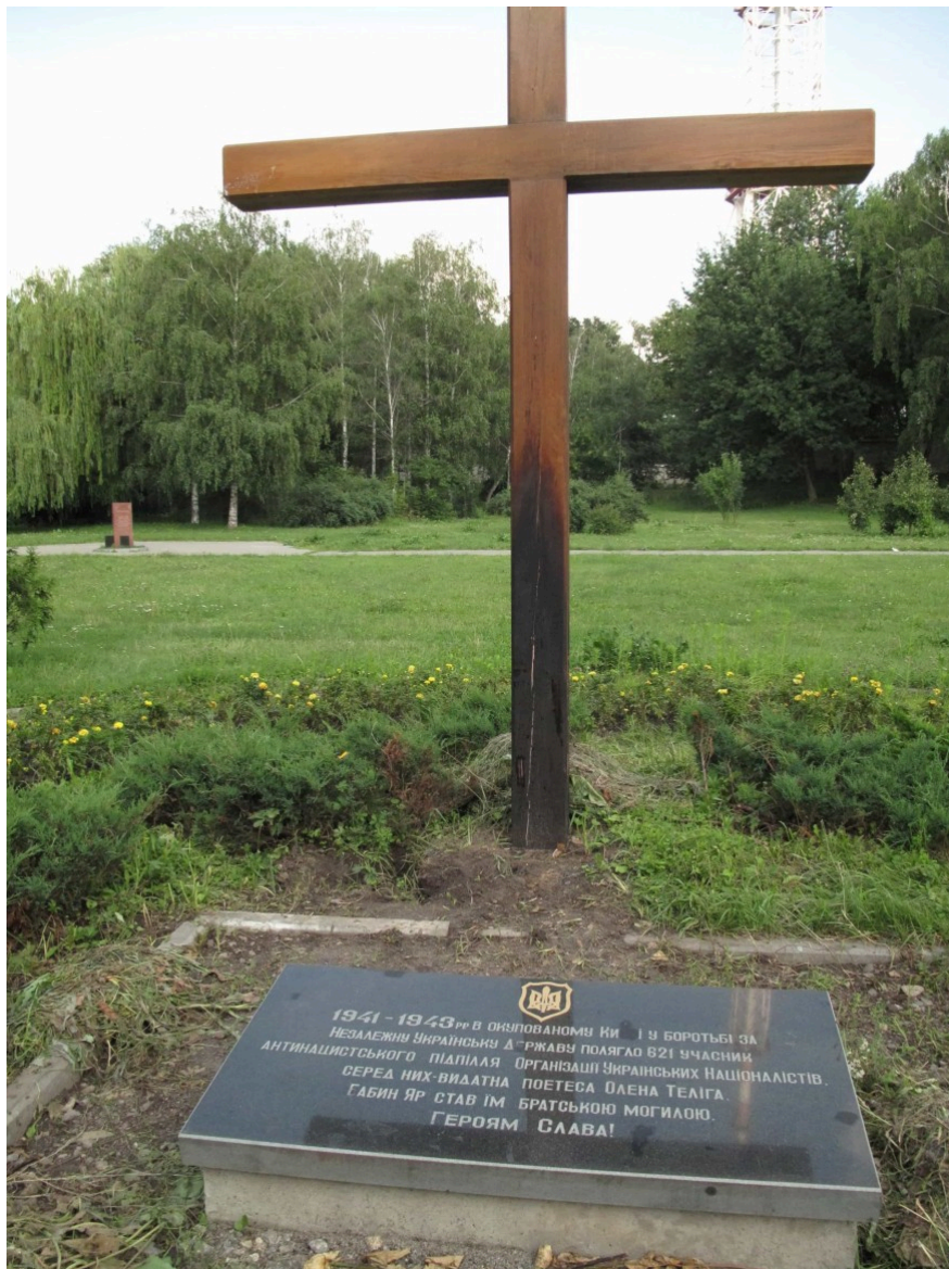
Croix et stèle à la mémoire des 621 membres de l'Organisation des nationalistes ukrainiens, dont la poétesse Olena Teliga.

Aujourd'hui encore, en 2021, environ trente monuments distincts jonchent le territoire de Babi Yar. Trente symboles qui permettent certes de sortir de l'indifférenciation ethnique et de la typologie des crimes, qui a caractérisé ce lieu à l'époque soviétique, mais qui éparpillent les mémoires du lieu et ne le rendent absolument pas intelligible pour un visiteur. Parmi ces pierres, certaines sont des promesses de centres mémoriels de la Shoah qui n'ont jamais vu le jour.