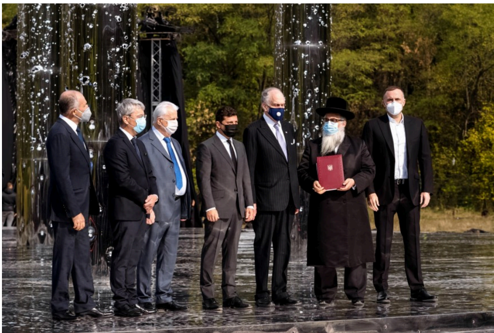
Sur le site de la commémoration du 29 septembre 2020 : le président ukrainien Volodymyr Zelenskyi et les membres du conseil d'administration du BYHMC : Leonid Kravtchouk, Ronald Lauder, Yakov Dov Bleich.