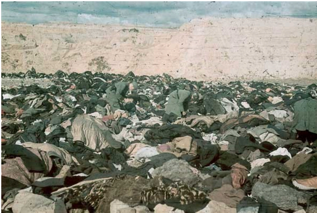
Des SS fouillent les affaires des Juifs assassinés début octobre 1941.

considéré comme l'un des centres d'anéantissement de la Shoah. Ce sont des Juifs qui en très grande majorité y ont été exécutés entre 1941 et 1943, même si d'autres groupes y ont aussi été fusillés : Roms [3] , prisonniers de guerres soviétiques, combattants du mouvement nationaliste ukrainien (OUN), prêtres orthodoxes, Ostarbeiter , malades d'un hôpital psychiatrique avoisinant. Parfois tués ailleurs, leurs dépouilles ont été jetées dans le ravin. Puis, après la fin des massacres, à l'été 1943, les traces du génocide ont été en partie effacées par les nazis dans le cadre de l'opération 1005 d'exhumation et d'incinération des corps.